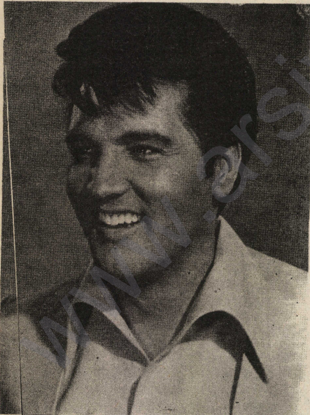
ELVİS LI XERIBIYE (Amerîka)

Ji ber ku wan nedixwestin vê rastiye qebûl bikin. Bi-taybetî jî zimanzanên Amerikayî li xwe heyirîbûn, şaş