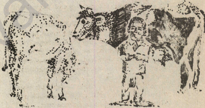
Elvîs (Kêrto) li ber golika

Ez li wî serî Ezliwiserî Elwiserî Elwis ELVIS