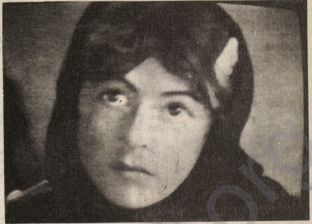
Herlibendê; agirê dilê Elvîs, evîna wî ya yekemîn û dawîn.

cewsê surgûnî Şikagoyê kirine. Ew jî mecbûr maye bi bavê xwe re çuye Şikagoyê.