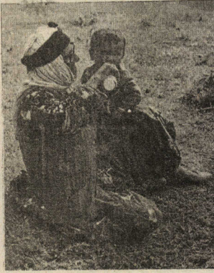
Elvis di hambêza diya xwe de.