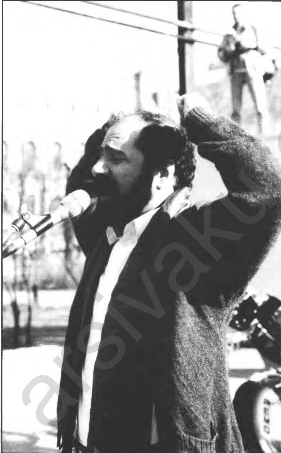
"Yüce değerlerin inkar edildiği vatan parçası özgür olamaz!"

Şimdi bazıları çıkmış bana çamur atıyor. Vay efendim tam da silahların patladığı bir ortamda "Serok" u öven, onu yücelten türkü yakmamış, onun yanında yerimi almıyormuşum! Zembilfroş gibi bir Kürt halk destanını dile getirmişim... Sanki Zembilfroş bir sömürge destanıdır. Yazıklar olsun! Zembilfroş'un bir direnme destanı olduğunu görmeyenlere ne demeli, bilemiyorum? Zembilfroş kadar direnen, namuslu, halkına, geleneklerine bağlı bir destan kahramanına rastlamak zordur tarihte. Ama gel gelelim bizim uğursuz seslere... Sözüm ona Kürt yurtseveri geçinip de Kürtçeyi kavrayamayan veya kendi anadilini küçük gören, onu geliştirmek için en ufak bir çaba göstermeyenlerin, bana bu konuda çamur atmaları, ders vermeye kalkışmaları tek kelime ile utançtır, rûşesîdir, milyonlarca dinleyicime karşı saygısızlıktır... Zembilfroş'u, Mem û Zîn'i, Ferhad û Şîrîn'i kavgada görmeyenlerin Kürdistan lafını bile ağızlarına almaları abestir bence. Kavgamız bir bütündür. Kürt halkı ölüm ile sevgiyi hep iççe yaşamış bir halktır. En çetin ve en zor koşullarda bile Kürt halkı direnme