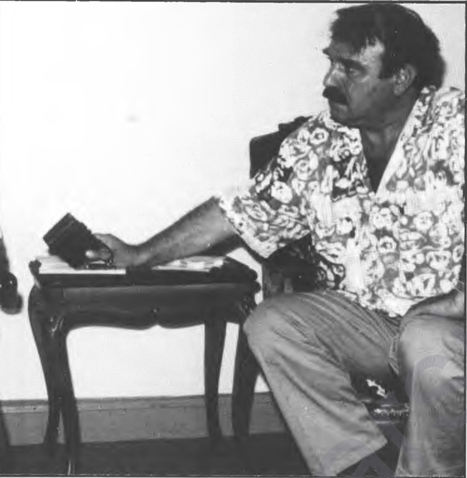
leştirerek, Kürdistan’ı mümkün olduğu kadar daraltıcı bir politika izliyorlar”

altını çizdiğiniz suur altı sömürgeci değerlerle kuşanmış yaklaşımların doğal bir sonucu mudur?