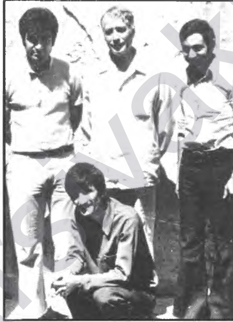
Musa ANTER Diyarbakir Cezaevi'nde (ortada), 1974

Daha sonra cenazenin polis tarafından Nusaybin'e bağlı Zivingê köyüne götürülerek gömüldüğü öğrenildi. Polisin, siyasi bir gösteriyi önlemek amacı ile, cesedi gizlice kaçırmasına rağmen, cenaze töreninde binlerce insan bulundu, binlerce Kürdistanlının da akın akın mezarı ziyarete geldiği bildirildi.