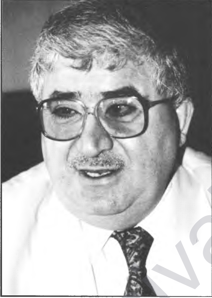
Başbakan Dr. Fuad Mahsum, aynı zamanda Felsefe Doktoru

□ Ekonomik sorunların çözümü için programınız neyi öneriyor? Ekono-