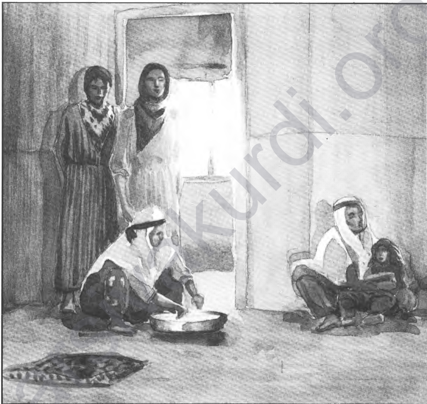
Desen: Albin MICHEL

si, gurcîkî, ermenî di berevoka da: "Klamê yê ciwana" (sala 1957-a); "Şîez û pcêmê Kurda" (sala 1956-a); "Rya Teze" (sala 1958-a); "Mêjvema û çîrok" (sala 1959-a) "Poetê Kurdên Sovêtyê" (sala 1962-a) "Bahara me" (sala 1964-a) "Distirê sazê min" (sala 1966-a) "Bin teva Gurcistanê da" (sala 1972-a) "Pionêzê Alagîzê" (sala 1975-a) "KEVya Kanîya zelal" (sala 1977-a) "Sîmê tembûrê Kurdî" (sala 1986-a)