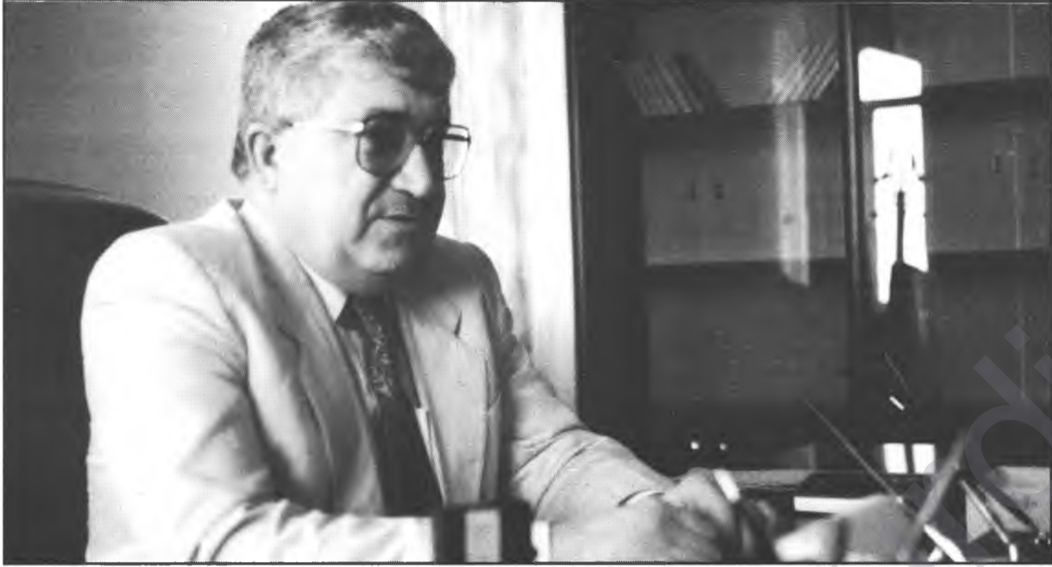
Başbakan Mahsum: "Biz, bütün Kürtlerin, Kürdistan'daki bu yeni tecrübemize destek olmalarını bekliyoruz."