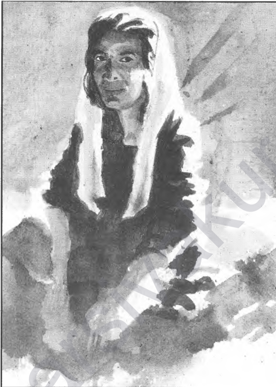
Desen: Albin MICHEL