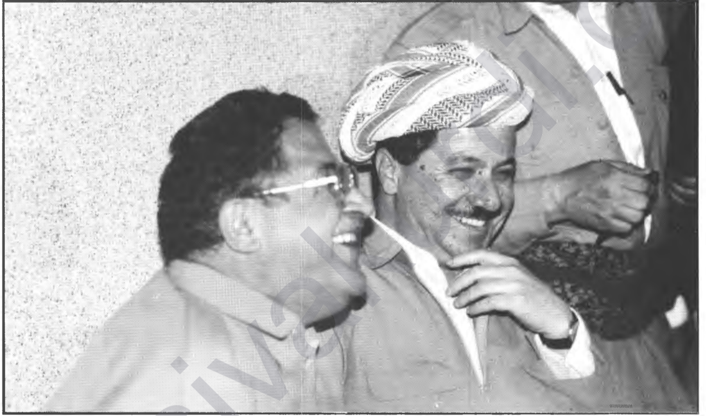
C. Talabani ve M. Barzani'yi zor günler bekliyor. Güney Kürdistan, kış aylarında açlıkla boğazlaşacak!

(...) Umuyorum dünya bize özel bir şekilde davranacak. Ben kişisel olarak Kürt yönetim işleriyle BM'nin ilgilenmesini tercih ederim, Bağdat aracılığıyla değil. Çünkü bu her zaman problem