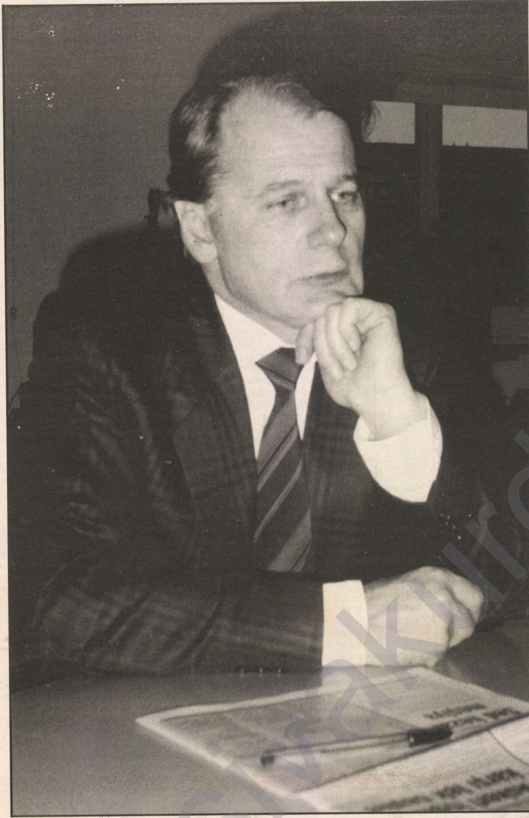
Center Parti Genel başkanı Olof Johansson: “Evrensel konularda bütün sanayileşmiş ülkelerin, Kuzey Amerika’nın, Avrupa’nın alınan kararı tanıması gerekir. Bu da Birleşmiş Milletler’in kanalı ile olur. Yoksa, biz devlet olarak tek başımıza bir şey yapamayız. Ses tonumuz yüksek olsa bile...”

Ben ve Olof Palme’nin evi aynı istikametteydi. Özellikle parlamento çalışmalarının geç saatlere kadar devam ettiği günlerde, Palme ve ben taksiye binerek eve giderdik. Evet, tam Palme’nin BM Genel Sekreteri’nden arabuluculuk teklifi aldığı günün akşamı taksiyle evimize doğru gidiyorduk. Yolculuk boyunca Palme, benim düşüncelerimi öğrenmek için bir konuda devamlı soru soruyordu. İyi hatırlıyorum karlı bir kış akşamıydı. Palme aynen şunları söyledi: “İran-İrak savaşında arabuluculuk görevini alayım mı yoksa almayayım mı?”. Ben bir şey demedim, ağır davrandım. tabi kendi sorusunun cevabını da kendisi verdi: “Böylesi bir göreve ‘hayır’ denilemez ki!” Hayır denilemeyeceğine Palme’nin kendisi ikna olmuştu. BM Genel Sekreteri’nin vasıtasıyla insana bir