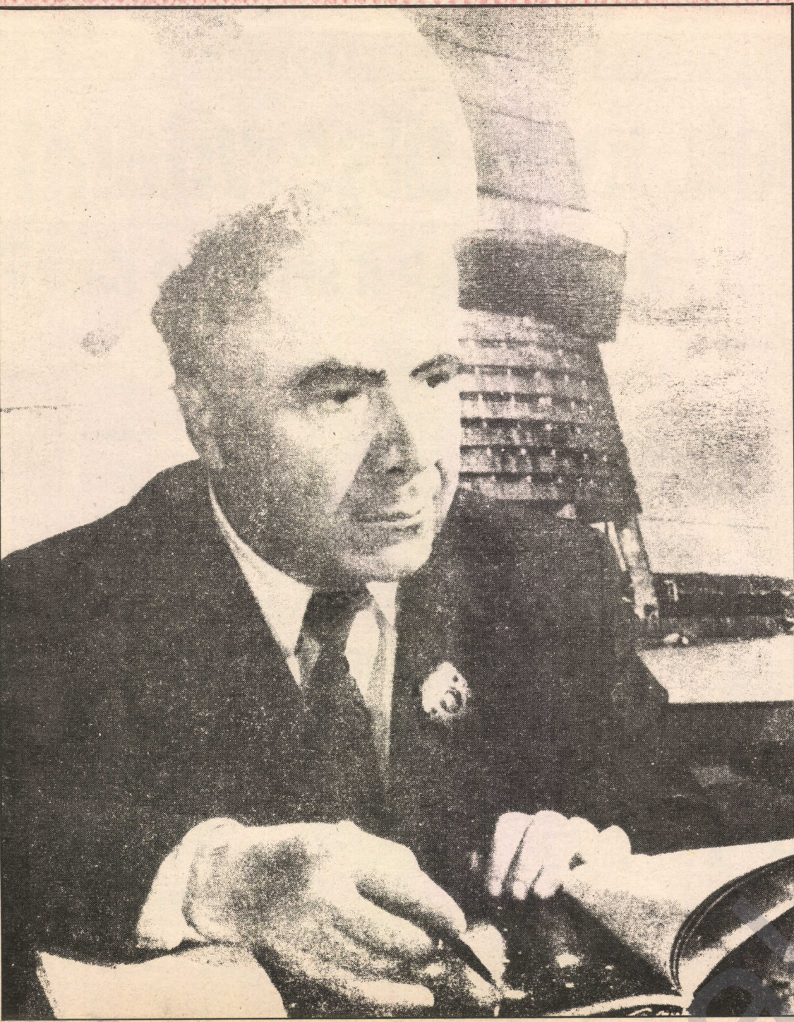
Serokê Akademiya Zanistî ya Ermenîstanê Viktor HAMBARSUMYAN