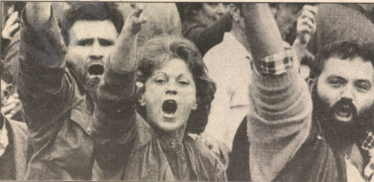
Neteweperestên sirbistanê li dijî Ernavudan di rojên dawî de gelek protesto çêdikin.