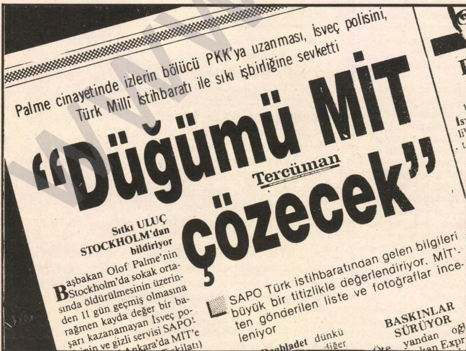
Türk basını Palme Cinayeti'ni MIT'in çözeceği iddiasındaydı!