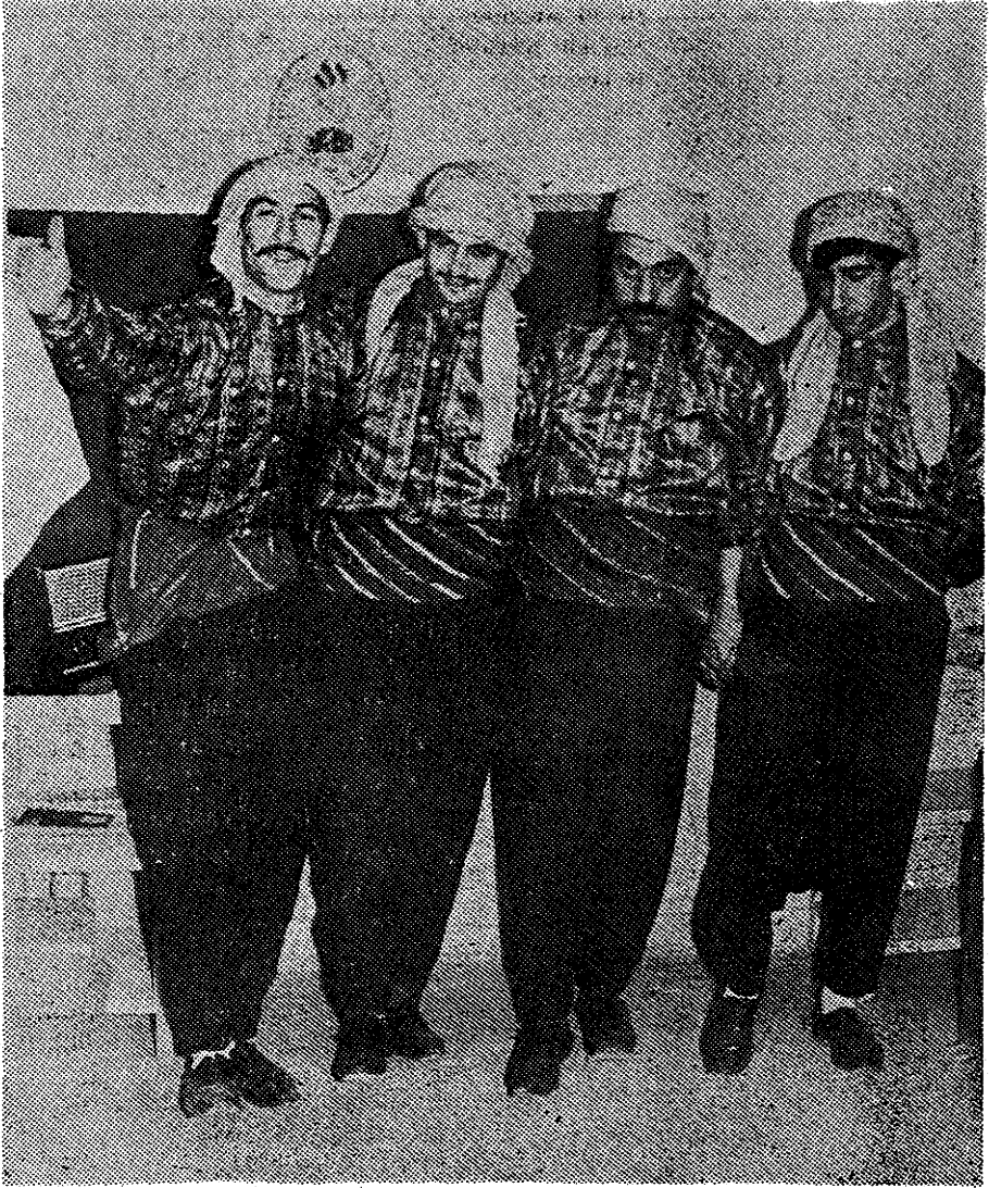
Başarı 8 Nisanda