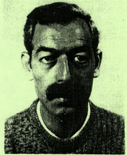
ZEKİ ADSIZ (K.SALEH) TSK GENEL SEKRETERİ ORK AS. KONSEY BŞK.