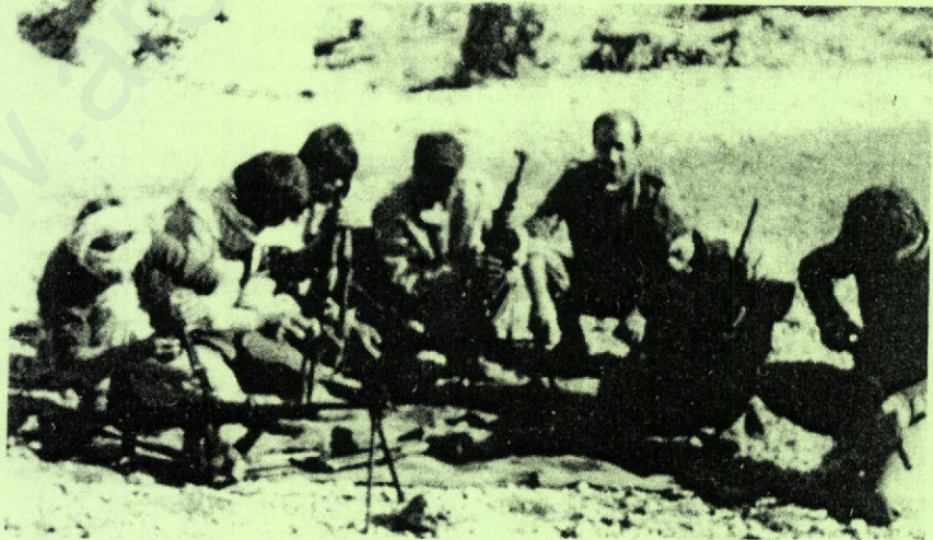
PEŞMERGE GÜNLÜĞÜ'NÜN DEVAMI

Üst yapı, mevcut temelin korunmasına, sağlamlaştırılmasına ve geliştirilmesine yardımcı olur. Toplumsal bir bilim olarak Ekonomik Politik, üretim ilişkilerini, üretici güçlerle ve üst yapıyla karmaşık etkileşimleri içinde inceler. Bu mekanizmayı anlamadan üretim ilişkilerinin, toplumun ekonomik temelinin gerçek niteliğini anlamak olanaksızdır.