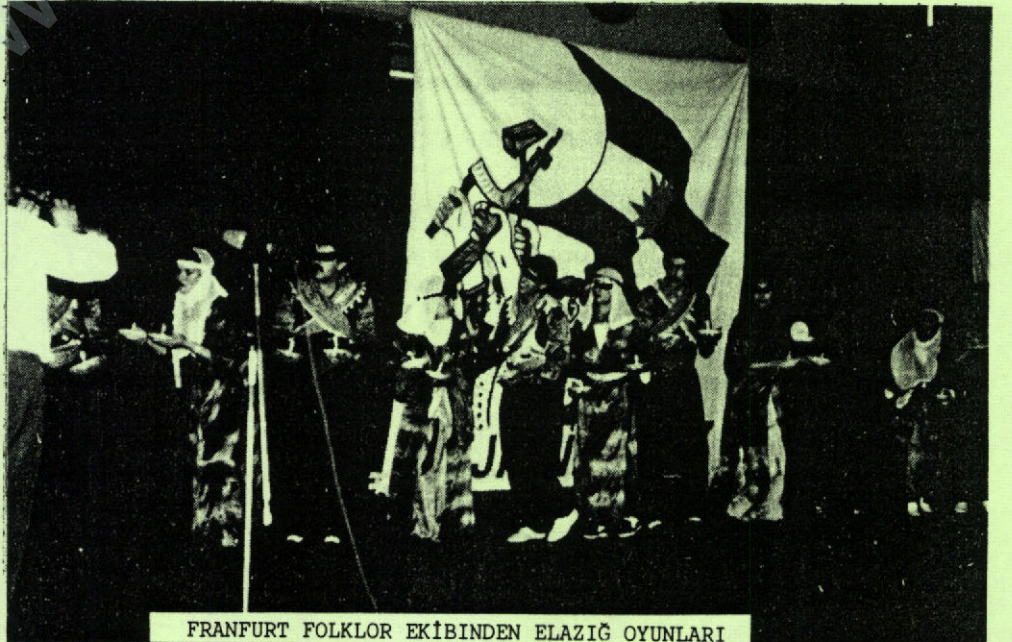
FRANFURT FOLKLOR EKİBİNDEN ELAZIĞ OYUNLARI