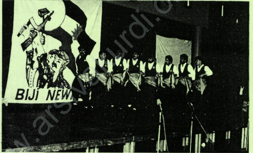
BREMEN FOLKLOR EKİBİNDEN BİNGÖL OYUNLARI