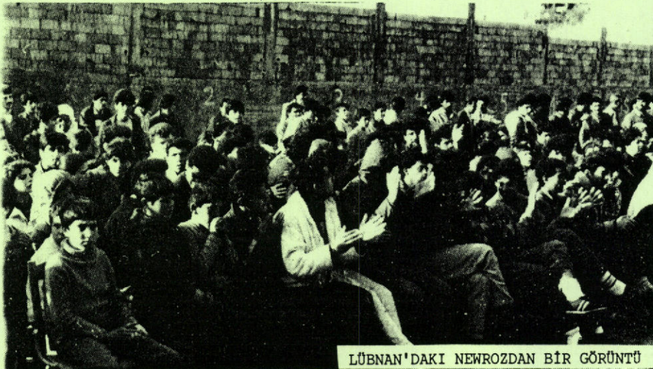
LÜBNAN'DAKI NEWROZ'DAN BİR GÖRÜNTÜ

Program, Koro'nun ey newroz marşını söylemesiyle açıldı. Saygı duruşu ve ardından TSK Avrupa komitesi adına bir yoldaşın yaptığı konuşmayla sürdürüldü. Konuşmada, yaşadığımız sürecin önemi, mücadelenin gelişim seyri, TSK olarak bu süreçte nasıl müdahale etmek istediğimiz ve bu doğrultuda