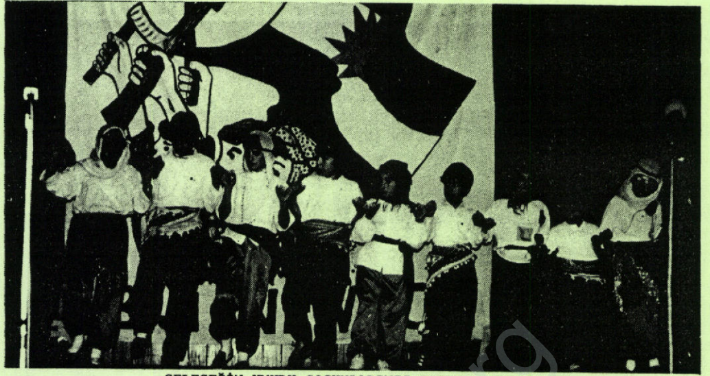
GELECEĞİN UMUDU ÇOCUKLARIMIZ BREMEN NEWROZUNDA

Yaklaşık 450 kişinin katıldığı gecede sunulan zengin program disiplinli bir çalışmanın ürünü olduğunu açıkça gösteriyordu. Newroz marşıyla yapılan açılışın ardından saygı duruşu ve TSK Avrupa Komitesi adına konuşma yapıldı. Aynı metin Kürtçe ve Almanca olarak sunuldu. Süreci değerlendirmemiz, bu süreçte TSK olarak, yapmış istediklerimiz ve attığımız adımlar