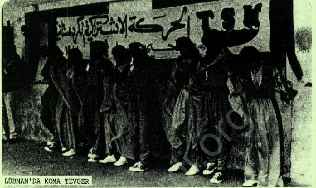
LÜBNAN'DA KOMA TEVGER

Ayrıca değişik yerlerde ateşler yakıldı; Newroz ateşi silahların ateşleriyle birleşerek yankılandı.