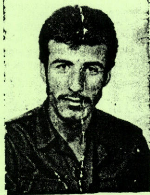
Jı xwe 15-20 roj berê kuştina Xıdır, disan hêzên kolonyalist lı gundê Calûdiyê kur-

Jı bo protestokırına vê bûyera rûreş û tewanbar, meşek pêk hat, bê hejmar kes beşdarê meşê bûn. Lı dij bûyer û kırımên leşkerên kolonyalist, rık û nefrete xwe dan diyarkırın.