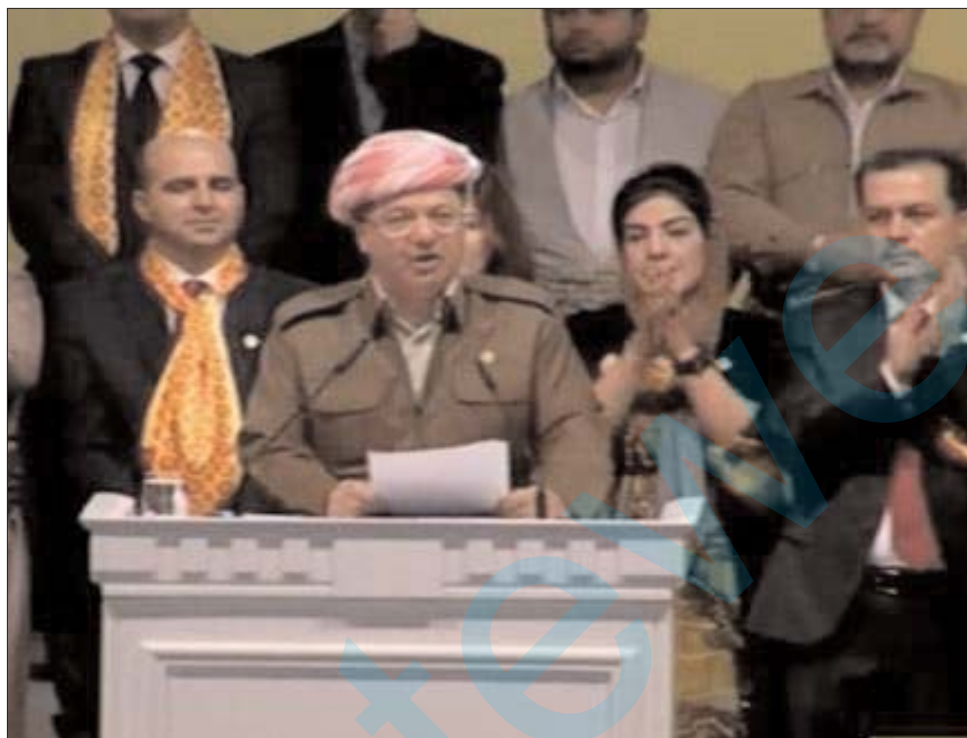
û rêbaza Barzanî yê Nemire

û erkekî girana neteweyî li ser şanê wê ye ku divê encam bide û pêkbinê û eve jî bi hîmeta we yên serbilind û qehreman û bi berxwedan û aştîxwazî û tevgerên serdemiyanê û demokratî tê kirin. Wekî çawa Partî xwedî mîras û dîrok û çandeke dewlemendê neteweyîye, divê niha û paşarojê jî pir bê li serwerî û destkeft û pêsketin û xizmetkirina kiyana neteweyî. Hun dahênerê demokratî û azadîxwazî û pêkvejiyan û pêsketina Kurdistanê ne û her divê hun jî biparêzin û geştir bikin. Xizmetkirina gel û welat mîrata Partî