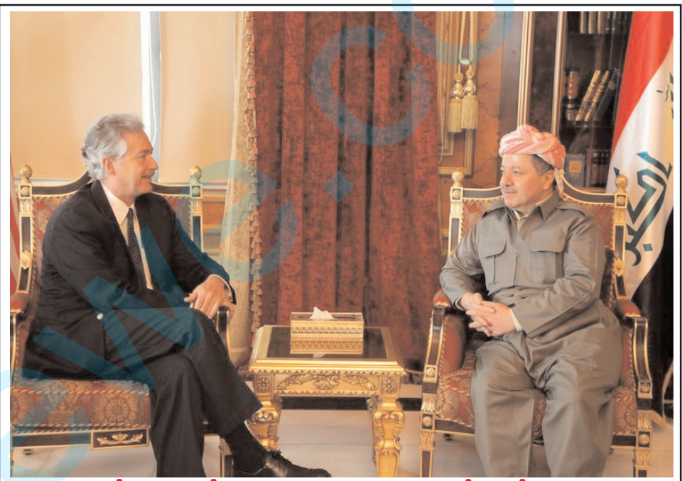
Serokê Herêma Kurdistanê pêşwaziya Cîgirê Wezîrê Derveyê Emerîka kir