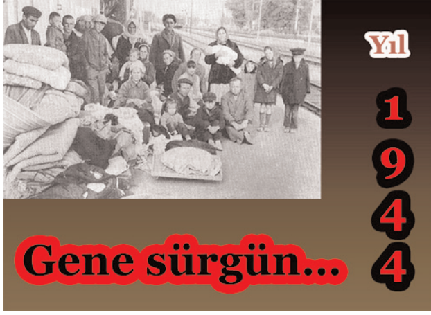
Əvvəli ötən sayımızda

1950'li yıllardan sonra eğitim konusunda bir gelişme yaşanmış ise de Kürdlerin genel okuma düzeyi, Kırgızistan'da yaşayan diğer bir çok halkın gerisinde kalmaktadır. Yaşlı neslin yalnız yüzde biri orta veya yüksek tahsile sahiptir. Orta nesil ve gençler arasında eğitim düzeyi sevindirici boyutlara ulaşmıştır.