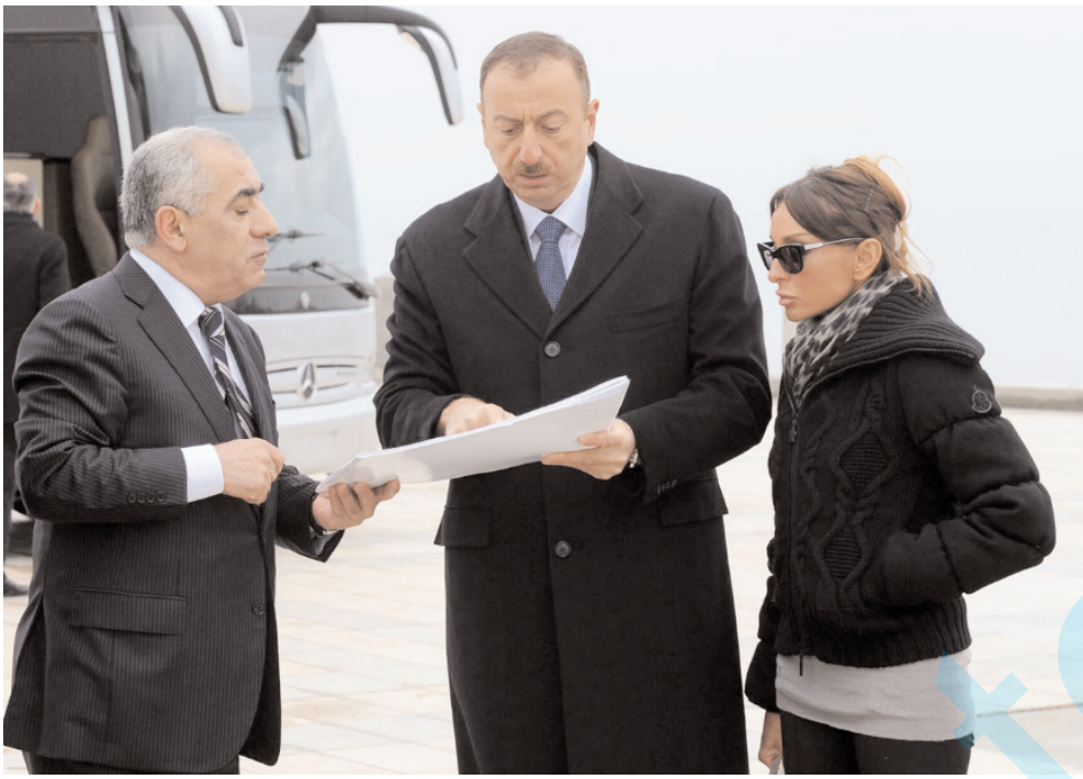
İlham Əliyev Dövlət Bayrağı Meydanı və onun ətrafında həyata keçirilən tədbirlərlə tanış olmuşdur