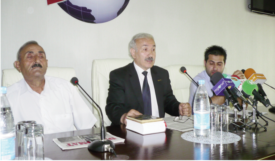
Əvvəlki səh. 1-də

Görəsən nəyə əsasən Rəbiyyət xanım və ya başqası kürd xalqının haqlarını “müdafiə” etməlidir. Olmazmı yuxarıda sadaladığınız 20-i millət vəkiliindən biri qeyrətə gəlib kürd kimi meydana çıxsın və kürd xalqının mənafeyini müdafiə etsin.