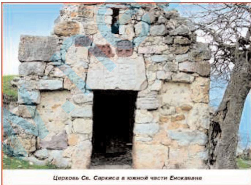
Церковь Св. Саркиса в южной части Енокавана

Согласно историческим данным в окрестностях