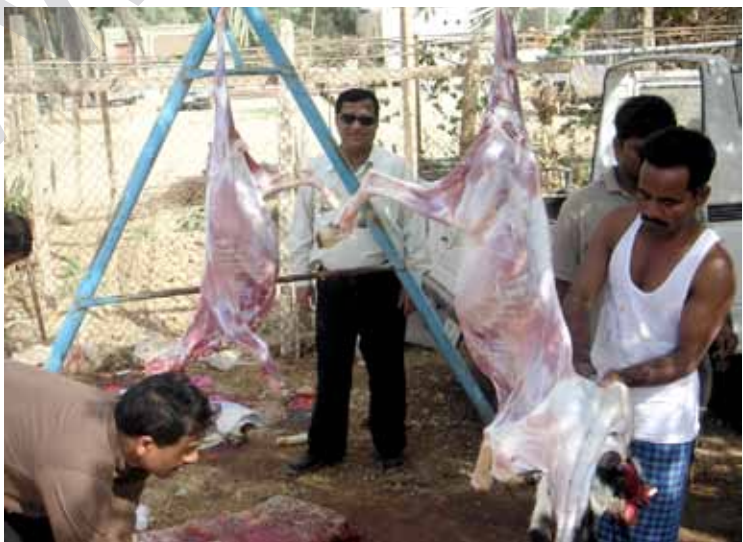
راپۆرتیکی کەرکوک بەرپرسیانی کەرکوک بەناکا هیناوە

شۆپتیککی گونجاو بۆسەرپزینی ئازەلی مائیی، ئیدارەیی کەرکوک پزیرایدواوە لەپێگای لێژنەیی و بەرەرەهینانەو ئەو قەسابخانە نمونەییە دروستیکات.