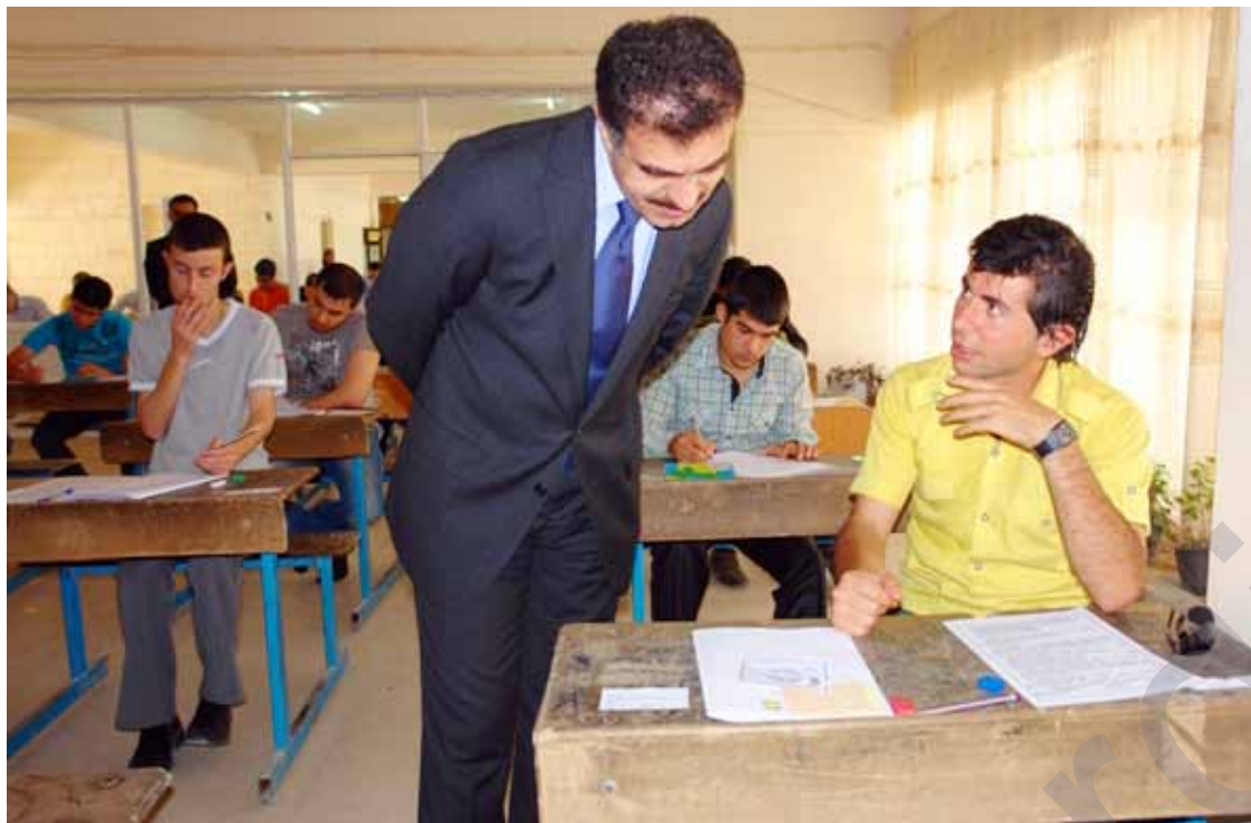
ھیچ ھەولێکی دڵخۆشکەر بۆخوێندکارە وەرئەگیراوەکان نییە

نۆرەدینی وتی "ئێ و ھەمووی پێشنیارن و گفتوگۆی لەسەرکراوە تا لەداھاتویدا لەگەل