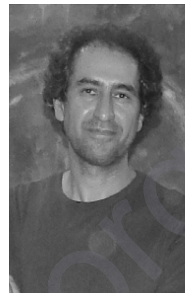
نيسماعيل حه مه نهمين