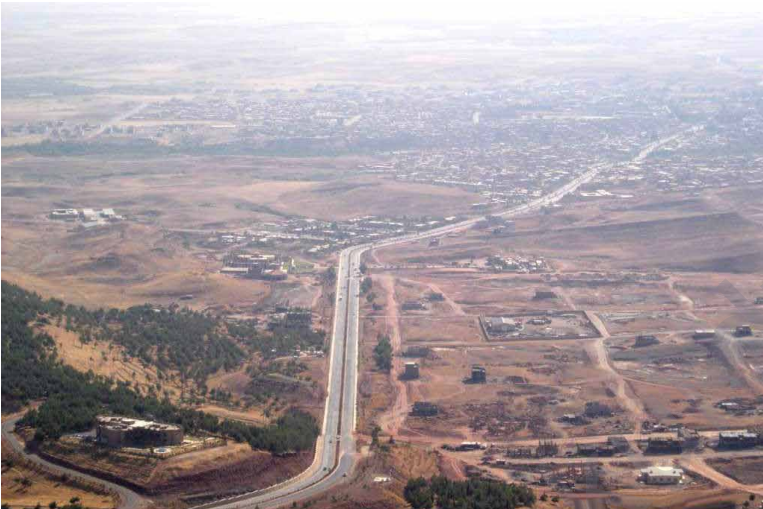
دەرھێنانی بەرمیلێک نەوت (٧) بەرمیل ناو خەسار دەکات

شارەزایانی بواری ژینگە کە شۆھەواو ترسی خۆیان لە سەر تێکچوونی ژینگە ھەریمی کوردستان نیشاندەدەن و بێپلانی حکومەتیش لە ڕووی گۆرینەدان بە کەش و ھەواو ژینگە بە ھەترسی گەورە دەزانن.