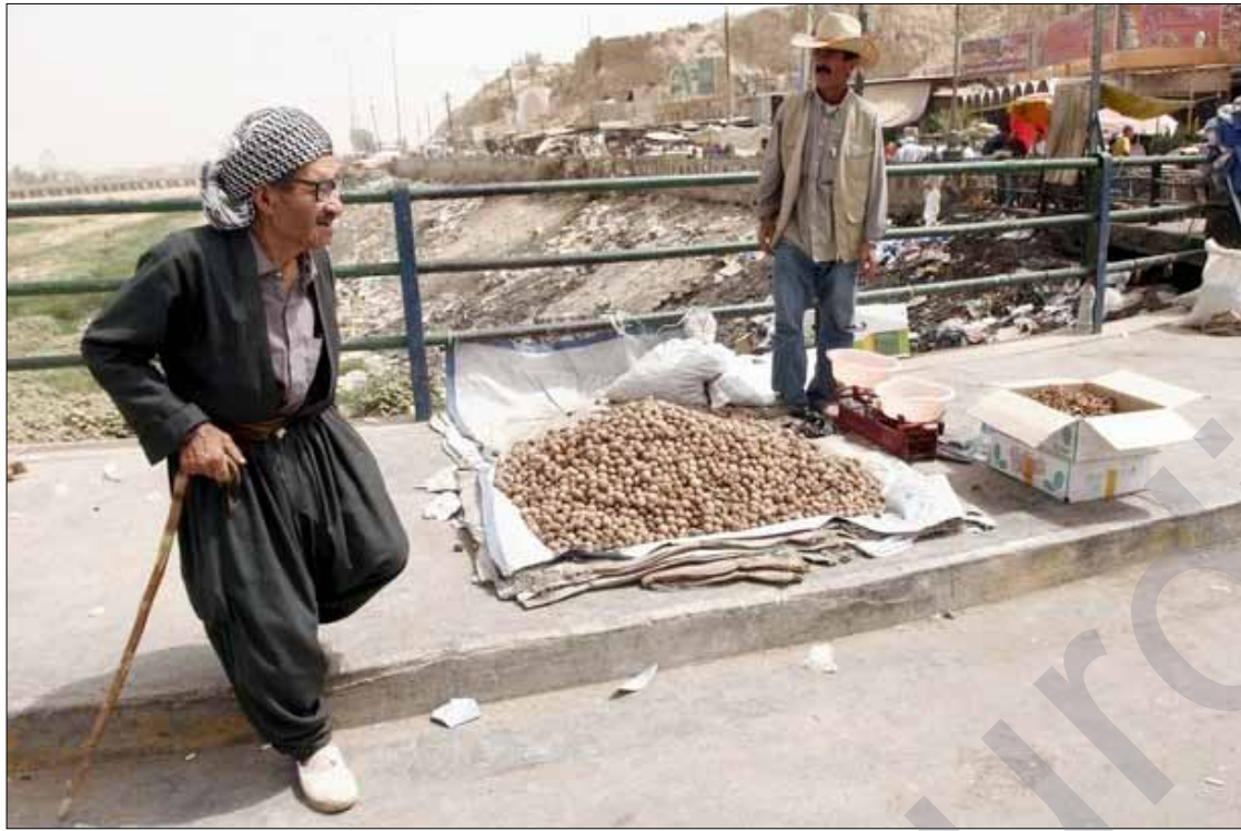
ناوچەدابراوەکان لەکۆچەو بۆ کۆچ

گوندنشینانی ناوچە دابراوەکان بەلێشاو گوندەکانیان چۆلەدەکەن و پوووە شارەکانی هەرێم دەروڤن، خراپی بارودۆخی ژانیان و گۆتەدانی حکومەت بەگوندنشینان، چۆلیبونی شارەکانی زیاتر کردوو.