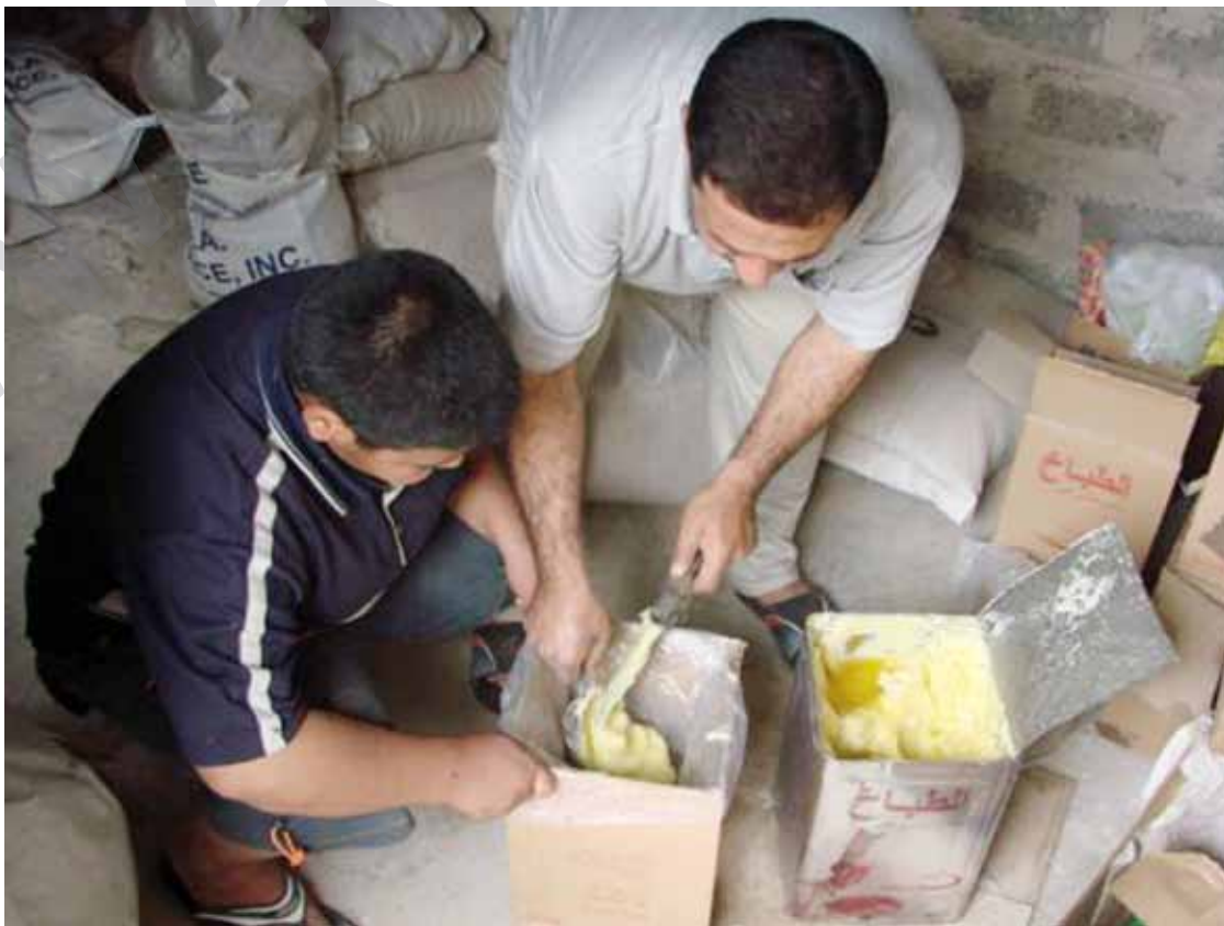
هەبوونی كۆبۆنى خۆراك تەنها پۆزانی سەختمان بێردەخاتوه

كۆبۆنەى كە شەرى لهگەلداهات و خێر هەمووی پۆشت.