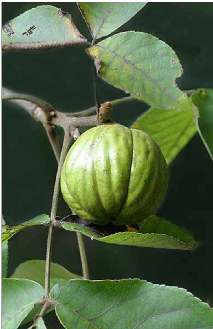
گوڭزى ئيسرائىلى توگلى تەنگە

ئەمسال گوڭزى زۆربەى گوندەكانى دەقەرى چۆمان پوچ و كرمى بوون، جوتيارهكانيش پوويان له گوڭزى ئيسرائىلى كردوه