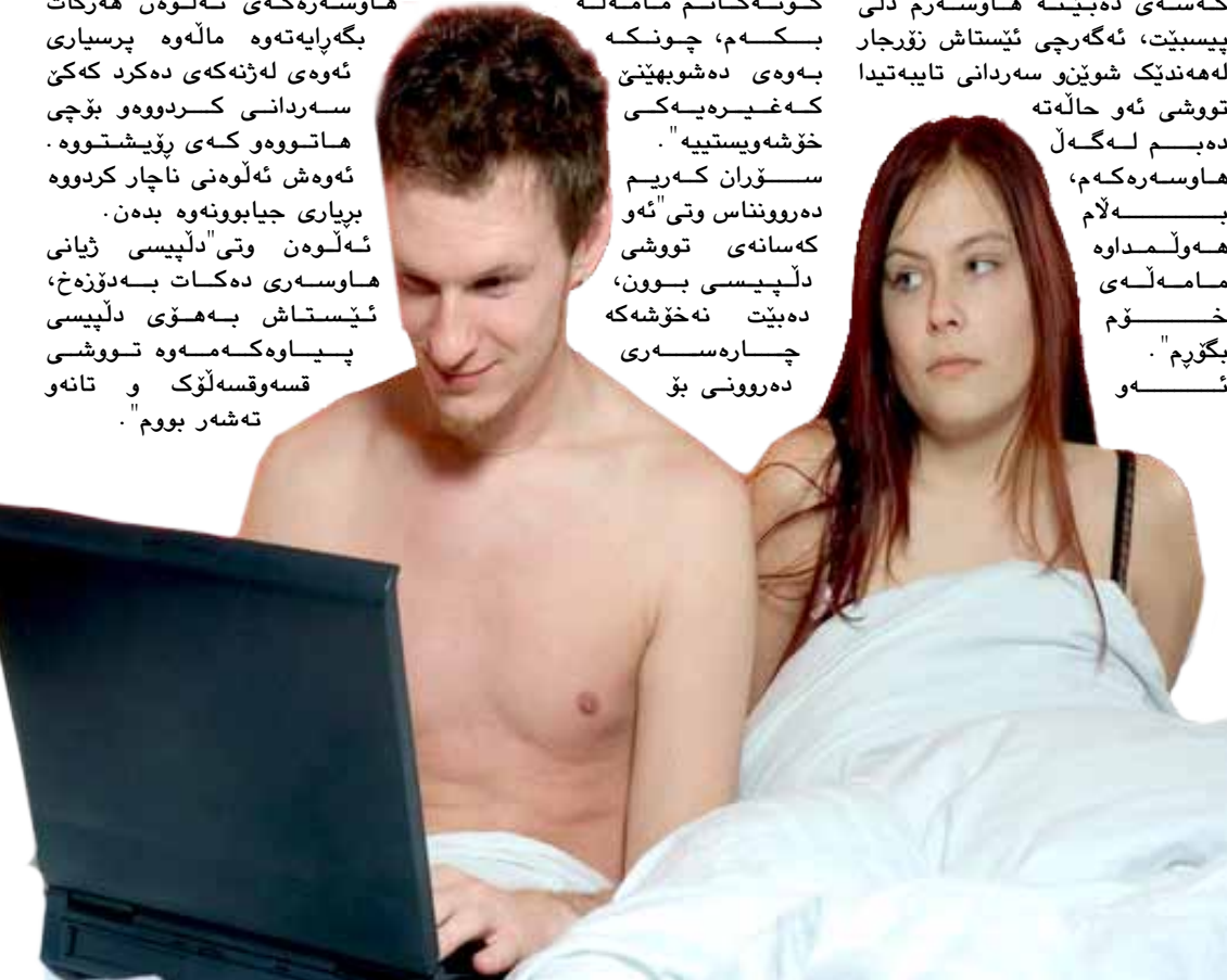
"پياوه كه م به جوړيكي كه ناتوانم له گه ل هاورپي كونه كانم مامه له بكم"

ټيتر عه لى له سلطمانى "هه موو كات كه كورپي قوز ده بينم سه رنجم راده كيشټت، به لام پياوه كه م به هوى ټوه وه دلى لټييس كړدوم"، شهنگه كه چندين سالتيكه شووى كړدوه وتي "دلپيسى پياوه كه م ناره ته تى كړدوم". ټو ژاننه ي كه پياوه كانيان دلى لټييس كړدوون ټامازه بووه ده كهن كه ته نها دلپيسى ژيانى هاورسرى ده كاته دوزخ، هه نديك له ټو وان ټو ټوه ي پياوه كانيان دلپيان لټييسنه كات له به رچاوى پياوه كانيان ټو مامه له و هه لس و كه و ته ناكهن كه به دلپيان نييه. شهنگه جبار ټامازه بووه ده كات كه له سهرده مى كچټيدا هه مووكات بيري له وه كړدبووه و پيشنه وه ي بريارى دروست كړدى ژيانى هاورسرى بدات، ده بټت بير له وه بكات وه كه ټو كه سه ي ده بټت هه موو هاورسرى دلپيسى يان نا. شهنگه وتي "زور ده ترسام كه ټو كه سه ي ده بټت هه موو هاورسرم دلى پيسټت، ټو گه ر چي ټيستا زورچار له هه نديك شوټنو سهردانى تاييه تيدا توشى ټو حاله ته ده بټم له گه ل هاورسره كه م، به لام هه ولماوه مامه له ي خوم بگورم". ټوه