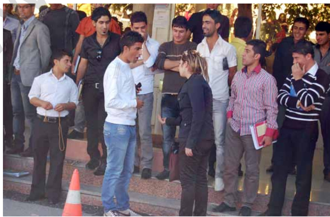
چەند خویندکاریک "قیق" لەتازە و ھەرگراوەکان دەکەن

سالانیکە بەکارھینانی قیرەیی قاز لەزانکۆ پەیمانگاکانی کوردستان بوو بەمۆدیل کە بەرامبەر ئێ و خویندکارانەیی کە تازە لەزانکۆ و ھەرگرتین بەکار دەھێنرئیت. ئێمسال بۆ بنپکردنی ئێ و دیارەیی ئاسایش و پۆلیس بۆ ناو زانکۆ ھێنران، بەلام ئێ و ھەش نەبێوانی ئێ و بنپیکات. خویندکارانی قونایە پەیکەم (تازە و ھەرگراوە) لەزانکۆ، ئێ و ھەیکە بۆجریک لەگەل تێکردن دەزانن، خویندکارانی قونایەکانی تریش بەتۆلەکردنەو ناوی دەبەن. لەشکر خویندکاریک قونایە تازە