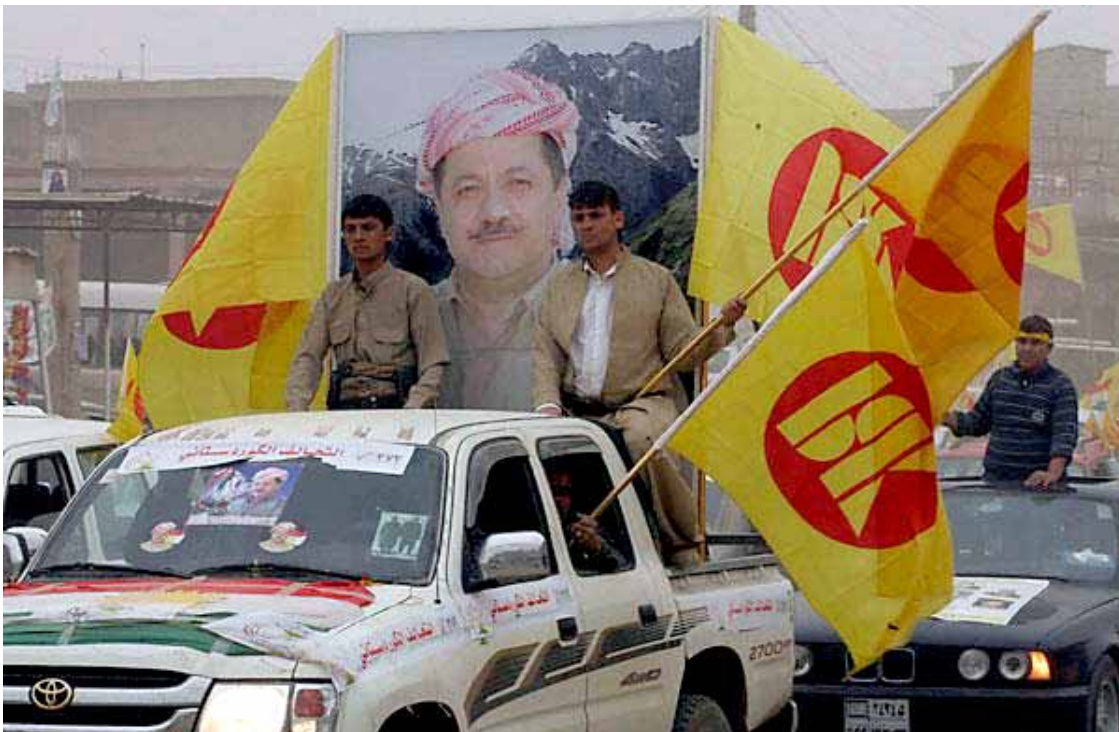
بریارە لە ھەفتەکانی داھاتوودا کۆنگرە بیهستیت

بۆ ئاشتکردنەوهی کادیرە نارازییەکان، مەکتەبی سیاسی پارتی بریاریدا بیانکات بە ئەندامی کۆنگرە