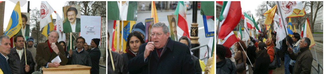
لایه‌نگرانی موجاهیدین له‌ ئەوروپا سه‌رقالی به‌ریوه‌بردنی خۆپشاندان

دەراره‌وه‌ی ئەمریکا کرد پێداچوونەوه به‌سەر یاسای به‌تیرۆریست پێناسه‌کردنی موجاهیدین بکاتوه‌، بەلام تا ئیستاش ئەمریکا ئاماده‌ نییه‌ ناوی موجاهیدین له‌ لیستی تیرۆریستی ئەو ولات‌ه‌دا بسێنێته‌وه‌. موجاهیدین به‌ پشتگیریکردنی "تیرۆریزم" له‌ ناوخۆی عێراقیش تۆمه‌تباره به‌شیک له‌ ئەندامانی رێکخراوی موجاهیدینی خەلقى ئێران به‌ پشتیوانیکردنی حکومەتی بەس و سەرکوتی شیعه‌کان و کورده‌کانی عێراق له‌ رابردوودا تۆمه‌تبارکراون. هاوکات له‌ چەند سالی رابردوودا، نوری مالیکی ناویه‌ناوه‌ پەلاماری که‌مپی ئەشرفی داوه‌ و تەنیا له‌ یه‌ک رووداودا نزیکه‌ی ٥٠٠ کەس برینداربوون و به‌ده‌یان کەسیش کوژران. حکومەتی عێراق داوا ده‌کات ئەندامانی رێکخراوی موجاهیدین ده‌بێ عێراق جێبێنێن و له‌بەرامبەریشدا موجاهیدین مانه‌وه‌ له‌ عێراق و قبولکردنی