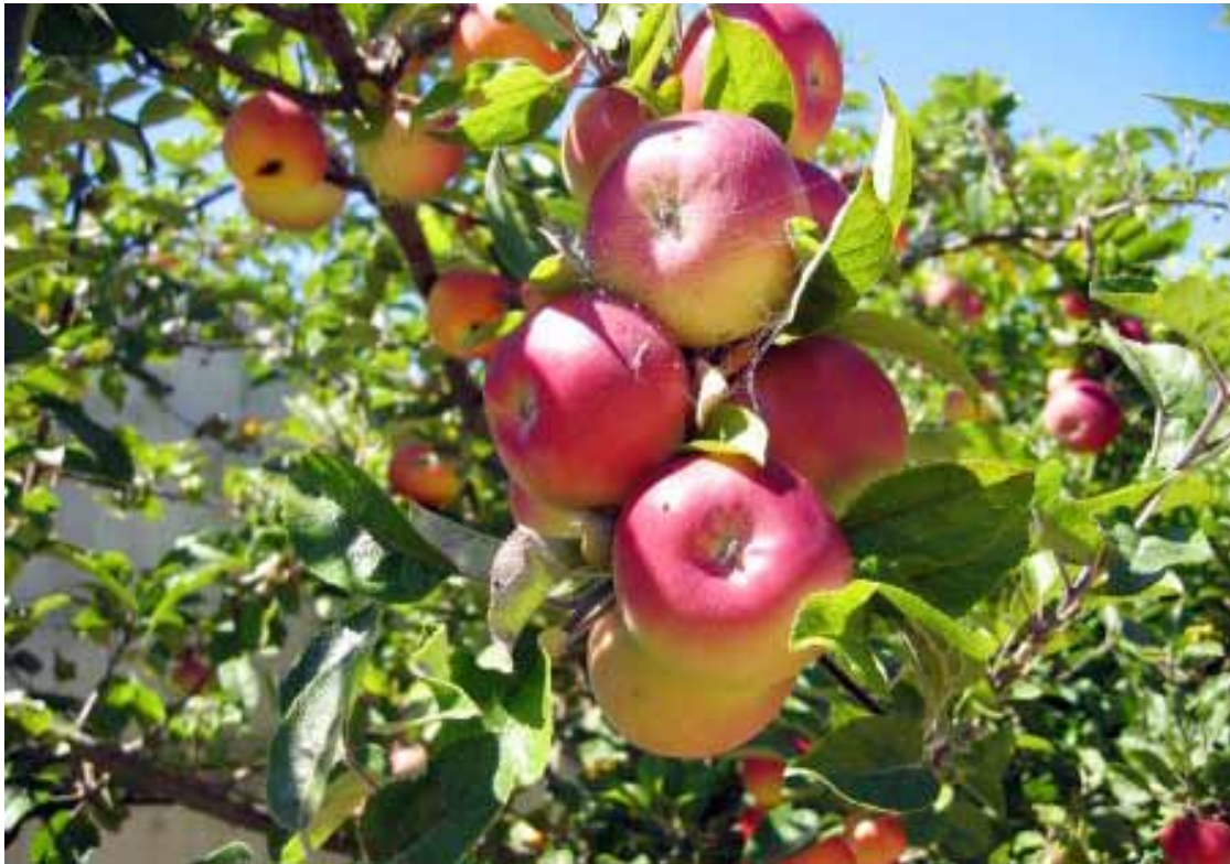
به رهه می سیوی پشدر له سالیگدا شه شی هزار کیلو که میکردوه

هه موو به رهه میکی کشتوکالی له پشدر که مبووه ته وه