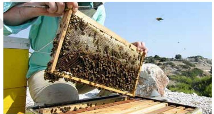
١١ هه زار ههنگ له سنوری پشدر هه یه

هه ره ها روونیکردوه کاتیک میر (مه لیکه) هه نگوین ده بیینی هیلکه ده رده کات و له مانگی چواردا هیلکه یه کی زۆری رشتو شانه کان قه ره بالغ بوون، ئەو به رهه می کۆیان کردبووه خواردیانه وه و شیله یتریان پت کۆنه بووه ، تا له مانگی حه وت هه ندئ شیله یان ده ستکه وت که به شی خاوه نه که شی نه ده کړد . ئەو پتیبویه تا که هۆکار کیشه ی ئاووه هاو بووه ، هه ره نا سووتانی دارستانه کان کاریگری نه بووه له سه ر که مبوونه وه ی به رهه می هه نگوین . لئیرسراوی به شی ههنگ له به رپتوه به ریایه تی کشتوکالی پشدر وتی نزیکه ی ١١ هه زار ههنگ له سنوری پشدر هه یه و سالانه لانیکه م یه که ی شه شی کیلو هه نگوینی هه بووه . وتی «به لام ئەمسال ئەوه ی شه کزری نه داوه تی ئەو به رهه می نه بووه» . مه مه ده مه لانه بی که زیاتر له ٢٠ ساله کاری ههنگه وانی ده کات، ده لئیت ئەمسال هه نگوین زور که میکردوه ، له چاو سالی رابردو، وتی «بۆ نمونه پار که ههنگه وانیک پتینج ته نی هه بوویت ئەمسال ته نیکی نه بووه» . ئەو ههنگه واته وتی «له دۆلی باله یانی بناری قه ندیل، زیاتر له ١٠٠ ههنگه وان هه یه و ئەوانه ی به رهه میان هه بووه له په نجه ی ده ست ده ژمیردین، خۆم که ٧٥٠ ههنگم هه یه ئەمسال نزیکه ی ١٠ تن هه نگوینم هه بووه ، له به رنه وه ی شه کرم پیداون، که شه کرم پینه دابوونایه به رهه مه کم به شی میتشه کانی نه ده کړد» . هه ر میتشیک ئەو ١١ کیلو ههنگی به رهه م هیتاوه ، وتی «هی خه لکی دوو تا سئ کیلو هاتوو ته وه» .