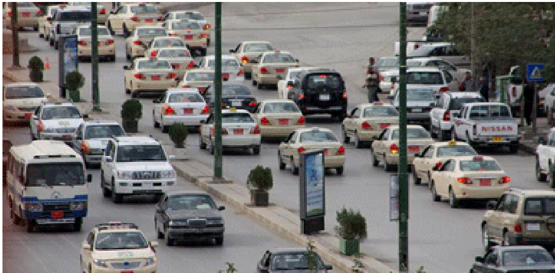
داوا ده کړیت سنووریک بۆ هیئانی نۆتۆمۆبیل دیاریی بکړیت

تنها له ماوهی ۷ سالدا ۴۰۰۰۰ ههزار نۆتۆمۆبیل هاتووه ته ناو شاری ههولیره وه له ۱۱ مانگی سالی ۲۰۱۰ ههژدا ۶۵ ههزار نۆتۆمۆبیل ژماره ی ههولیریان بۆ بهستراوه . شاره زایانی بواری ژینگه ش ده لێن ژینگه له ته قینه و دایه .