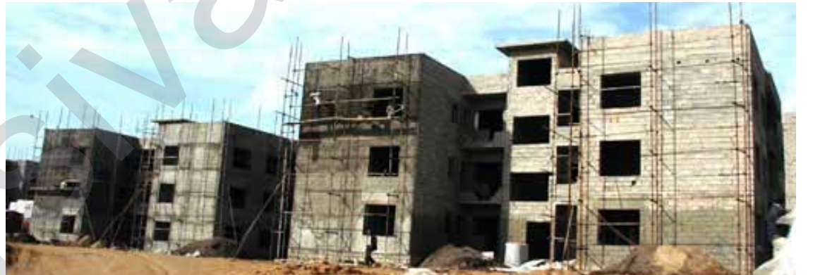
هاو لاتیان داوای قه ره بوو گر دنه وه ده کهن

سکالا له سه ر کۆمپانیایه کی بواری وه به ره یئانی خانووه ره تۆمار ده کړیت