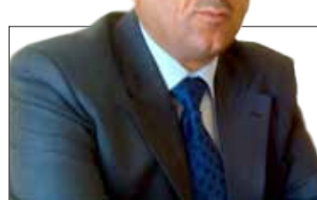
رینماییه کان ده لئی هه ر ماموستایه ک سی سالی خزمه تی ته او کردییت، مافی نه وهی هیه داوا ی گواسته وه بکات، به لوم گواسته وهی مهرج نییه، چونکه

فاخیر حسن ئیسماعیل: هست ده که م نا تیگه یشته که هیه له نیوان ماموستا سه ربه رشتیاران، چونکه پیشتر به سه ربه رشتیار له دوی که موکوری و خالی لاوازی ماموستا ده گه را بو نه وهی بتوانیت لی پیچینه وهی له گه لدا بکات، به لوم نه مرؤ سه ربه رشتیار به دوی خالی لاوازا ناگه ری، به لکو به دوی نه ودا ده گه ری که له پووی زانست و په روه رده ییه وه