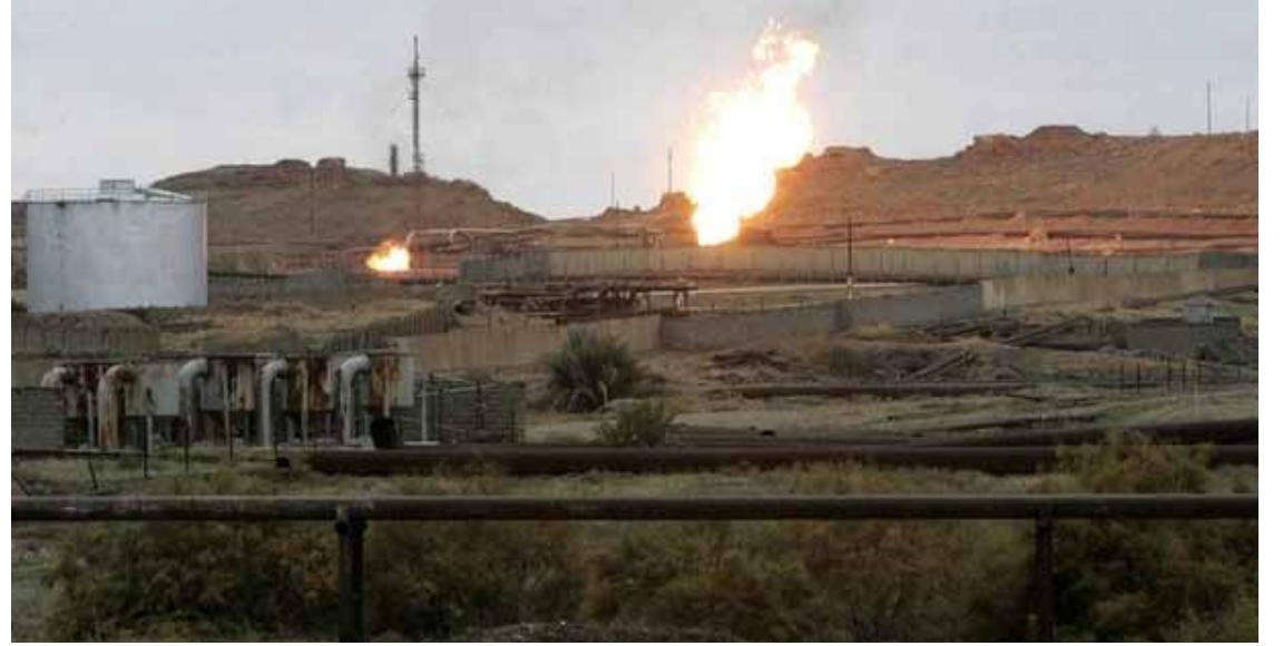
تائیسنا هیچ پالۆگە بهکی نەوت لە ناوچه کوردییەکان نییە

فراکسیۆنی عەرەبی لە ئەنجومەنی پارێزگای کەرکووک سەرکه وتوو نەبوون لە گۆرینی شوینی پالۆگەیهکی نەوت لە ناوچه کوردنشینەکانی پارێزگاکه وه