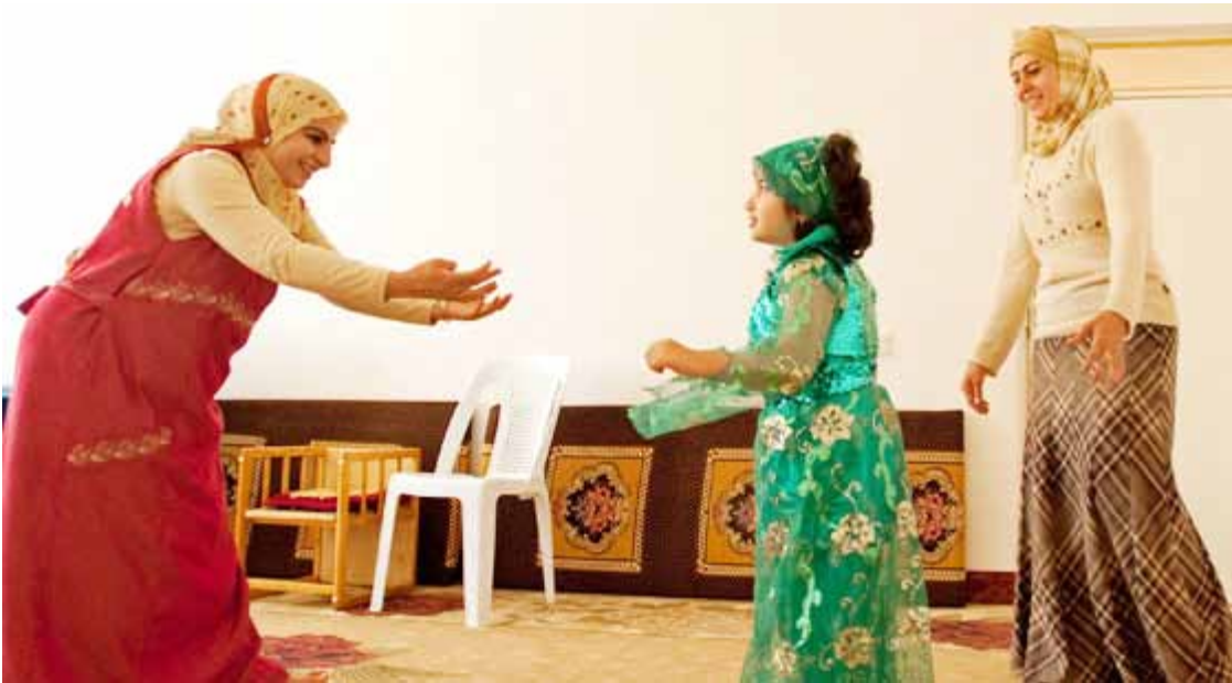
مامۆستاىان کەرکوک فەشارەکانیان راگرت

بەپێرە لە ٦/١ هەو زیادەى موچە بۆ مامۆستاىان سەرفەبکریت و لەمەوداوش پلەکانیان بۆ ئەژماربکریت