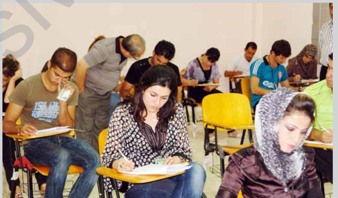
ئەگەر حکومت ئەو پارەیه نەدات، ناچارین لەخویندکارانى وەرگیرین

نزیکی ٣٠ ملیۆن دینار لەخویندکارانى پۆلى ١٢ وەردەگىرت