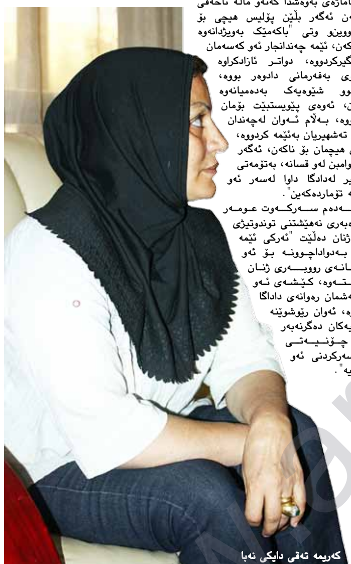
کەریمە تەقی دایکی ئەبە

بەهەرسێکیان ئێیاندا، ئازاریکی زۆریاندا بۆ ئەوێ منداڵەکەم لەباربەن، لەباریشیان برد