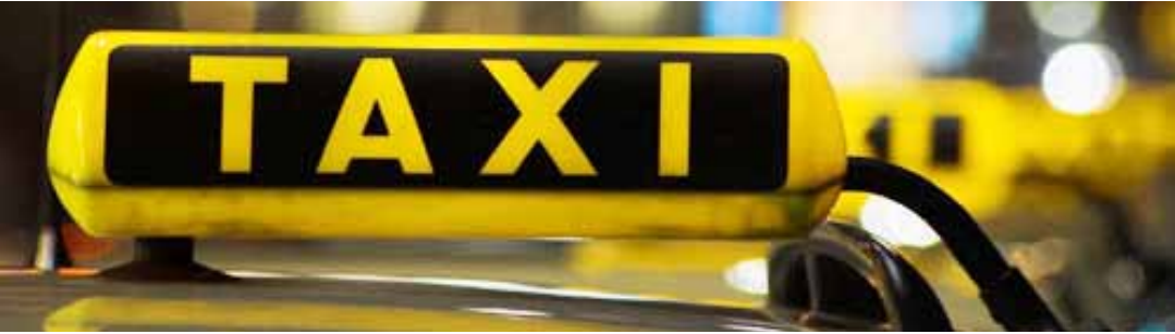
ته نیا له سنووری سلیمانی نزیکه یی ۱۱ هزار ته کسی تومارکراوه

دوباره کردنه وې وتی شوفیری ته کسی، ” مولاژم نه قییش ته کسیان پییه ” له لای شوفیری کتر خه ریکبوو تووشی کیشم بکات، چونکه نه ویش نه فسه ری پله په کی بوو و نیشی ته کسیش ده کات. نه و قسه په بیزاریکرد. شوفیرکه به گریزه ووه وتی: بو ناییت؟ هه روه ها وتی ” مانگانه ۴۵۰ هه زارم هه یه، جاری واش هه یه به دوو تا سن مانگ جاریک موچه وهرده گرین، نه یی نه گه ر شوفیری نه که یی، خو سوال ناکه یی! ”. نه و له په کی که له فه رمانده یی کانی پارتي نه فسه ری پله په کی که زورترین خه لک به مولاژم ناوی ده یی. نه و فه رمانده یی درهنگ درهنگ موچه به پیشمه رگه کانی ده دات، هه ندیک جار ده گاته سن مانگ، بوئه نه و نه فسه ره وتی ” نیه ش ناچارینو تنیا ده تانین نیشی ته کسی بکینو هیچ نیشی ترمان پیناکریت. ” به پیی ناماریکی سهدیکای گراسته ووه تا ۲۰۱۰/۱/۱، ۱۰۲۹۵، ته کسی تنیا له ناو شاری سلیماندا تومارکرون، رژ دوی رژیوش ریژه یی ته کسی زیاتر ده بیته و شقه ماکان قه ربالغ ده که ن. شقام جمه یی دیت له هاژوه ژو هوینی