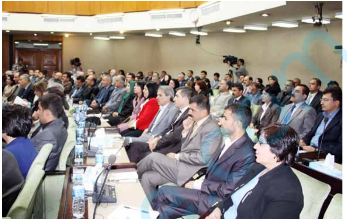
پەرلەمانتاریک: مەلچۆرەکان دامراوەتەرە، لەهەولا سەرقالی پڕۆژەکان دەبین

لە دەستیگیردەوهی خولی نوێی پەرلەماندا شەر لەهۆلی پەرلەمانەوه بۆ بەرۆکی حکومەت دەگوازییەوه