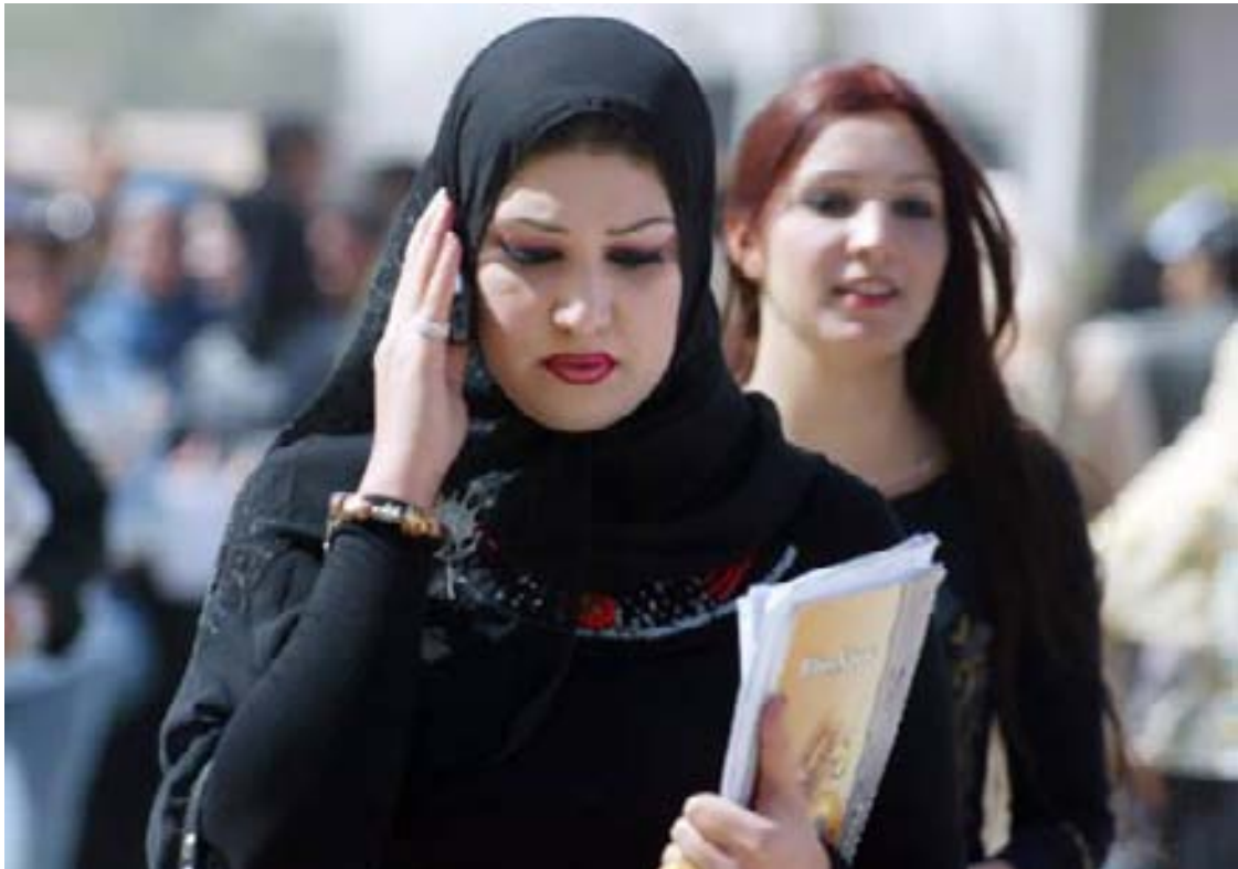
له پهمه زاندا له چکده کهن و دوی پهمه زان قز بهرده دهنه وه

به هوی مانگی رهمه زانه وه، کچان به لپشاو روو له فرۆشگانگی تایبته به فرۆشتنی له چکو حجاب ده کهن