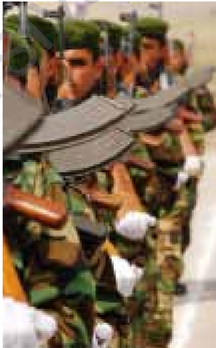
یەکیتی و پارتی دەستبەرداری پششەرگە نابن

بەپێی یاسای حیزبەکان، ناییت هیچ حیزبێک لەکوردستاندا هیزی چەکداری هەبیت بوونی هیزی چەکدار قەدەغەکراوه، بەلام تائێستا حیزبەکان بەتایبەت پارتی و یەکیتی، هیزی چەکدار لەژێر رکیفی خۆیاندا یە. بەپێی ئەو خەمەلانەوانەیی وەزارەتی پششەرگە کردووەتی نزیکەیی ۱۹۰ هەزار پششەرگە لەکوردستاندا هەیه، بەلام لەهەولەکانی وەزارەتی پششەرگە و حکومەتی هەرێم تائێستا جوار لیوا یەکیانگرتووتەوه و پڕیارە تەواوی هیزی پششەرگە لەهیزیکی یەگرتووی نیظامی ۱۸ لیوایدا بەبەگرتنەوه.