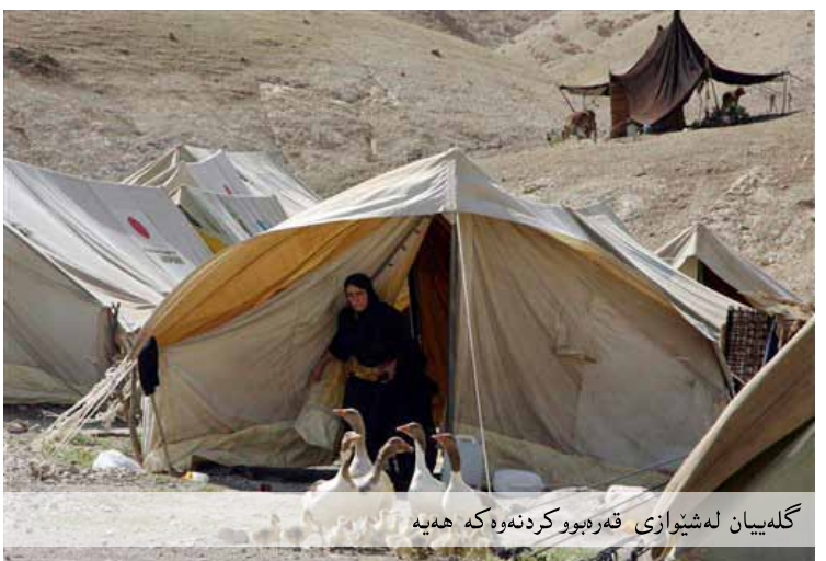
گەلییان لەشێوازی قەربووکردنەو کە ھەبە