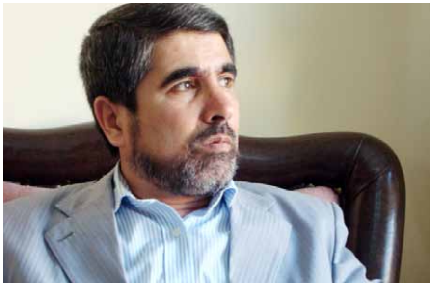
سەرۆكى فراكسيونى كۆمەل لەپەرلەمانى كوردستان