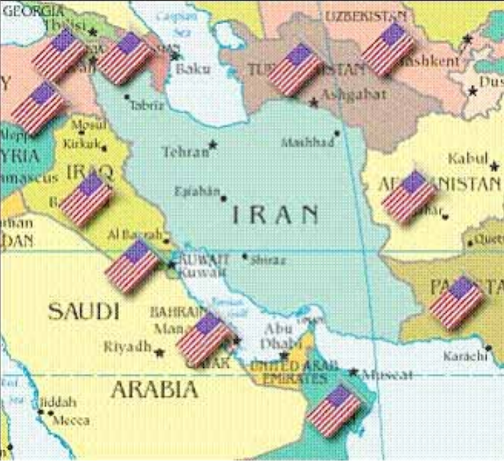
ھىشتا ئەگەرى دووبارەنومۇرى سىنايىزى عىراق بەدور نازانرېت

ترسو دلەراڭىيەكى زۆر لەلايان دروستكردوو. ھاوكات چەندىن ھەولتېرى باسيان لەوكردوو كەزۇرېبەى كاتەكان سوپاى پاسدارانو سەرچەمى ھېزە چەكدارەكانى دېكە لەنامادەباشى تەوادانو فەزاىيەكى تەواو جەنگى بالى بەسەر ئەم شاردە كىشاو.