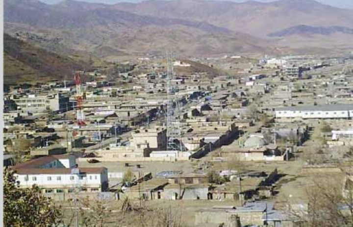
هاوولاتیان گومانده که روخانی خانوه کانیان بؤ باخچه بیت

عه بدوللا ره تیکردوه که عیما د نه حمده جیگری نه وکاتی سهرۆکی حکومت بریاری قهره بوو کړدنه ویه پیدایان، وتی ”لایه نی په یوه نديدارمان ناگادارکړدوونه ته ووه که قهره بوویان بکاته ویه، به لام تانیستا هیچ بریاریکی قهره بوو کړدنه ویه مان پینه که بشتوه“