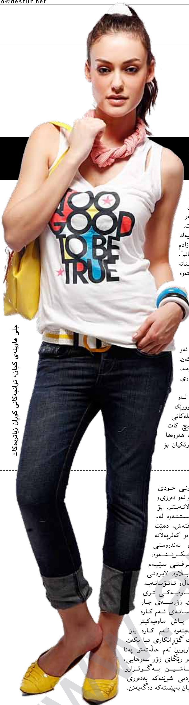
جلى ھاوینەى كچان، توانجەكانى كوران زياترەكات

بەھۆى بەرزبونەھۆى پەلى گەرماو، كچان جلى فېنك ھەلدەبژېرن، بەلام رووبەرۆوى توانجى كوران دەبنەو