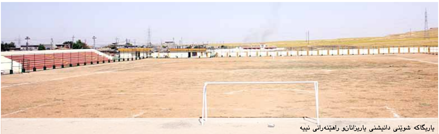
یاریگاکه شوینی دانیشنی یاریزانانو راهینه رانی نیبه

به کر نامیق لیبرسروی تۆپی پی یانه ی ته کیه، وتی «له نۆژه نکرده وهی دووه صدا به لیتی فرترکردنی یاریگاکه مان درا، به لام نۆژه نکرده وهی سییه م جاریش تهواوده یته هیشتا فرتر نه کراوه.»