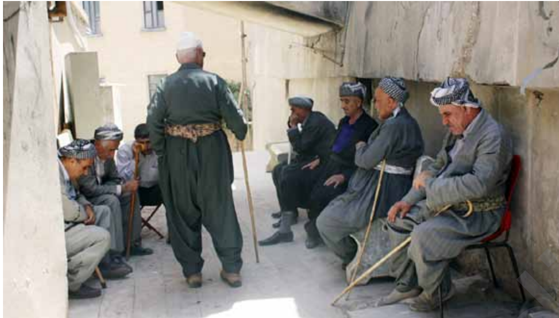
«دوو ژووری گەنجاومان دەلیت»