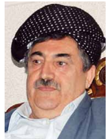
زریان جوهه ر

مه مده دی حاجی مه حمود: واز له سکرتریی حیزبه که م ده هیئم