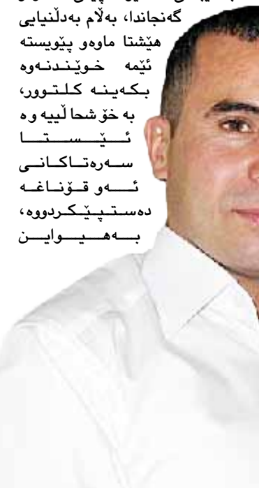
هێشتا ماوه پێویستە ئێمە خویندەوه بەکەینه کلتور، بەخۆشالییەوه ئێستا سەرەتاکانی ئەو قۆناغە دەستپێکردووه، بەهیواین

هەندیک لەنووسەرانی کۆپی کتێبەکانمان پێنادهن، دەلێن ئەوه چۆرێکە لەسانسۆر