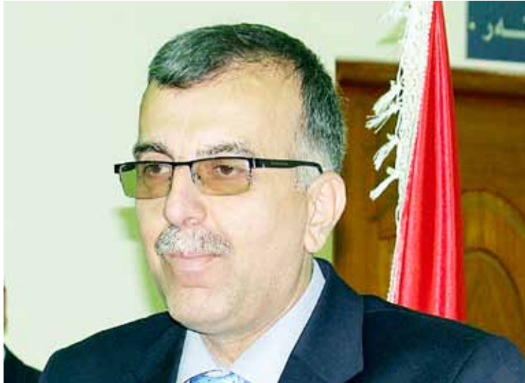
ئیشوکارەکانی من لەسەر بنەمای جیاکردنەوی حیزبو کاری وەزیفەییە