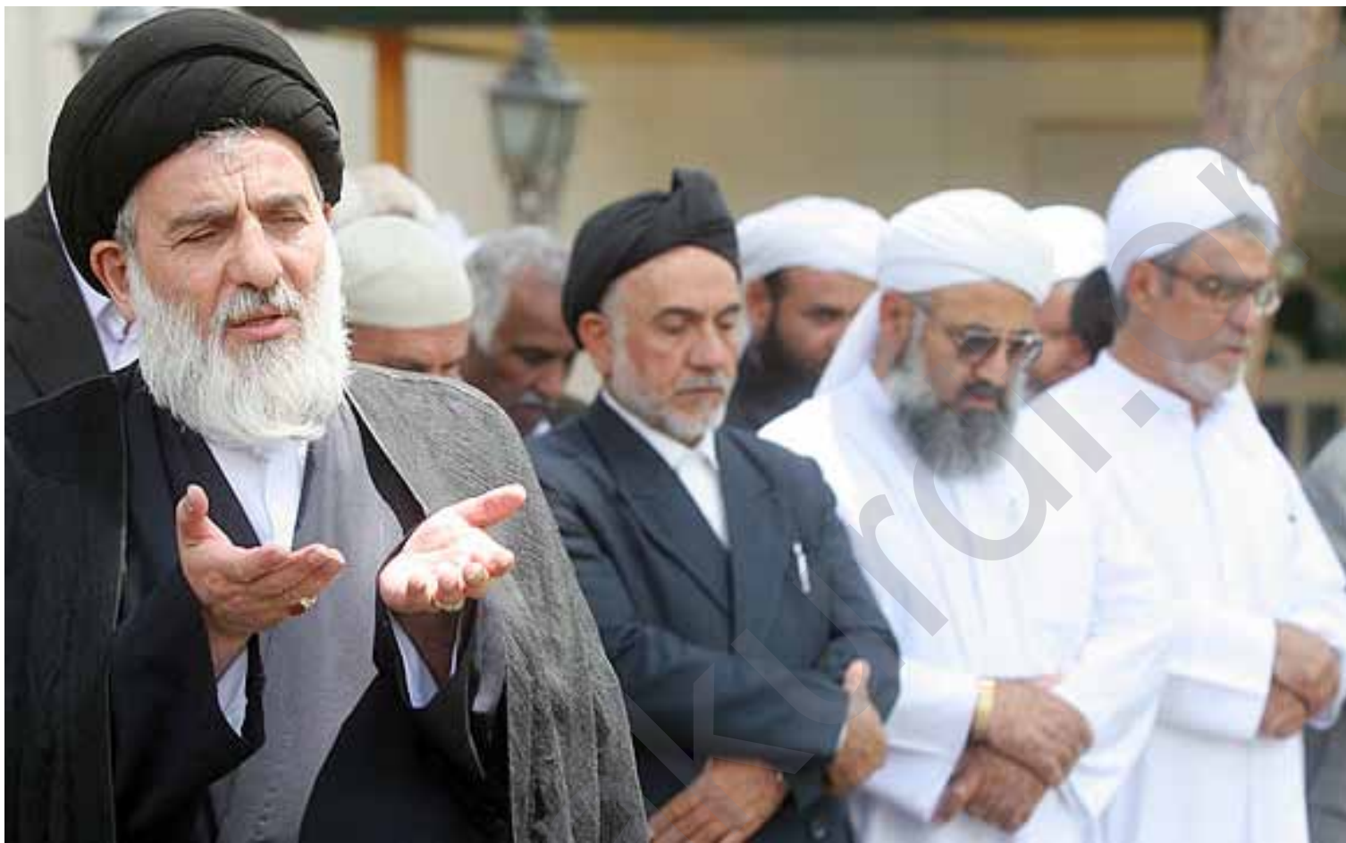
شه پؤلی نوی به ره بست و فشار بۆ سه ر سوننه کان له ئیراندا ده ستیپکړد

چهنیدن کهنالی راکه یانندن له سالی کانی رابردو، له سه زژمیریکی نهینی له ئیران ئاشکرایانکرده که هه لاوردنه له راده به دهره ئایینی و مه زه بی به کان له ئیراندا، زورینی خه لکی ئه و ولاته هیناو ته سه ر ئه و بریایه که بۆ زنگاربون له م بارودوخه، پیویسته له ئیرانی داها تودا بۆ هه مییشه مالتاوا بی له ده سه لاتی ئایدولژیکی له هه موو نه وعه کانی بکړی. له ناو خودی که سایه تیبه مه زه بی به کانی شه به ناوی پرؤتستانیزی ئیسلامی به ره مه اتوه، ئه وان باس له وه ده کن که بۆ گپانه وهی حورمه تو ریز بۆ مه زه بی و ئایینی کان، پیویسته مه زه بی ده ستبه ردای ده سه لاتاری بؤ و مه زه بی حکومت له یه کتر جیا بکړنه وه. مامؤستا شیخ عیزه دینی حوسینی پیویاهه گره نتی کړدن مافه ئایینی و مه زه بی به کان ته نیا له حکومتی کی دیموکرات و سیکولاردا ده سه به رده بی، ده لټ "له دنیا ی ئه م رپودا ته نیا به جیابونه وهی دین و ده ولت مافه سه رجه می ئیمانداران ده پاریزی، دیاره دین له چټگی خویدا حورمه تو ریزی هه بی و ئه م ته رناتیغه شه، واته جیای دین و ده ولت، ده توائی ئه م ریزه بۆ ئایینی ده سه به ر بکا. حکومت ده بی حکومتی هه موو پیکاته ئایینی و نه ته وهی و بیروپرو جیا جیا کانی کومه لگا بی، ئه م به رپرسیاریه تیبه حکومتش ته نیا به جیایی مه زه بی له ده ولت جیبه جیده بی.