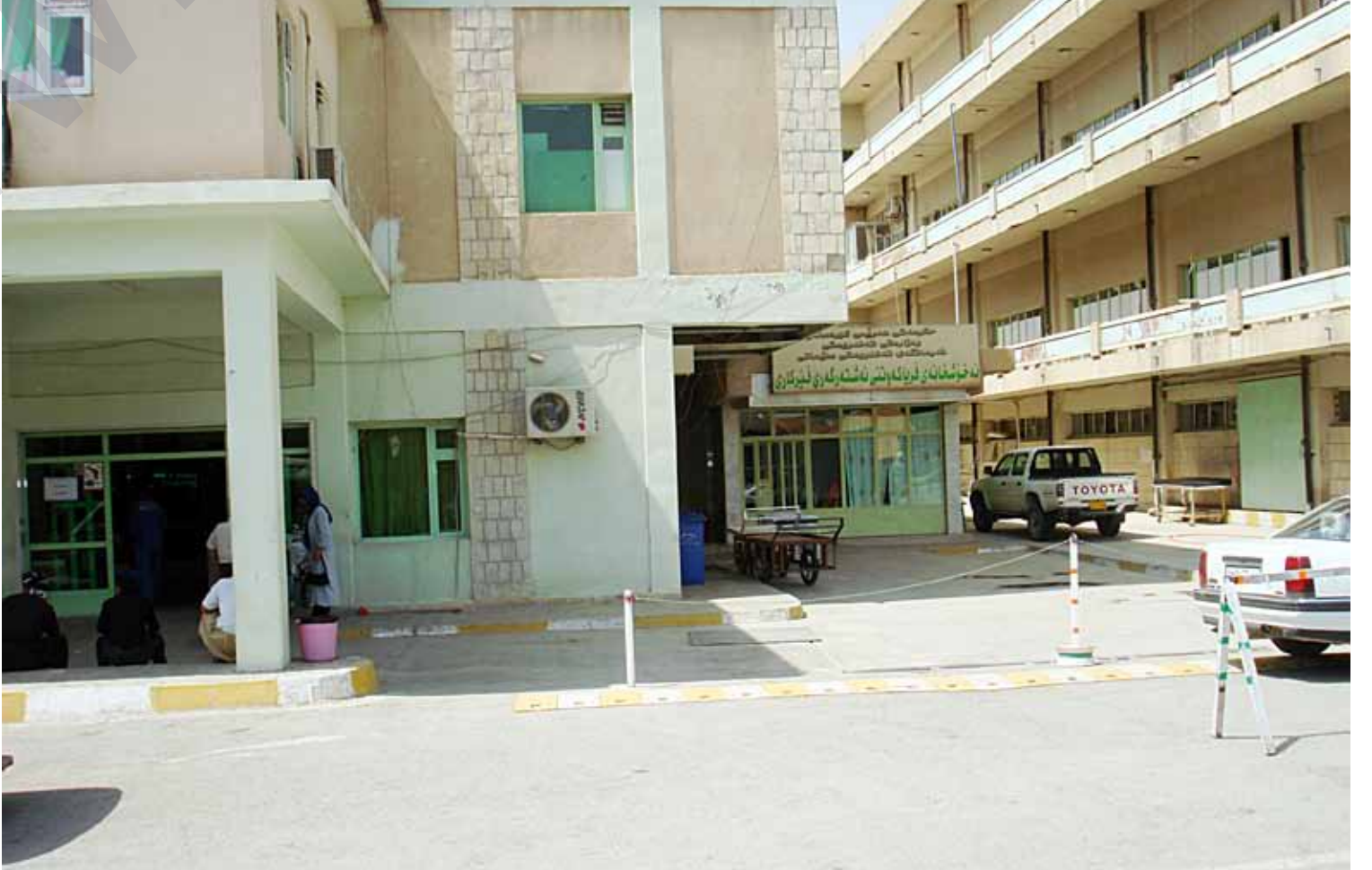
«وسلیمانی پشکی گهرمیان دهبات لهپزشکی سپۆرو دهرماندا»

بههۆی نهبوونی پزشکی سپۆری زۆریه نهخۆشیهکانو کهمی دهرمانهوه، ههلمهتیکى ئیمزاکۆکردنهوه دهستیپیکردوووه، بهو هیوايهی حکومهت کيشهکانی تهندروستی لهناوچهکه چارهسهربکات. کۆمهلهی پهيامی خهلك لهگهرمیان ههلمهتی ئیمزاکۆکردنهوهکه بهپێوهدهبات لهشارهکانی کهلار، کفری، چهمچهمال، خانهقین، دهربهندیخان، پیبازو رزگاری. بهنیاژن ٢ ههزار ئیمزاکۆیکهنهوه لهناو ٥٠٠