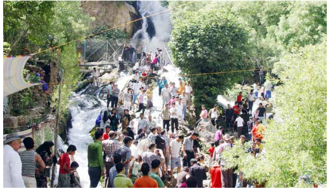
محمه د نه جیب

هه فته ی را بریدو سه یرانگا کانیه هه رییم