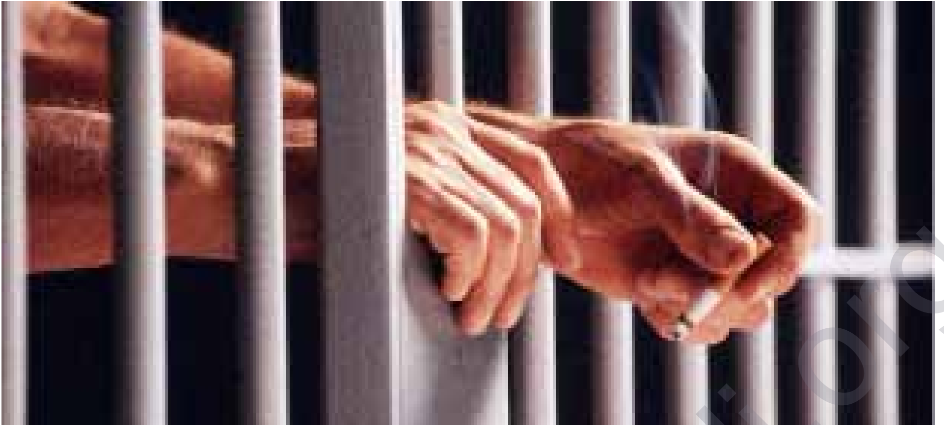
گوماندەکریت سەدان کەس بەبێ بەلگە بکریته زیندانی سیاسی