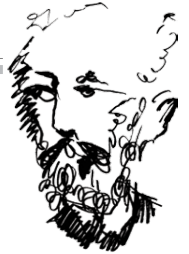
مێھدی عاتق راد وەرگێڕانی لە فارسییەوە: سارا محەمەد