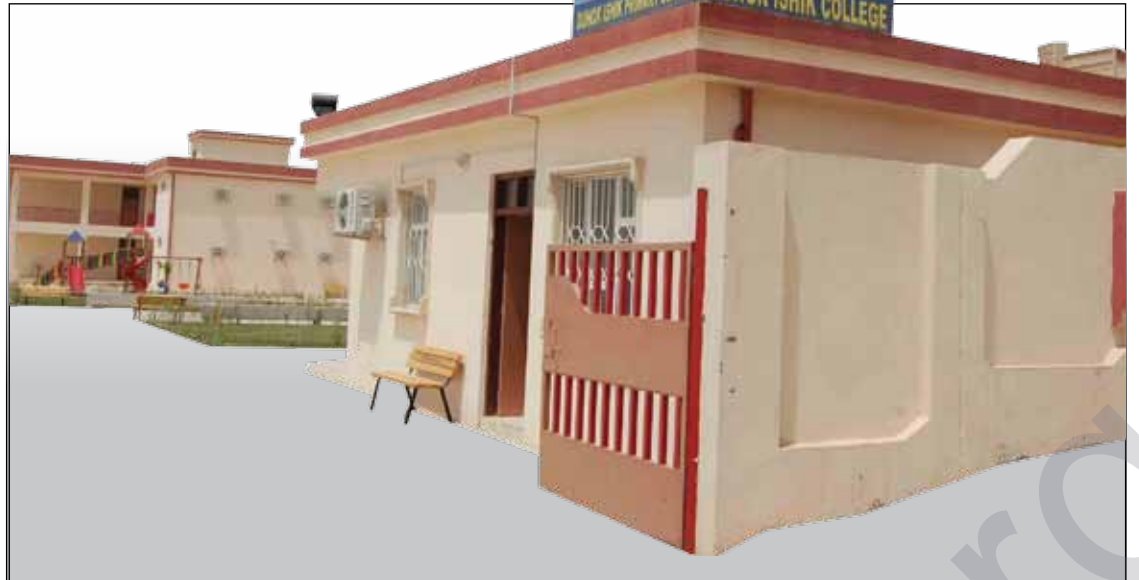
قوتابخانە ئاساییەکان نیگەرانی لەقوتابخانە ئەهلەکان. فۆتوگراف: شەنگ هاشم

پیازئ لەهەمان کتیبیدا ئامازە بۆ ئەوه دەکات لەپێناری ئەوهی لەسەرەتاکانی زێرەکی وردبیتتەوه گەرپاوتەوه بۆ دیراسەکردنی پەرچەکرداری مندالان لەبەرەمبەر ئەو شتەکانی لەدوا ی لەدایکبوونیانەوه دیتت بەرچاویان. بۆیە لەنووسینەکانی خۆیداو بەتایبەت لەکتیبی (دەرۆنناسی زێرەکی)دا کە باسی قوناغەکانی زێرەکی دەکات، قوناغی هەست - جولەش (لەکاتی لەدایکبوونەوه تا تەمەنی ٢ سالان) بەقوناغیکە زۆر گرنگ وەسف دەکات.