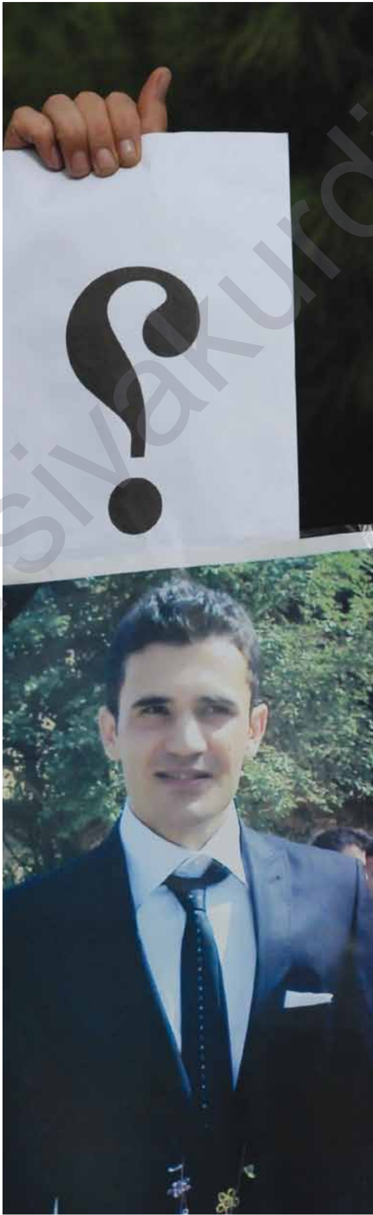
ئێزادەوێ: شەری ناوچۆ

ئێستا کاتی ئەوێ گومان و پرسیار بەرانبەر بەخەمساردی و سستی دەسلەتدارانی هەولێر بکەن لەمە تیرۆرکردنی سەردەشت عوسمان. ئێستا ساتەوختی لێرسینەوێ لەو حیزب دەسلەتەو، کە لەسایەیدا، رۆژنامەنووسێک دەرفێنیت و تیرۆردەکرت، بەلام قەبوولی ناکات، پرسیری ئاراستە بکرت. ئێستا دەرفەتە وەک شاھیدیک، چیرۆکی تیرۆرکردنی سەردەشت عوسمان بگێرینەو گومان لەهەموو ئەو درۆیانە بکەن، بەناوی راستییەو پێشاندەدرین. چلەو سەردەشت عوسمان کەبیاروایە لەناو پاستی ئەم مانگەدا ئەنجامدريت، هەلیکە بۆئەوێ بەلێن بدەن کەسەردەشت عوسمان لەبیرناکەن.