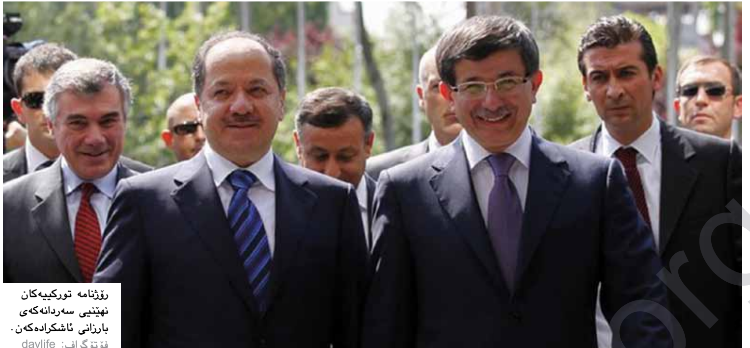
رۆژنامه تورکییه کانی نهینتی سهردانه کی بارزانی ئاشکرا ده کهن.

سهردانه کی مه سعود بارزانی سه رۆکی هه ریمی کوردستان بۆ تورکیا، له لایه نه چند رۆژنامه و کانی لکی راگه یاند وه هیرشیکرایه سه ر، به تایبته کاتی: له کۆنگره رۆژنامه وانیه کاند بینرا له پشتی بارزانییه وه ئالای کوردستان و عیراق دانه تراوه.