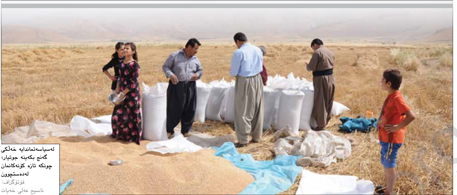
لەسیاسەتەماندايە خەلكى گەنج بەكىنە جوتیار، چونكە تازە كۆنەكانمان لەدەستچوون