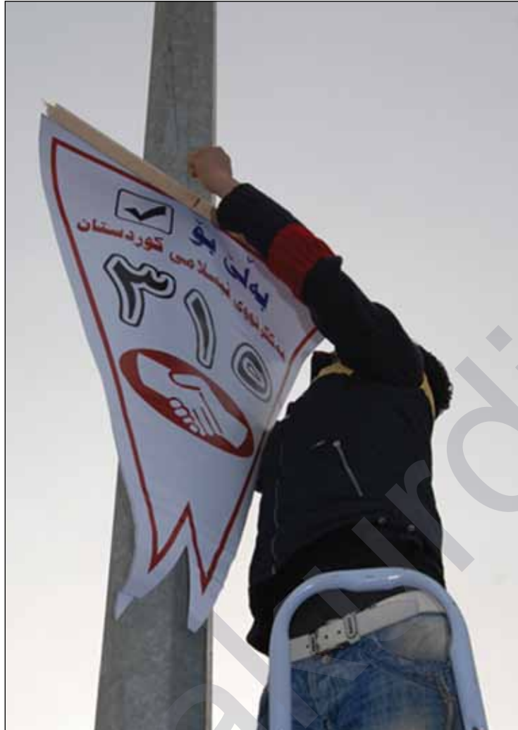
*گۆران خۇيان بەكامل نايىن *يەكگرتوو خۆى بەئۆپوزىسيونى رەسەن پىناسە دەكات *كۆمەل دەيوئەت بەباش بلىت باشو بەخراب بلىت خراب

ئاماژە بەو شەدەكات كە ئۆپوزىسيون لەچۆنىيەتى ھەلسان بەرۆلى خۆى بەرامبەر بەدەسەلاتو كۆمەلگا، بەرەو روى زۆر ئاستەنگو گرفت بوو تەوھ. راپورتەكە ئاماژە بەو دەكات كە كاركرىن لەچوارچىوئەى بازەى سياسى ھەرىمى كوردستاندا، بۇ ئۆپوزىسيون ھاوكاتە لەگەل كەم ئەزمونىو باوهرەخۆنەبوونو بەدگومانى بەرامبەر بەدەسەلات لەلايەكو چۆنىيەتى مانەوھو پارىژگاركرىن لەپىنگەى سياسىو جەماوهرى خۆى لەلايەكى ترەوھ. ھاتووھ «ئەمەش جار لەدواى جار ئەركى سەرشانى ئەم ئۆپوزىسيونە قورستر دەكاتو ھەندىك جاريش چاوەروانى زۆرى جەماوهرەكەى