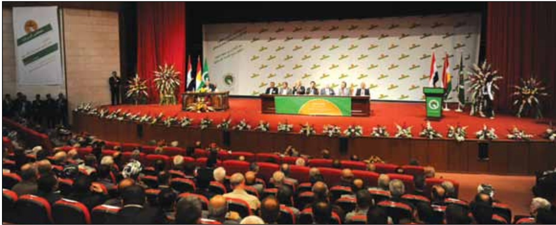
رۆژی پینجشممه کۆنگره کۆتایی به‌کاره‌کانی دیت.

کۆنگره‌ی سییه‌می یه‌کیتی نیشتمانی کوردستان هه‌نگاو به‌ره‌و رۆژه‌کانی کۆتایی ده‌نیت، به‌لام چه‌ند بۆچوونیککی جیاواز کیشه‌ی له‌نیو با‌له‌کانی نیو کۆنگره‌ دوس‌تکردوه‌، بۆچوونیککی ده‌سته‌جهمعی بۆ هه‌یشتنه‌وه‌ی ژماره‌یه‌ک ئەندام مه‌کته‌بی سیاسی له‌ئارادایه‌و بۆچوونیککیش به‌توندی دژی ئەوه ده‌وه‌ستنه‌وه.