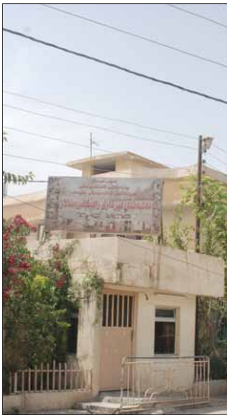
لەدای ئەو سالاوە کەپێکخواری ئەکۆرن دەستبەردارمان بوون، نەمانتوانی وەک پێشتر خزمەتگوزاری پێشکەش بەمندالەکان بکەین

کیشو گەرفتەکانی مەلەبەندی راھێتانی مندالانی سلیمانی خزمەتگوزارییەکانی ئەو مەلەبەندی بەرەو کەمبۆنەو بەرەو