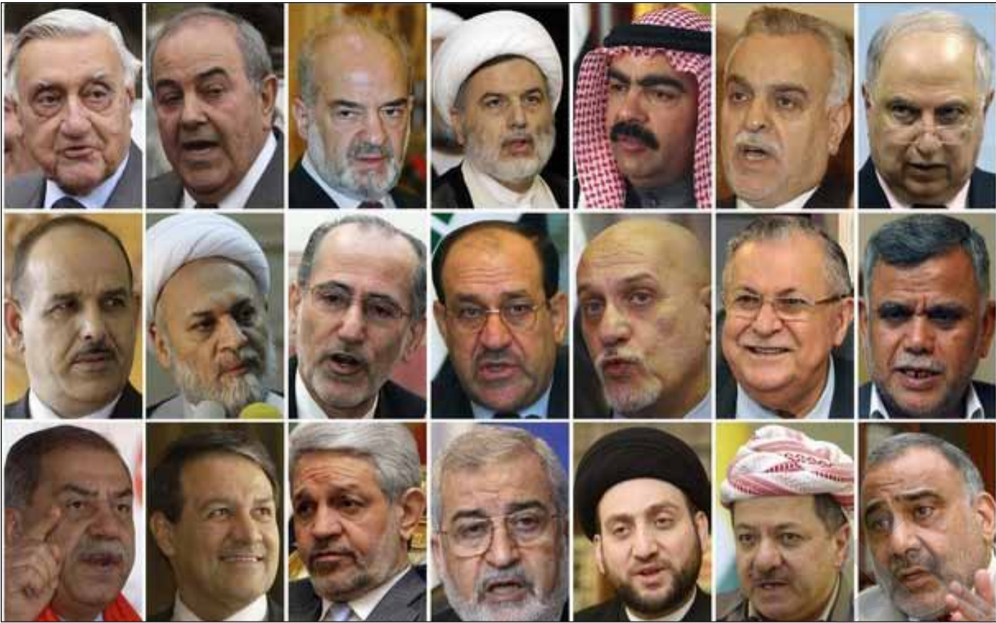
کێ رکا بهری موقتهدا سهری پێدهکریت؟

چهند كه سێكیان كوشت كه خۆپیشاندانیان دهكردو ناپهزایی خۆیان دهردهبهری بهرامبهر داخستنی ههزوه و تانك نێردرايه سهر ئهوانهیان كه مانیان گرتبوو. سهر هانی لایهنگرهكانی دا هیزهكانی داگیركهر بترسینن دواى ئهوهی رایگهیاندا: ناپهزایی ئاشتیانه چیتر بهكلك نایهت. دواتر پێكدادانی سهریازی لهنیوان هیزهكانی ئهمریکای سوپای مههدی روویدا كه خودی موقتهدا سهرکردایهتی دهکردن، رۆژی ١٤ ئایاری ٢٠٠٤ سهرهتای جهنگێکی خۆیناوی بوو لهنیوان هیزهكانی ئهمریکای سوپای مههدی لهشاری نهجهف و بهدروستی لهگۆرستانی نهجهف کاتیگ هیزهكانی ئهمریکا ههولیاندا سهر دهستگیریکهن، ههروهک ئه هیزانه ریگای نیوان کوفه و نهجهفیان گرت، بۆئهووی نههیلن سهر بجیت بۆ مزگهوتی کوفه که له کاتانهدا ئیمامهتی نوێژی ههینی بۆ لایهنگرهکانی دهکرد، بهلام توانی بگاته کوفه و وتاری ههینی خۆیندهوه و کفنێکی سپی خستهسهرشانی وهک چۆن