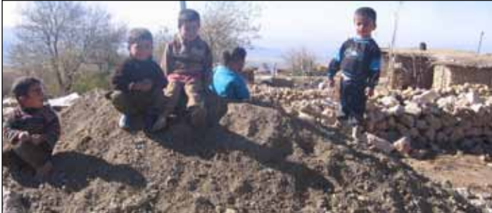
گوندنهکانی بناری سوورین، گوندنشینی بههۆی نهبوونی خزمهتگوزاری، گوندهکانیان جیدههیلن.

تهنها نهفهریک ۲ هزار دینار دهسپینم، ئهوهش زۆره بۆ ئهوان. ئومید ئاماژه بۆ ئهوه دهکات کهچهندیجار بهلێتی دروستکردنی جادهو پڕۆژهی خزمهتگوزاری تریان پیداون، بهلام تانیستا هیچ دیارنیهو دانیشتوانی سنورهکesh پیتا پیتا گوندهکانیان جیدههیلن. بهپێی ئاماریکی نافهرمی کهدهست دهستور کهوتوه گوندی نهوێ بناری سوورین له ۲۰۰ خیزانهوه بووهته ۶۰ خیزان، گوندی بهردهبهل پشتر زیاتریهوه له ۸۰ خیزان، بهلام ئیستا کهمتر له ۴۰ خیزانی تیدایه، گوندی قهلبهزهش پشتر نزیکه ۶۰ خیزانی تیدابوه، ئیستا کهمتر له ۲۰ خیزانی لێ نیشتهجیه، گوندی وهلهسمت پشتر زیاد له ۷۰ خیزانی لیبوه، بهلام لهئیستادا کهمتر له ۲۰ خیزانی تیدا ماوه. کیشهیهکی تری ئهوه گوندانه ئهوهیه کهههندیکیان لهپرووی یاساییهوه سههر بناحیهی خورمان، بهلام کۆبونی تهنها نهفهریک ۲ هزار دینار دهسپینم، ئهوهش زۆره بۆ ئهوان. ئومید ئاماژه بۆ ئهوه دهکات کهچهندیجار بهلێتی دروستکردنی جادهو پڕۆژهی خزمهتگوزاری تریان پیداون، بهلام تانیستا هیچ دیارنیهو دانیشتوانی سنورهکesh پیتا پیتا گوندهکانیان جیدههیلن. بهپێی ئاماریکی نافهرمی کهدهست دهستور کهوتوه گوندی نهوێ بناری سوورین له ۲۰۰ خیزانهوه بووهته ۶۰ خیزان، گوندی بهردهبهل پشتر زیاتریهوه له ۸۰ خیزان، بهلام ئیستا کهمتر له ۴۰ خیزانی تیدایه، گوندی قهلبهزهش پشتر نزیکه ۶۰ خیزانی تیدابوه، ئیستا کهمتر له ۲۰ خیزانی لێ نیشتهجیه، گوندی وهلهسمت پشتر زیاد له ۷۰ خیزانی لیبوه، بهلام لهئیستادا کهمتر له ۲۰ خیزانی تیدا ماوه. کیشهیهکی تری ئهوه گوندانه ئهوهیه کهههندیکیان لهپرووی یاساییهوه سههر بناحیهی خورمان، بهلام کۆبونی