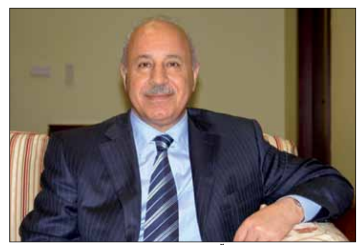
له مه ودا خۆپیشاندان به ین مۆله ت نا کړیت