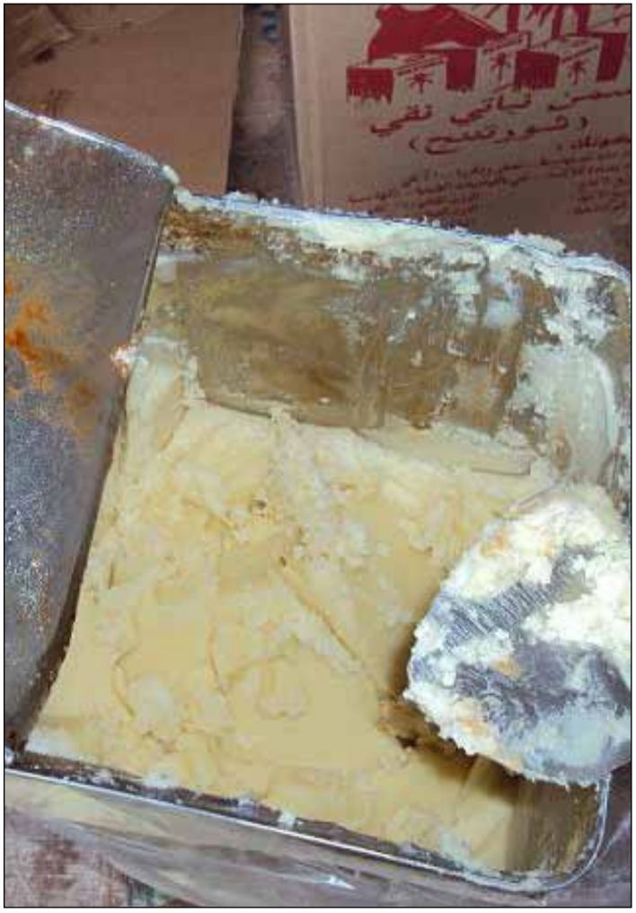
چاودیری تهندروستی کهمترخهه لهپشکنینی بهشهخۆراکی مانگانهدا.