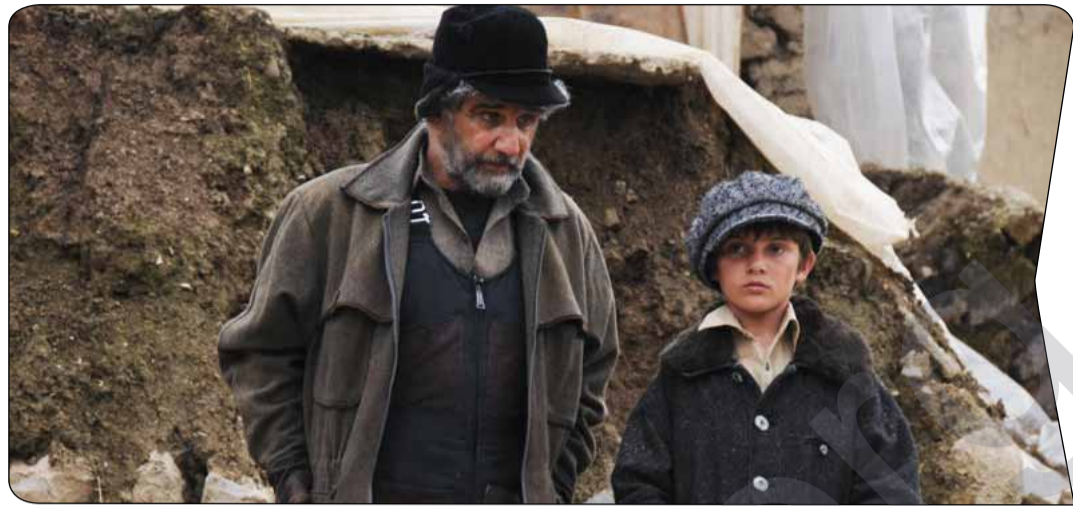
ژنرال له هاولير

رؤشنیروی لوانی حکومتی هریمی کوردستان و هزاره‌تسی ئیرشادی ئیسلامی کۆماری ئیسلامی ئیران، ئیستا له قوناعی وینه‌گرتندایه، بپارویه بۆ ده‌ستپێکی مانگی ئایاری داهاتوو کۆتایی به‌کاری وینه‌گرتنی بیته.