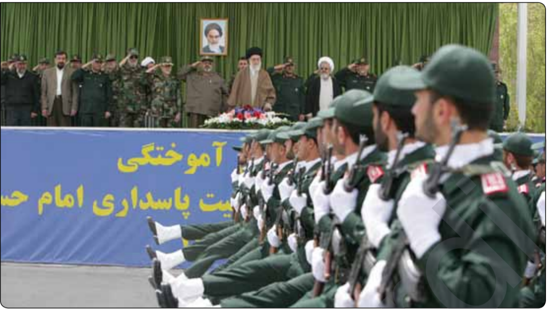
له‌گه‌ڵ هه‌لگیرسانی شه‌ری ئێران و عێراق له‌سالی ۱۹۸۰ دا، سوپای پاسداران به‌شێوه‌ی پارێزانی به‌فه‌رمانه‌ی "موسه‌فای چه‌مران" و هاوشانی ئه‌رته‌شی ئێران به‌شیکه‌ی به‌رچاو له‌چالاکیه‌کانی بۆ به‌ره‌کانی جه‌نگ گواسته‌وه.

پێشینه‌وه‌ی له‌راگه‌یاندنی فه‌رمی سوپای پاسداران و له‌روژه‌کانی سه‌ره‌تای بده‌سه‌لاته‌گه‌یشتنی کۆماری ئیسلامی، ده‌وله‌تی کاتی ئێران که‌وته هه‌ول‌دان بۆ پیکه‌تانی هیزیکه‌ی چه‌کدار به‌ناوی (گاردی میلی) بۆ ئه‌م مه‌به‌سته "حه‌سه‌نی لاهوتی" بریاریکه‌ی له‌ئایه‌تۆللا خومه‌ینی وه‌رگرت، به‌پێشینه‌ی "موحه‌دی ته‌وسولی" ناوی سوپای پاسداران هه‌لبژێردرا به‌فه‌رمانی خومه‌ینی چاودێریکردنی ئه‌م هیزه‌ چه‌کداره‌ راده‌ستی ده‌وله‌تی