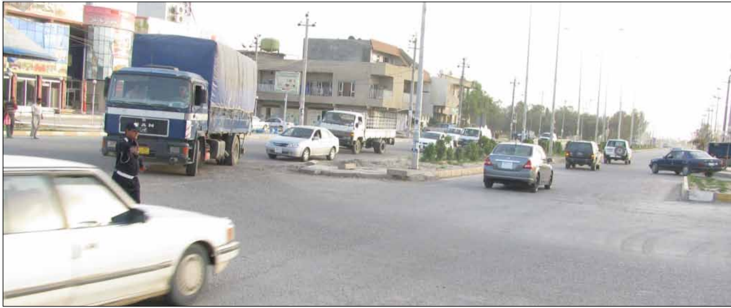
نه بوونی ترافیکی لایت چه ندین رووداوی هاووجوه دروست کردوه.

کاروان مه محمود هاوولاتییه کی شاری که لاره ئامازه بۆ نهوه ده کات که شاره که یان زۆر به رۆز له فراوانبوونداوه و ئۆتومبیلیکی زۆر له شاره که دا بوونی هه یه. نهو وتی