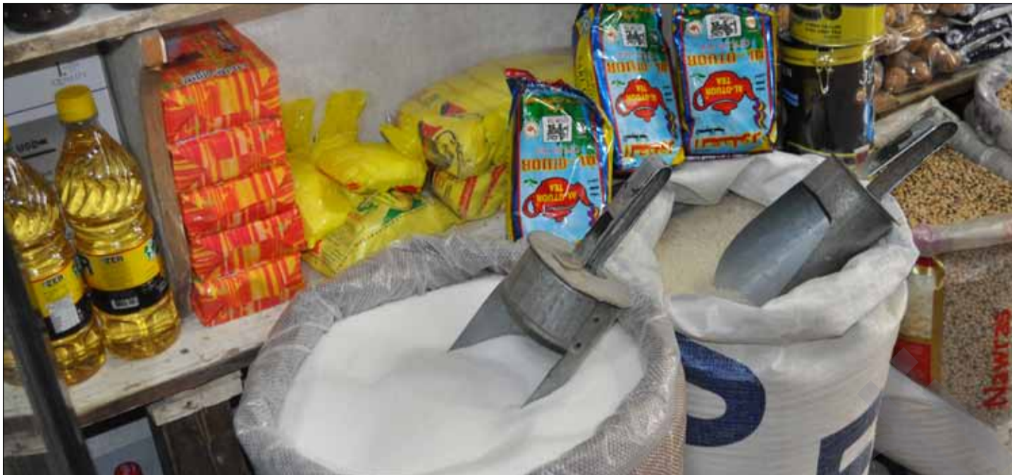
ماولاتیان له چاره پورانی هاتنی به شه خوراکي مانگانه دان.

چوار مانگه پسرله ي خوراکي ۲۰۱۰ نه هاتووه و نرخی خوارده مه نييه کانيش له به رزبوونه وه دايه