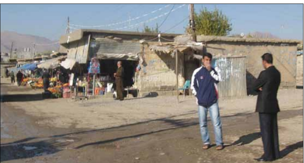
کشتوکال به چۆلکردنی گونده کان نابوژیته وه

گونده کانی ناحیه ی حاجیاوا له خزمه تگوزارییه سه ره تاییه کانی ریگوبان و بنکه ی ته ندروستی و ئا و بیبه شن و به رپرسیانی ئیداری ناوچه که ئاماژه به وه ده دن ئه وه ش به هوی چه ند ئالوگوریه که وه له ئاوه دانکرده وه ی ناوچه که دا، هه رچه نده که شفی ناوچه که ش کرابوو، به لام پرۆژه بۆ ئه و گوندانه نه نجامنه دراوه. له گه ل ئه وه ی حکومتی هه ریتم بریاریاوه که سالی ۲۰۱۰ بکاته سالی بوژانده وه ی که رتی کشتوکالی و سه ره ودان به گوندو گوندشینان، بوژانه وه ی سامانی ئاژه لو ره نیوه یسانی به ره می ناوخو، به لام گونده کان رۆژ به رۆژ به ره و چۆلی ده چن، سه ره پای ئه مه ئه م دانیشتوانه که مینانه ی که تا کو ئیستا له گونده کان ماون، به دوودلی له و گوندانه ژیان له نیوان چۆلکردن و مانه وه دا به سه رده به نو به ده ست ده یان گرفته وه ده نالینن. هه ریبه که له گونده کانی (قاجه، کانیوتان، خلیفه، مه میاوه، دوویشکه، نیوه و سه ردۆلو. هتد سه ربه ناحیه ی حاجیاوا به ده ست