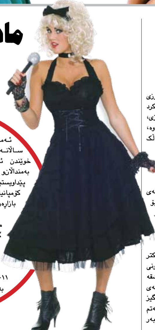
لوردیسی که‌چی مادونا

مادونای گۆران‌نیبژی به‌ناوبانگی ئە‌مریکی و لوردیسی که‌چه ۱۴ سالانه‌که‌ی بۆ سالی داها‌تووی خويندن ئەو به‌ره‌مانه‌ی که تاییه‌تن به‌مندالانو بریتین له‌جلو جانتاو پیلوو پیداو‌یستییه‌کانی خويندنگه، له‌ریگه‌ی کومپانیایه‌کی به‌ناوبانگه‌وه ده‌خه‌نه بازاره‌وه . هه‌موو ئەو به‌ره‌مانه له‌دیزاینی مادونا که‌چه‌که‌یزو به‌ناوی گۆرانیه‌کی مادوناوه ناوانون که "ماتریال گیل"ه، هه‌روهک پیشبینی ده‌کریت مادونا له‌سالی ۲۰۱۱دا بچیته نۆو سیکته‌ری به‌ره‌مه‌یانی پیداو‌یستییه‌کانی جوانکاریشه‌وه .