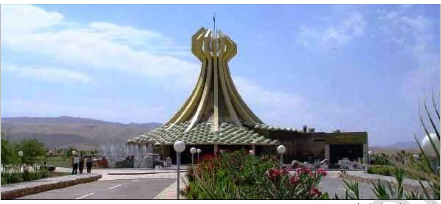
ژماره برینداری چکی کیمیایی ۵۰۸ برینداره

هاتوو برینداری بینوو، به لام له دواییه دایمیکی ئیرانی هاتوو له ۲۱/۲/۲۰۰۹ هاتنه سلیمانی، وتی "ئیمه وه کو کومه له بانگه شتمان کردن که تایبته بسون به نه خوشیه کانی کیمباران، توانیمان نه خوشیه کانی هله بجه و دوروبه ری هله بجه یان پیناسینین". لوقمان ئاماژه به وه دکات وه لیزنه به نه خوشیه کانیان پوینکردوه به سر س به شوه به شی یه که میان که نه خوشیه کانیان سهخته ژماره یان ۹۰ که سه، به شی دوهمیان ژماره یان ۱۶۴ نه خوشیه نه خوشیه کانیان ژوسخت نیه، به شی سینه میان ۲۵۴ که سه نه خوشیه کانیان باشه، به لام پیوستیان به چاودیری دکتور هیه.