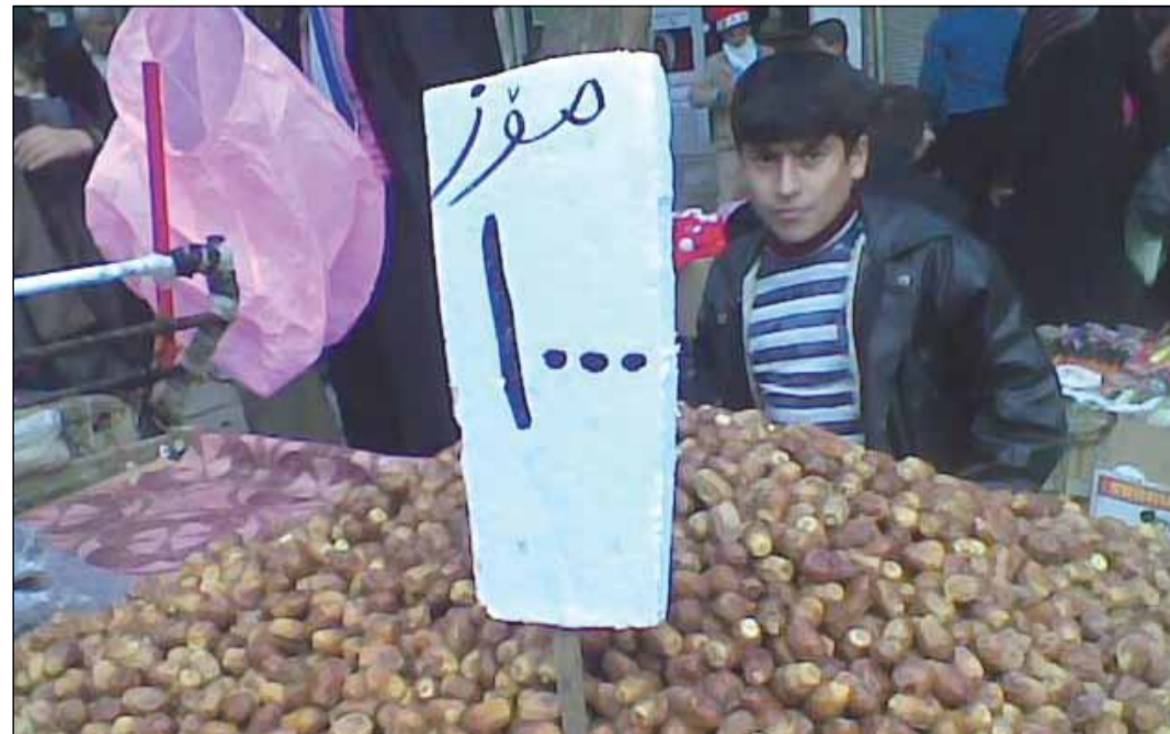
که‌ی نه‌ریتی ناوچه‌گریتی تیده‌په‌په‌نن؟