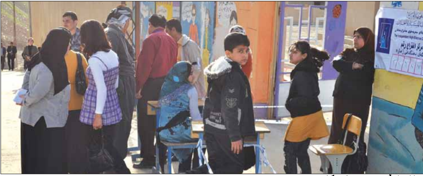
هزاران هاوولاتی بیبهشوبون له دنگدان

بهمه کانی هه لبراردن له کوردستان، هاوشیوهی هه لبراردنه که ی پیشوو، له چند ناچه یه کی کوردستان دووباره بووه وه، له جوری نیوونی دهنگی دهنگهرو دوچار دنگدانو پیشبیلکارییه کانی تری هه لبراردن.