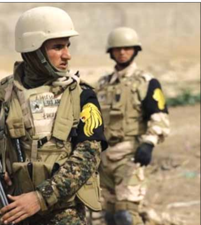
له قه قاعه ره تا مالیکی، جه نگ به رده واره

پیشتر له ماوه ی بانگه شه ی هه لێاردندا، عه لاوی باسی له چه ندین پێشیلکاریی کرد له وانه کوشتنی کاندیدیکی له شاری موسل و چاپکردنی ۷ ملیۆن کارتێ ده نگانی زیاده . ئو ناوه ندانه ده لێن: ژماره یه ک له گروپه یه کانی عه ره بی سونه رهنه گه ئه وه بلایه که نه وه که له لایه ن زۆریه ی شیعه وه فیلیان لیکراوه