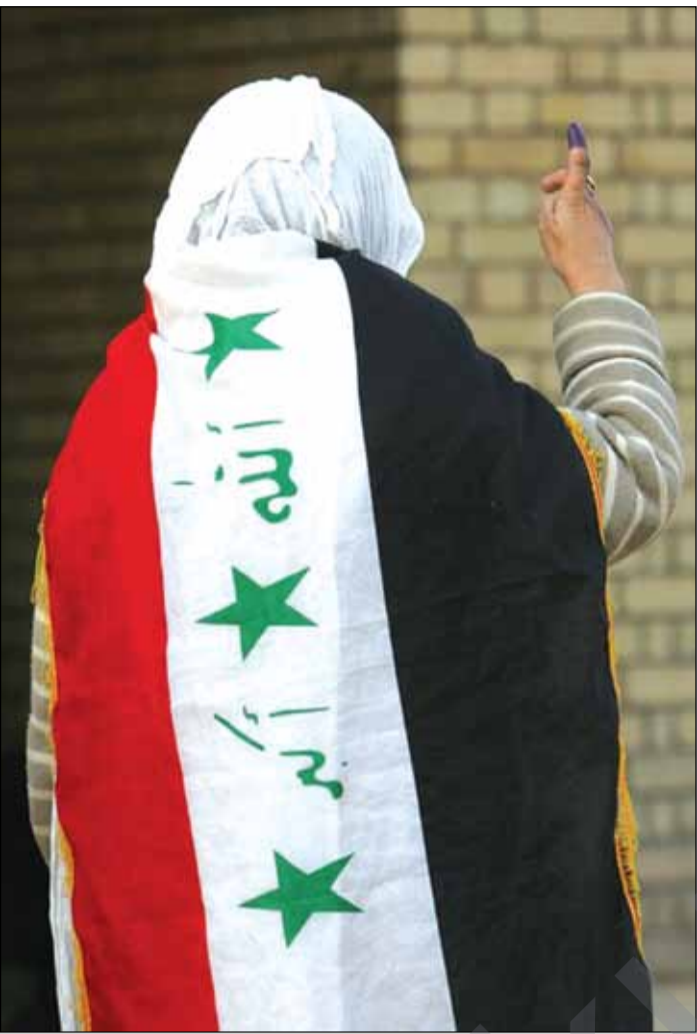
ئالاکه ی به عس بره ی ماوه

ئهم هاوپه یمانتییه که ئه یاد عه لاوی سه رۆک وه زیری حکومه تی ئیئتقالی سه رۆکایه تی ده کات، ئه گه ریی پێکهێنانی حکومه تی له هاوپه یمانتییه کی مالیکی که متره . هاوپه یمانتییه ئه لعیراقیه که پێده چیت له ناوچه ی عه ره به سونه کاندان پێشه نگ بیتو زۆریه ی ده نگه کان بیا ته وه، له وه لی ئه وه دایه