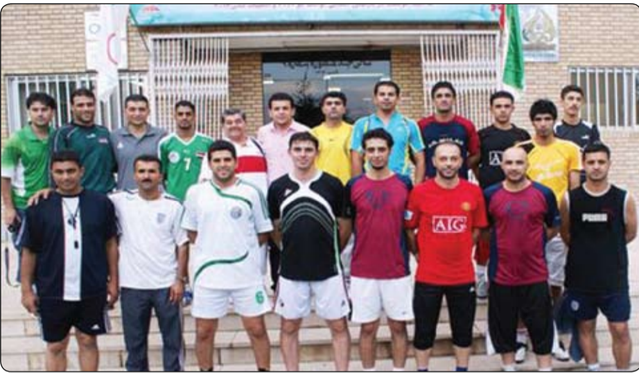
تیپی فوتسالی یانهی نه ورۆز

تیپی فوتسالی یانهی نه ورۆز رووبه پووی هه مان چاره نویسی تیپی تۆپی پیتی یانه کانی هه ولیرو نه جهف بووه وه وه له پاله وانیتی ئاسیا بییه شکرا . پاش نه وهی یه کیتی تۆپی پیتی ئاسیا بپاریدا یانه کانی هه ولیری پاله وانی خولی نایابی یانه کانی عیراقو نه جهفی دووه می نه وه پاله وانیتی له جامی یه کیتی ئاسیا بییه شکات، تیپی فوتسالی یانهی نه ورۆزیش رووبه پووی هه مان چاره نویسی بووه وه وه له پاله وانیتی فوتسالی ئاسیا بییه شکرا .