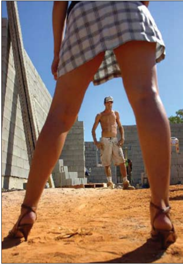
ناره زووی سيكسي له كه سيكه وه بۆ كه سيكيتر ده گه رپیت

باسكر دووه، نه ویش درمانيكي بۆ نووسيوه، مير وتی "به خواردنی نه وه درمانه توانای سيكسيم دابه زوی نه م كارم كه مكرده وه". درماني "فلوكسين" نه وه درمانه يه كه نه وه گه نجان به بۆ كه مكرده وهی ناره زووی سيكسيان به كاریده هین. جوانرۆ ته مهنی ۲۲ ساله و وتی "همو رۆژيک ده سپه پم نه نجامده دا، به هۆی خواردنی درماني فلوكسين نه م كارم كه مكرده وه، ئیستا به دوو ههفته جاريك نه نجامیده م". دكتور زيوار غه ريب حه مه، پسپۆری نه خۆشيه دروونی و ده ماریه كان دربارهی نه م ديارده يه ده لیت: خووه نه پنی حاله تيكي سروشتيه، هه تا نه وکاته ی كه زياده رۆی تیدا نه کریتو زیان به لایه نه کانی تری ژيانی كه سه كه نه گه به نيته نه توانی کاره کانی ژيانی رۆژانه ی خۆی نه نجامیدات، ونیشی "رۆجگار خووه نه پنی کاریه گری نه رینی ده بیته له سه ر توانای عه قلی تاك نه گه ر خويندكار بیته یان فه رمانبه ر بیته یان هر کاریک تری هه بیته، له مکاته دا ده بیته حاله تيکی نانا سایی و پیوستی به چاره سه ره هه یه". خووه نه پنی له سه ردو ره گه زی نیرۆ میدا هه یه وه له هه موو کۆمه لگایه کدا به پێژه ی جیاواز بوونی هه یه، له و کۆمه لگایانه ش كه ریه گه یان به نازادی سيكسي داوه له نتيوان هه ردو ره گه زه که دا نه نجامده ریت.