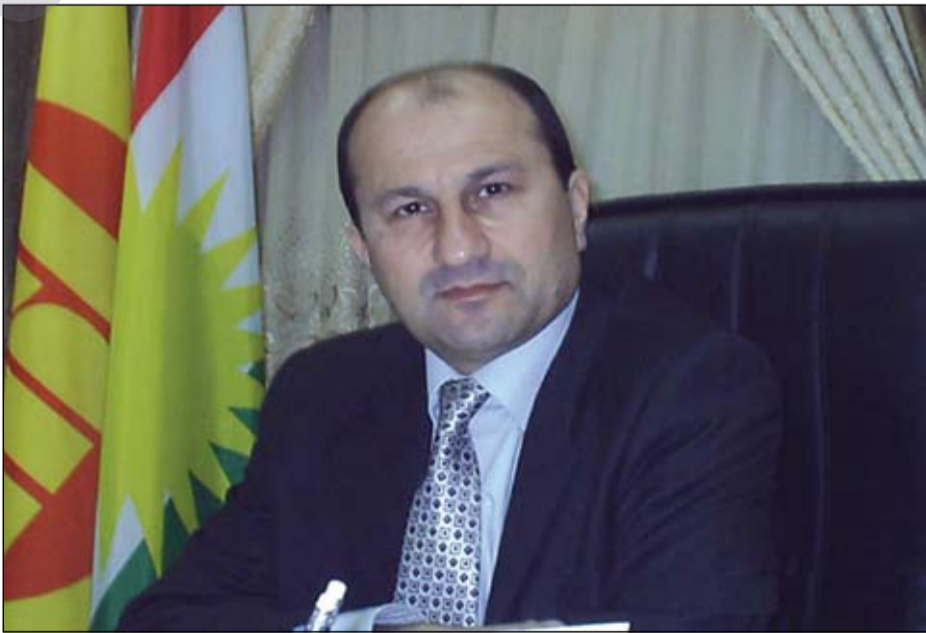
خه سره و گوران ده لئيت ناگه پينه وه بۆ نه نجومه نى پاريزگا تا له گه ل حه دبا ريكه ده كون

ده ستور: مه رچى ئيوه بۆ كوتايه يه تان به بايكوت كردن چييه و