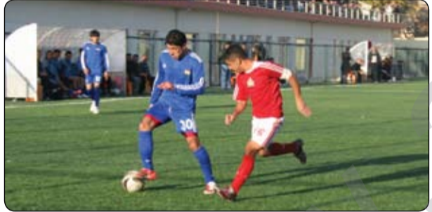
سىروانى نوئ لە يارپىبەكى خولى نايابدا

دەستووور: وہك پەرچەكردارىك بەرامبەر بەشدارىنەكردنيان لەخولى تۆپى پىنى پلە نايابى يانەكانى عىراق، دوو يانەكەى شارى سلېمانى سزاداران .