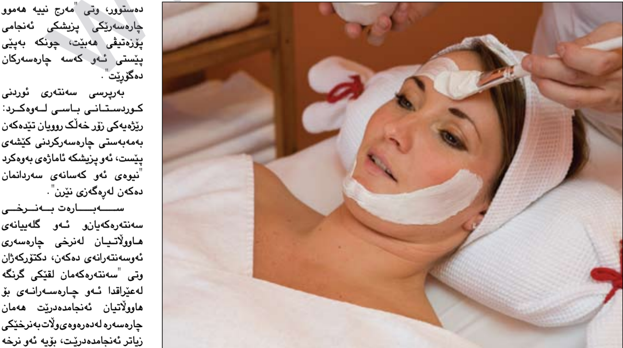
هاوولاتیان گه ییان له سه نته ره كانی جوانكاری هه یه

له هه مانكاندا ناتوانن گه رهن تی ۱۰۰٪ بدن به و كه سانه ی چاره سه ریان پیشكه ش ده كهن، ئاماژه بۆ نه وه ده كهن نه و كه سانه ی كه سود له چاره سه ره كان وه رناگرن نه و پاره یان بۆ ده گه رپتریتته وه. عه لی كریم به رپرسی سه نته ری لایف لۆنگ له شاری سلیمان، وتی "نیمه به گه رهن تی درمان ده ده یه هاوولاتیان، نه گه ریتو نه و درمانه ی وه ریده گرن نه ی توانی چاره سه ری