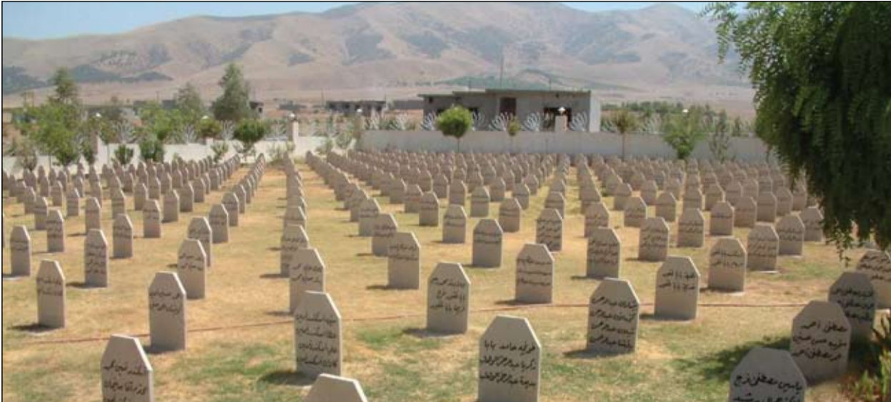
داو ده كريت قوربانى نيشتمان نه كرينه قوربانى ملامنئى سياسى