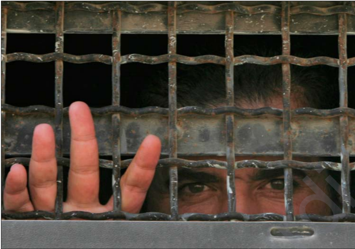
زیندانیانی سیاسی باوه‌پ به‌کاملا بگهن؟

چنار سهعد وه‌زیری پیشوی شه‌هیدان و کاروباری ئه‌نفالکراوانی حکومتی هه‌ریم، لیدوانه‌کانی محمه‌د ئه‌حمه‌دی سه‌روکی لیژنه‌ی شه‌هیدان و زیندانییه سیاسییه‌کانی په‌رله‌مانی عیراقی سه‌باره‌ت به‌خواردنی پارهی شه‌هیدان و زیندانیانی سیاسی، به‌بانگه‌شهی هه‌لبژاردن وه‌سفده‌کات.