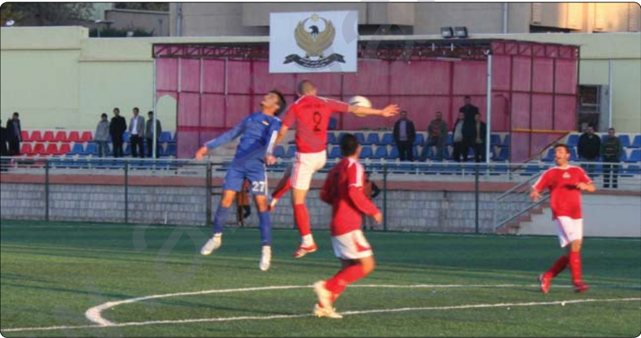
دیهمه نیک له خولی نایابی کوردستان.

له قوناعی دووه می خولی تۆپی پیتی نایابی یانه کانی کوردستان، تیپی یانه به شداره کانی خوله که به خۆیاند ده چنه وه هه ولی به ده سه ته یانانی نه نجامی شیواو ده دن . بپاره سه بی پینجشه ممه کاروانی کتیرکیکانی هه فه تی یه که می قوناعی دووه می خولی تۆپی پیتی پله نایابی یانه کانی کوردستان به پیکه ویتو چه ند یاریه کی گرنگ به پیوه بچیت . تیپی یانه ی که رکوکی پاله وانی قوناعی یه که م، له یاریه کی به هیژدا رووبه پووی تیپی یانه ی پيشمه رگه ی سلیمانی چواره می ریزه ندی ده بیته وه، یاریه که له یاریگی که رکوک به پیوه ده چیته و تیپی نه وه یانه یه له هه ولی نه وه دایه دریزه به نه نجامه باشه کانی بداتو هه نگاوه کانی بۆ به ده سه ته یانانی نازناوه که خیراتریکات، له به رامبه ریشدا تیپی یانه ی پيشمه رگه ی سلیمانی ده یه ویت چۆک به و یانه یه دا بداتو له ده ره وه ی یاریگی خۆی سئ خالی گرنگ به ده سه ته یانیت .