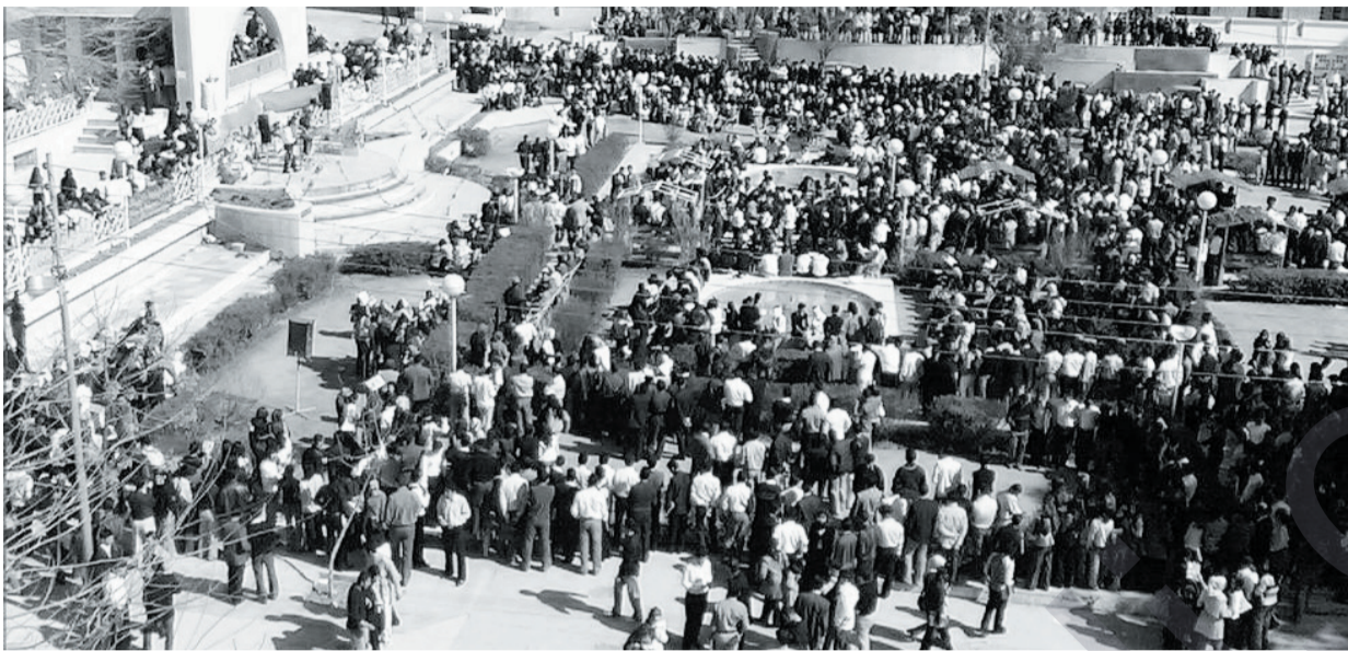
دیاردە "قیق و قاز" کۆتایی دیت؟

خۆیندکارانی تازە وەرگریاوە بەهۆی ئێمە زۆریەتی زۆریان پێشتر نەچوونەتە ناو زانکۆوو شارەزای کۆلیژو بەشەکان نین، نامۆن بەو ژینگەیی زانکۆ بۆیە ئێمە وەسفەیان بۆ بەکار دەهێنین. ئەو یەکەمە خۆیندکارێکی تازە وەرگریاوە لەپەرودەیی فیزیکی لەزاتکۆی سلێمانی، ئامارەیی بەو دە