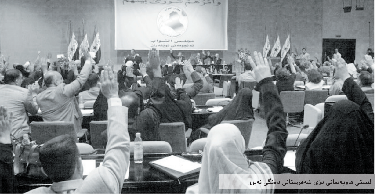
لیستی هاوپه یمانێ دزی شه هه ر ستانی ده نگه ی نه بوو

عه لی به لۆ: کات له وه تیه ریوه که بوو له به ر ده م نه و دا به یلیته وه تا شه هه ر ستانی له سه ره نه و مه سه لانه پاشگه زیبیتیه وه، ئیمه به نیازی نه و نه یێن له به رامبه ر نه و کاره دا له وه ره گرتنه وه ی متمانه له شه هه ر ستانی خۆ شپین، به لکو به ره وه ام ده یێن له هه وه له کانه مان بۆ وه ره گرتنه وه ی متمانه لێ. ده ستور: ئهم چۆ لگر دنی کورده