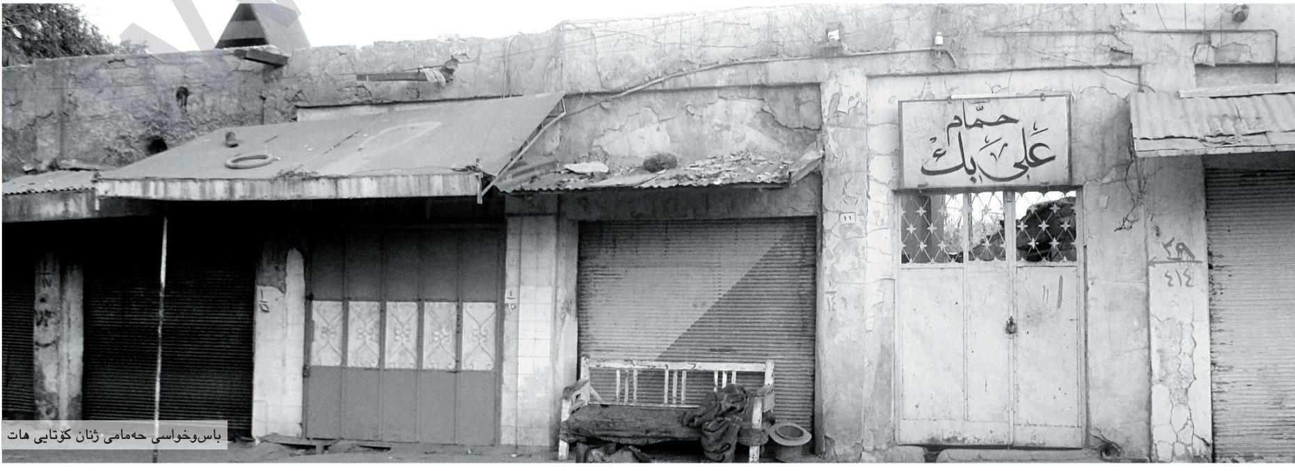
باس و خواسی هه مامی ژنان کۆتایی هات

سا هیره وتی "میژووی هه مامی ده ده هه مدی بۆ نزیکی ۱۵۰ سال