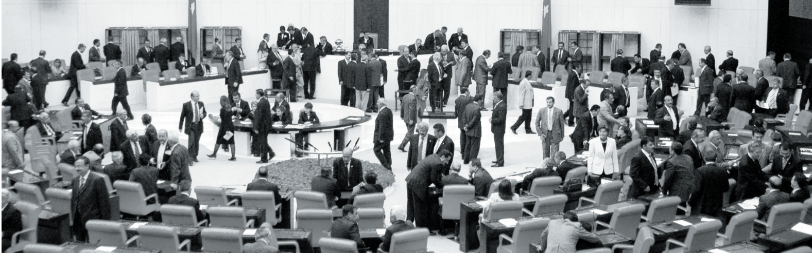
دەيمەنيك لەناو پەرلەمانى توركييا