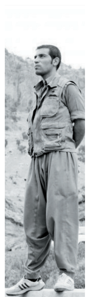
ئحسانی فه تاحیان قۆتۆ: دهستور

میژوی له سیداره دان و پرۆسه ی هاوشیوه بوون میژوی له سیداره دان هاوته ریپی میژوی دهسه لاتو هاوشان له گه ل پیکه اتنی هیژو تۆتوریته له قۆرمی دهسه لات، یاسا له دایک ده بیته، له قۆرماسیۆنی پیش ئه م قۆناغه، شه رو تیکه له چوون زمانی مرۆفه کان بووه و پاریزگاریکردن له مافه کان له خانه ی توندوتیژی ده گرسایه وه، له گه ل له دایک بوونی دهسه لات، ده لاقه یه کی نوخ له ژانی مرۆفه کان ده کریته وه، یاسا داده ییز ژیت و داده ور بۆ په یوه ندیبه تازه کان راده سپردیت، له سیداره دان وه که سزایه بۆ سه رپیکه که له یاسادا ده ستنیشان ده کریته و له م سیستمه تازه هیه دا ترسو و تۆقاندن وه که تنیا نامانجی سزادان ده ستنیشان