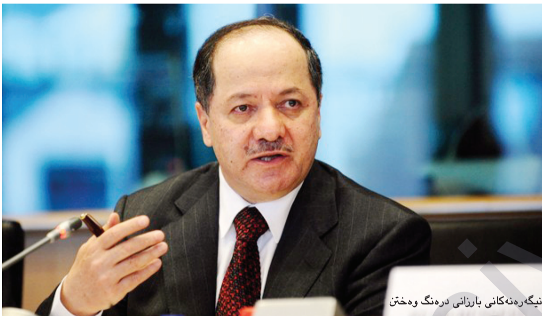
نێگه‌ره‌نه‌کانی بارزانی دره‌نگ وه‌ختن

له‌یاسای هه‌لبژاردنه‌کان به‌ پشتمه‌ستن به‌ ئاماری وه‌زاره‌تی بازگانی عێراق، ژماره‌ی کورسییه‌کانی ئه‌نجومه‌نی نوێنه‌رانی له ٢٧٥ کورسییه‌وه زیاد کرد بۆ ٣٢٢ کورسی، له‌زیادکردنه‌که‌ سێ پارێزگاگه‌ی هه‌رێم ته‌نها ٢ کورسی بۆ زیادکراوه.