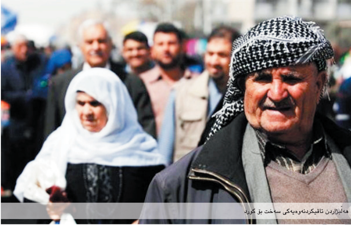
ههلبژاردن تاقیکردنه وه یه کی سخته بۆ کورد

په ره مانترایی یه کگر توو: له کاتی دهنگدان به یاساکه نه نامیکی لیستی هاوپه یمانی وتی دهنگدانمان په رداخیک ژهره، به لام ناچارین که بینوشین