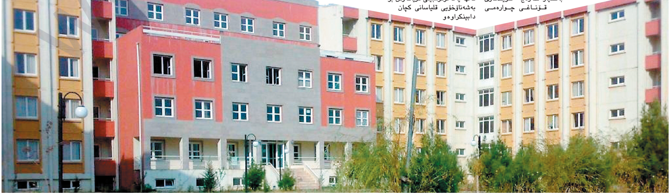
"گەر بنکە تەندروستییمان بۆ ناکەن، ھیچ نەبیت با ئۆتۆمبیلیمان بۆ دا بێن بکەن."

ئەو نەخۆشییە کە توشی من بوو بەھۆی درەنگ گەشتە نەخۆشخانە لەسەری قورس کردبوو و چەند رۆژیک لەناو جیدا خستم." بەشە ناو خۆیی قلیاسان کە لەسەر رێگەکی سلیمانی تاسلو جەو لەنیوان گەرگی راپەڕین و قلیاساندا بە زۆرتێن خۆیندکاری تێدا بەو لەسێ بەش پیکدیت کە دووانیان خۆیندکارە کورەکانی تێدا بەو ھۆی تریان خۆیندکاری کچی تێدا بە.