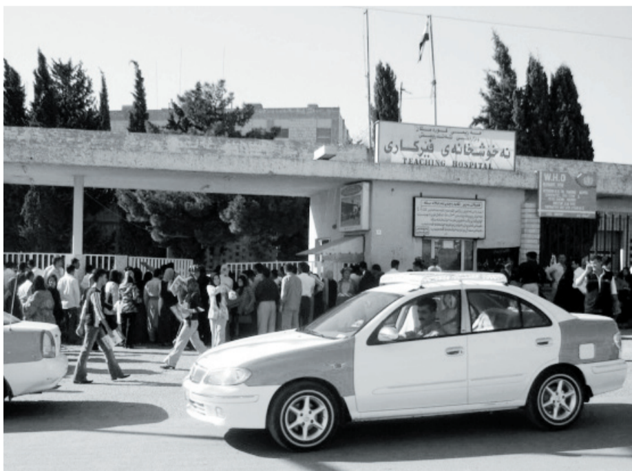
کرتی ته ندروستی رووبه پروی قه یران ده بیته وه

ئه و نه خو شخانه یه هینرو نه ته نه خو شخانه که مانو یه که نهومی ته وومان دلونه تی که زیاتر له (۱۰۰) جینگایه تا نه خو شخانه که یان ته وادوبیته". هه ره وه ئاماژه ی به وه دا که هه رچه ند ماوه ی زیاتر له ۶ مانگه نه خو شخانه ی هه ناوی فی رکاری ته وادوبوه، به لآم به هوی نه بوونی ئامێرو که لوپه ل له ناو نه خو شخانه که تا ئیستا شه یه نه خو شخانه ی فی رکاریدان و وتی "به هوی ژوری نه خو شخانه کانیان له ناو مه مه رو له سه ر زه وی نه خو ش ده خو ینریت، که ئه وه شه مه ترسی زیاتره و کاریکه ناچه قیه به رامبه ر به نه خو ش".