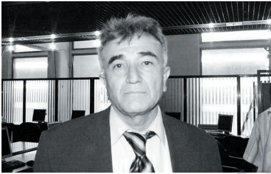
عه لی حسه ین فۆتۆ: نیوزماتیک

له به غد بۆچی ده گه رتیه وه، نه گه ر به م شه یوه بیت نه و له داها تووشدا ئیه ناتوانم متمانه له شه هه ر ستانی وه بگره نه وه؟