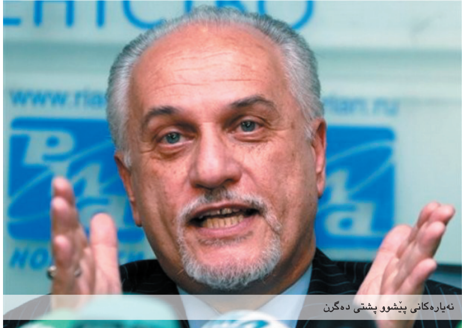
نه یاره کانی پیشوو پشتی ده گرن

سه رکردایه تی لیستی هاوپه یمانی په شیمانیه له بانگه یشتکردنی شه هرستانی، له کاتیکدا زیاد له دوو سه له له هوی نه وه دایه متمانیه لیوهریگرته وه، به لام به شپک له نه نامانی لیسته که ده لین شه هرستانی دژایه تی سیاسه تی نه وتی هه ریم دهکات بۆیه به پیوستی ده زانن لیپچینه وه ی له گه لدا بکرتت. له کۆی 53 نه نامی کوتله ی کوردی له په ره مانیه عیراق ته نه ا 6 که سه ناماده ی دانیشتنی تابهت به لیپرسینه وه ی حوسه ین شه هرستانی وه زیری نه وتی حکومه تی عیراقی بوون، نه نامانی لیستی هاوپه یمانیش هیچ به لگه یه کیان له دژیه شه هرستانی پیشکش به لیژنه ی نه وتو غاز نه کردوه.