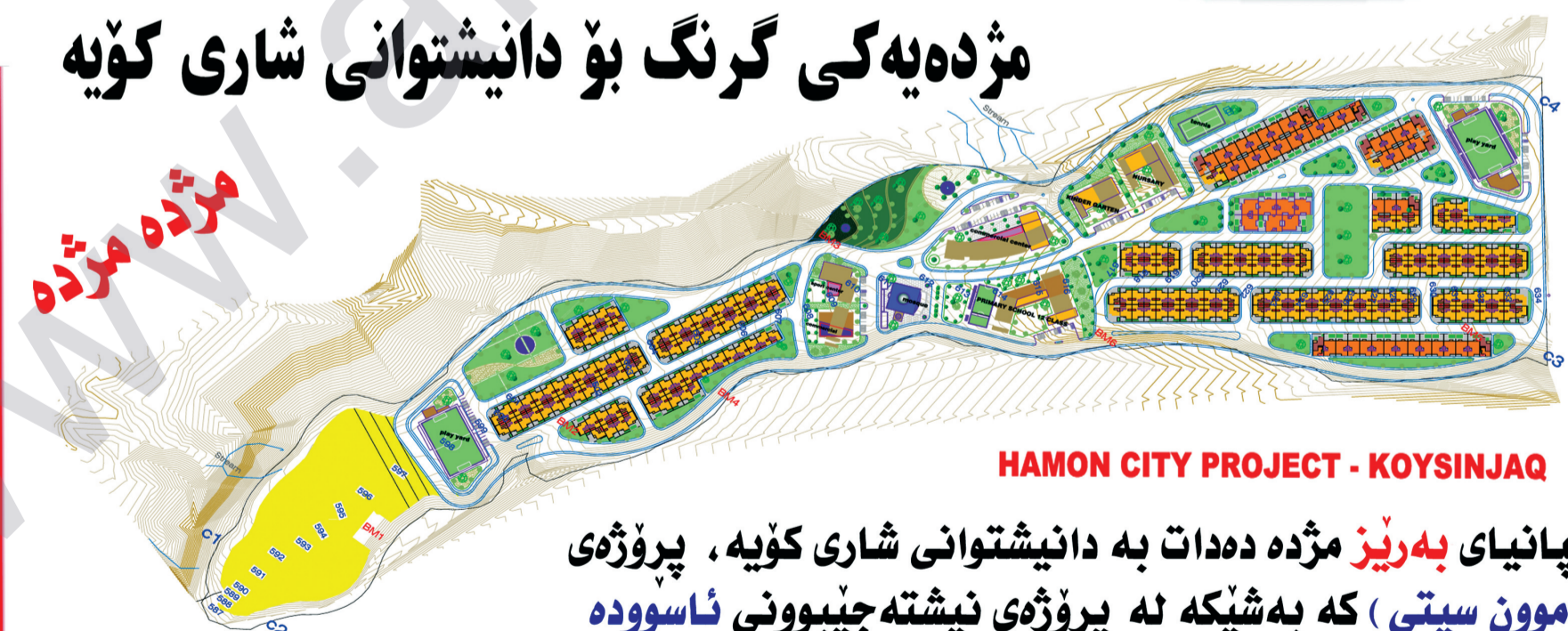
HAMON CITY PROJECT - KOYSINJAQ

کۆمپانیای بەرێز مژدە دەدات بە دانیشتوانی شاری کۆپە، پڕۆژە (هامون سیتی) که بەشیکە لە پڕۆژە نیشته جیوونی ئاسووده کهوتە قوناغی جیبه جیکردنەوه، خانووهکانی (هامون سیتی) له سه رووبههاری 200م 2 150م 2 دروست دهکریت به قهرزی درێژخایهن و به هاوکاری سندوقی نیشته جیوون دهدریت به بهشداربووان