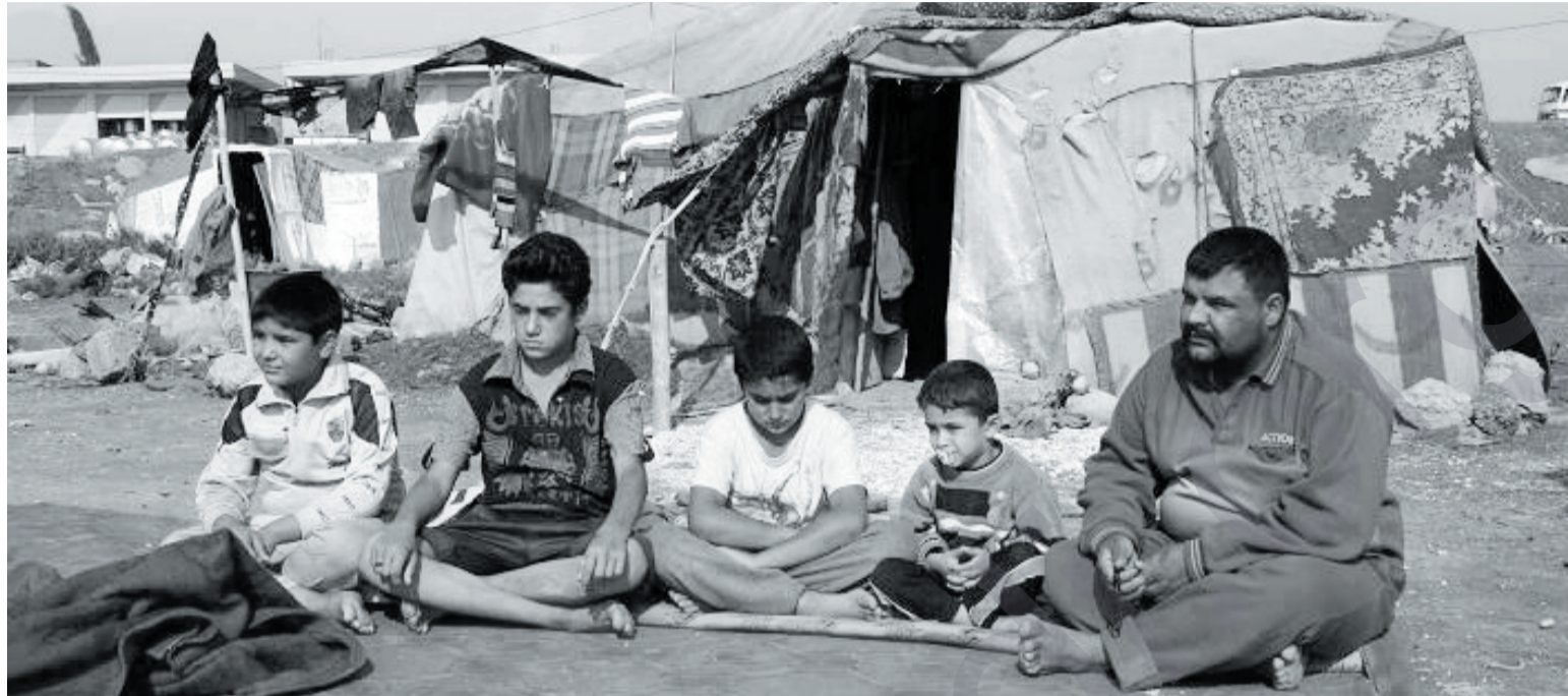
نوهی نوئی قهره ج ژیاں له ناو دهوارو ره شماله کاندایا به سهر نابات

مۆزیک کوردی وهک (دههۆل)، زورنا، سازو که مانچه". محمود ساله سی تهمین ۴۲ سال که له ناوچهی مسریکیی سهر به قهزای سمیل دهژی ناماژهی به وهدا "هیشتا ئیمه ژیانی خومان له ژیر دهوارو ره شماله کاندایا به سهر دههین و باری ژیاومان ژور خرابه، ئه وهتا له وهزی زستاندا ژیاومان ئه وهتا له وهزی هاتی سهرما و باران بارینه وه که ناوچه کهی ئیمه به زوری گرتوته وه". به پیی ئه و زانیاریانهی له ریگه سی سهرچاوه کی تاییه توه دهست دهستور که وتوه، (۱۹۵) خیزان له سلیمانوی (۶۲۲) خیزان له کهروک و (۱۴۲۲) خیزان له ههولیر (۸۷۶) خیزان له دهۆک و (۲۰۲) خیزان له موسلو (۲۸۵) خیزان له بهغدادا دهین، که کۆی هه موویان دهکاته (۴۲۲) خیزان، هه موو ئه و خیزانان هه قهره جی کوردن و به شیوه زاریکی تاییه ت دهوین که له ناوچهی قهره جه کاندایا پیی دهوتریت زمانی (دۆمانی). ههر به پیی ئه و سهرچاوه یه، (۷۲۴) قوتابی له ناو و خیزانه قهره جه کاندایا ههیه. عه بدولرهمان ئه وهشی رونکرده وه، ئیستا ۹۵٪ مندالانی دههۆک له خویندنگه کانی دهۆک ده خویندن و سهنتره که شیانی به بهرده وامی خولی نه هیشتنی نه خوینده واری سازده کات بۆ ئافره تانی قهره ج، له گه ل خوله کانی نه هیشتنی نه خوینده واریشدا خولی نه هیشتنی ئافره تانی مندالانیش به ریبه ده به، له و ریبه شه وه تارا ده یه کی ژور باش شیوانی ژیانی قهره جه کان گۆرانی به سهردا هاتوه. قهره جه کان له چه ند بنه ماله به ک بیکدین و ناوی تاییه تیان ههیه که ژۆبه یان گوزارشته له و