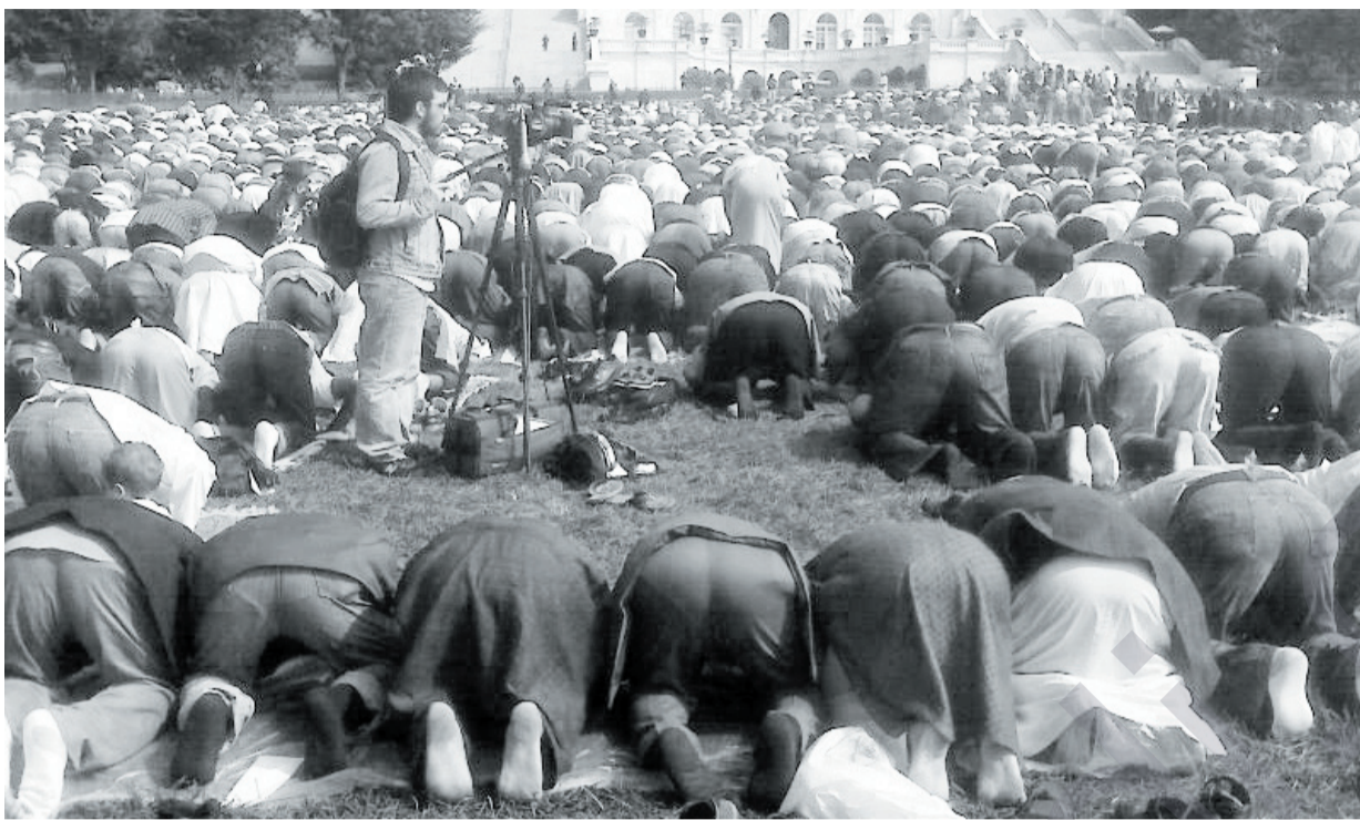
لهسر چ بنه مایهک نایین دهیوی ئاراسته مان کات، ئەقل یان نهقل؟

بههوی ئهوهی که سرووشتی بوونی مروّف مهحکومی دووچوره له بوون، یهکێکیان بوونیکی روحی و میتافیزیکی و ئهویتریان بوونیکی جهستی و مادی و فیزیکی. کۆبوونهوهی ئهم دوو بوونهش بیکهوه لهیهک فورم دا وای کردوه که بهردوام ئهم دوو بوونه لهجهدهلیکی مهعنهوی دابن، چونکه ههیهک لهم دوو بوونه ئهوکاته دهتوانیته بهخۆی بگاتهوهو خۆی بناسیته که بهسر ئهویکه دا بالادهست بێت، بهمانایهکی تر بوونی ئهم ئهوکاته مانای دهبیته که فەشەل بهبوونی ئهویکه بهیئیت. بۆیه لهگهڵ بوونی مروّف دا ئهم جهدهله هاتوته بوون و بهردهوامیشت بوونی دهبیته، لهلایهکی کهشهوه بههوی ئهوهی که مروّف ناتوانیته بهدهر لهوانی که بژی و مهحکومی جوړیکی کهیه له بوون که ئهویش بوونیته له چوارچێوهیهکی گۆمه لایهتی دار، لهم روهوه ژیانی مروّف لهگهڵ ئهوانی تر دا روهی روهی جوړیکی تری له جهدهل کردیهوه که نهویش بریتیه له جهدهلی مانهوهو زالی بوون بهسهر ئهوی دیکه دا.