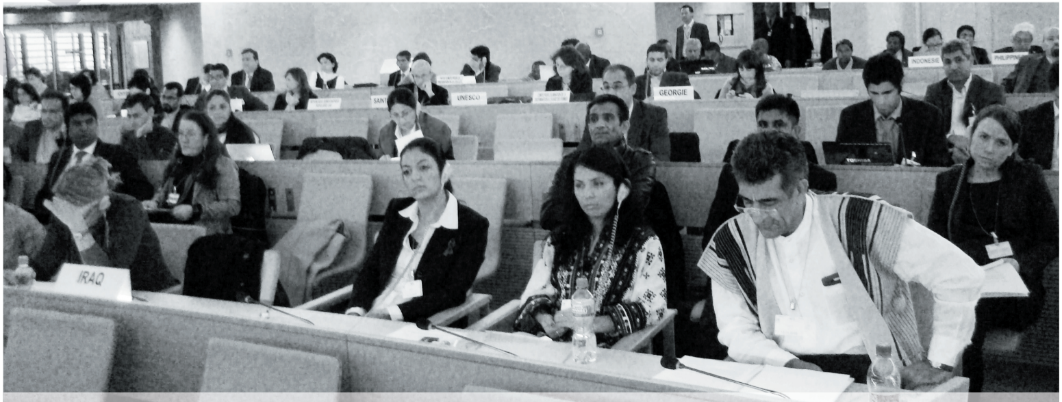
جنيف: كؤنفرانسى كه مینه كان و به شداری سياسی

زه مینه ميژوویه كانی نه م كؤنفرانسه بۇ ۱۷ سال له مه ويپشو بۇ په سندردينى مافی تاكه كانی سه ره به كه مینه نه ته وه یی، ئابینی و زمانیه كان له لایه ن نه نجومه نی گشتی ريكخراوی نه ته وه په كگرتوه كان ده گه ريته وه، كؤنفرانسه كه هه فته ی رابوردو، دوو مه ن كؤبوونه وهی ريكخراوی مافی مرؤقی سه ره به نه ته وه په كگرتوه كانه درباریه نه م پرسه و په كه مین كؤبوونه وه له دیسه مه بری ۲۰۰۸ به ريپوه چوو.