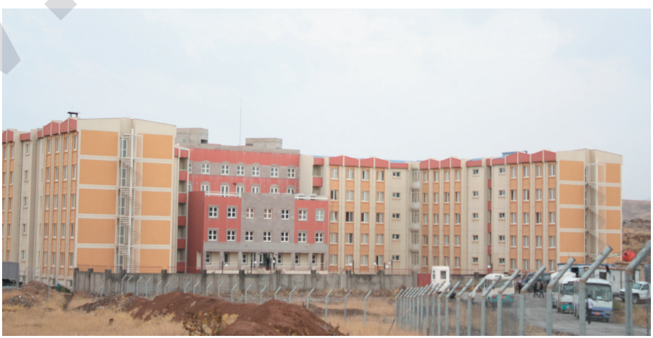
نازانرەت كەمپى زانكوى سلىمانى كەى تەواو دەبىت

لەنرخى كەل و پەلى بىناسازىدا روويىدا، ناچار كۆمپانىيە ناوبرو كارەكانى تەواوكرىن پەروژەكەى وەستاندوو. كەمپى زانكوى سلىمانى پىكەتووە لە (۵۲) بىنا تائىستا تەنھا (۱۷) بىناى كارى تياكراو، كۆلێژى ھونەر و كۆمپوتەر تەواوكرى، ھەردوو كۆلێژى زانست و كۆلێژى بەرپۆھەردىن ئابوورى (۲۰٪) بىان تەواوكرى، كۆلێژى ئەندازىارى (۸۰٪) و كۆلێژى بنەرەتى (۶۰٪)، ھۆلى وەرزش (۹۵٪) بىان تەواو بوو، ھەردوو سەنتەرى تەندروستى و بازىگەنى تەواوكرى، بەلام كۆلێژى زانستە مرقاھەتەيەكان تەنھا بناغەى كراو و كۆلێژى ياسا تەنھا ھەفرى بناغەكراو، كافترىكان يەككىيان تەواو كراو، بەلام ئەو دىكەيان لەبناغەدايە. كاركرىن و تەواونەكرىن ئەو كۆلێژى بىنايانەى دىكە لەكاتىدايە كەمپى نوپى زانكوى سلىمانى كەمپى نوپى زانكوى سلىمانى دەكەوتە رۆژئاواى شارى سلىمانى لەنرىك گەرەكى قلىسان، ئەم پەروژەيە لەلایەن كۆمپانىيە تەپە توركى (TEPE) و كۆمپانىيە فیدرالى خۆمالى (FDC) يەوھە جىبەجىدەكرىت، بەلام بەھۆى ئەو قىرانە ئابورىيەى جىھانى گرتووتەو ئەو زىادبوونەى