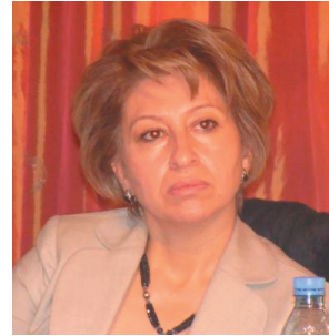
سه میره حسین له هه ولێر

پینشکه شکردنی راپورتی سیبه ره له سه ره په یماننامه ی سیداو بۆ نه ته وه یه کگرتو وه کانه، که گروپیک له ریکخواه کانی ژنان له به غدا وه سه رانی کوردستانی کردووه، شاندی میوان له ۱۰ ریکخوا ی عیراقی پیکهاتوه بۆ پیکهاتی لیژنه یه که له ریکخواه کانی عیراق و کوردستان تا وه کو راپورتیک شیکاری سه به رته به دۆخی ژن و کیشه کانیان به ریزه که وه بۆ نه ته وه یه کگرتو وه کانه، ئه ور راپورته نیکه ی ۷۰ لاپه ره ی لی ئاماده کرا وه له لایه ن شاندی میوان سه به رته به پیشیکاری به کانی ده ستوری عیراقی بۆ مافه کانی ژنان و به ندو