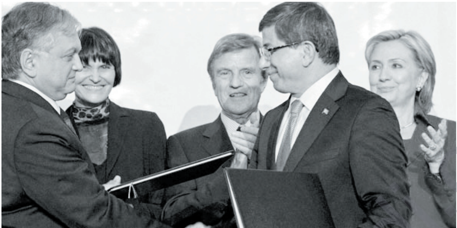
فؤتؤ: رويته ز

نه م وه ي نه وه بلنم که نهو نه رک و کاره له نه سؤتى ميؤوونوسانى نيو ليژنه فرعيه کانه زؤر ناسانه. چونکه نه وه ي که يئنه چي روييدات نه وه يه که نهرمينيا سوره له سر دانپيناني نه م روداوه به جينوسايدو تورکياش به رده وام نابى له ناساندى نه م پرسه. نه م کارنکي نه گونجاو حتمى نيه، نهو هاوکيشه يي که تاييه ته به م کيشه يوه ريگه به خلك ده دات که به م پرسه رازى بي يان نارازى. پرؤسه ي ناشته وایي ته و او به بووه. زؤر له ته حدداکانو خالى جياواز هسته که له پيشه و، نه توه په رسته کان تهنه لايه ن نين که پرؤسه ي ناشتيا ن پياش نه بي. نيشتمانه پرسته راستنگو کانينش کيشه يان هه يه له گهل نه م بابه ته دا، دهنگ چندين نالؤزى کيشه له به ردم ره وتى ناشتيدا بي، به لام دهر نه جامه به رايه کان لايه ن پؤزه تيقانه ده خه رويو نه ک تهنه له باره ي په يوه نديه نووقؤليه کانه وه، به لکو پيشنبارى نه وه ش کراوه که به ديه لک بؤ ناشته وایي ميؤوويش بؤزؤريته وه هه رچه نده له دهره قتي وه ها کارنکدا نايه ن و ناتوانن بگه نه سازانو ته وافوقئک له م باره وه.