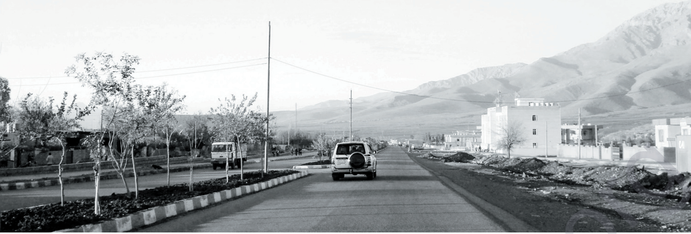
حيزبه ئيسلامييه كان ته وئيله و بياره و خورمال به جي نفوزي خويان ده زانن