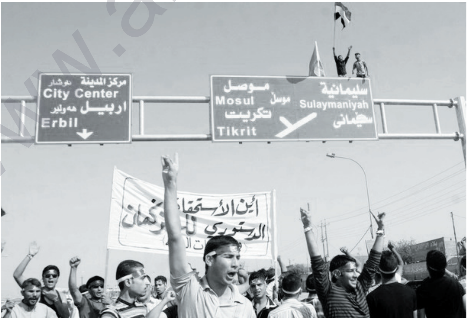
کورد به شه قامیکدا ده روات و تورکمانیش به شه قامیکدا