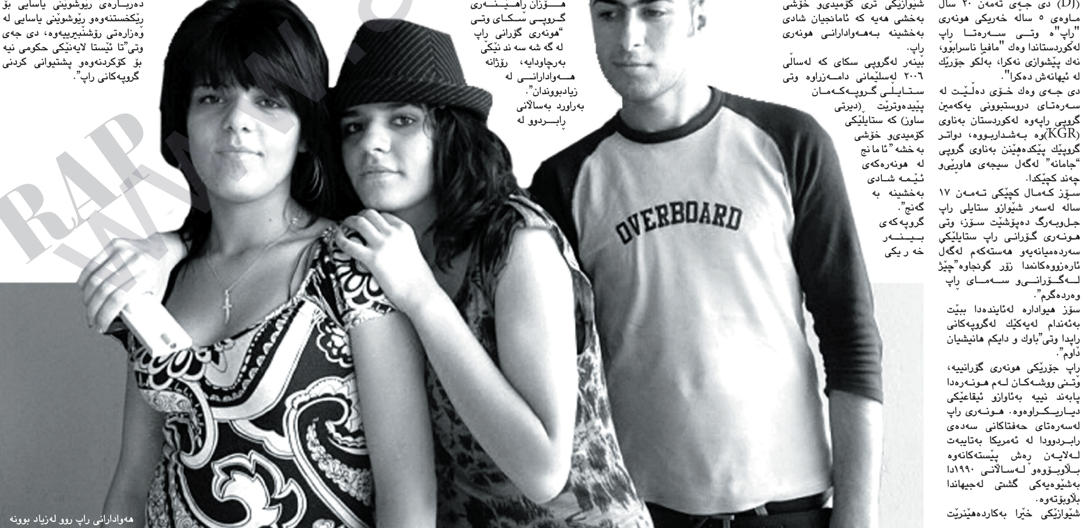
هه وادارانی راپ روو له زیاد بوونه

گه نجاننه کی کار بؤ زیندوکردنه وه ی هونه ری کورده ی ده کهن ژور که من به به راورد به ریږه ژوره ی راپ”. سه لاجه ره ش به ریږه به ری سه نته ره رو شنبیره گان و تیبه هونه ری کانی سلیمانې له وه زاره تی رو شنبیری ناماژهی بؤ شو وکرده شم که هه موو گروپه هونه ری کان له خوبرگیت. شو و به برسه ی وه زاره تی رو شنبیری وتی “تانیستا هه گروپيکی راپ په یوه ندی پیوه نه کردوون و هه ر گروپیک په یوه ندمان پیوه بکات ناماده ی هاوکاری کردنیانین به پیی ری نمایه کان. سه لاجه ره ش وتی “راپ ژوربه ی لایه نه کانی هونه ری له خوبرگتوه، نمایشی شانوی و نواندن و موسیقاو ده کی شو هه ی، بؤ یه جیگی خویته ی هاوکاری بکرین”. ده براره ی رو شوینی یاسایی بؤ ری کخته سته وه رو شوینی یاسایی له وه زاره تی رو شنبیری وه، دی جه ی وتی “تا نیستا لایه نیکی حکومی نیه بؤ کورده وه و پشٹیوانی کردنی گروپه کانی راپ”.