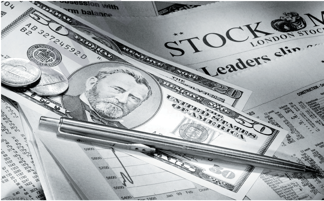
پێشبینیەکانی ئابوریناسان بەهای دۆلار دەکوژن

دراوی داهاوتو بێت، بەلام نەک لە دوای ۲۰۲۰ کاتی شەنکەیی دەبیت سەنتەریکی گەورەیی بازارێ دراوی جیهان، تانە و کاتەش دراوی ئەبەر ئەوهی ئەوروپا و ژاپۆن بە دەست کێشەیکێ دارایی ترساناوه دەنالیین. رەنگە رنمینی دراوی چین