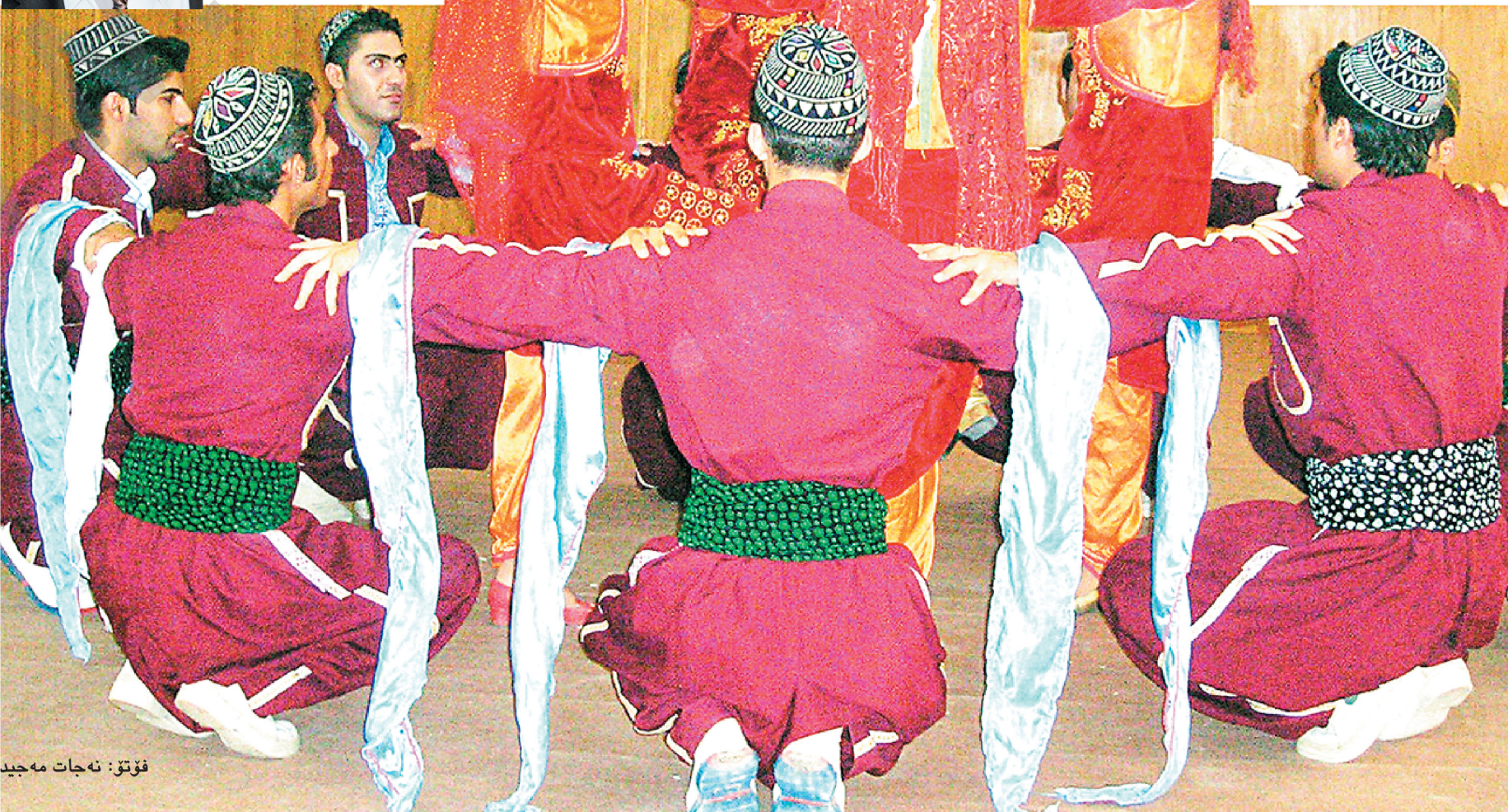
فوتق: نه جات مه جید

جه ماوه ردا، وهزی دووه میشی له سالی ۲۰۰۳ دا پیشکه شکرودوه له سالی ۲۰۰۳ دا وهزی سیبه می پیشکه شکرودوه که دهنگو سه دایه کی باشی له نیو کورستاندا هه بوو. تپی هونهری میلی بیجگه له و نمایش و وهزانی پیشکه شکرودون به شداری سئ فیستقالی دهره وه ی هه ری می کورستان کردوه، نه وانیش له ئیران و هۆلندا و به غدا بۆ داهاتوو. تپی هونهری میلی له سالی ۱۹۹۷ دامه زراوه یه که م وهزی نمایشی له سالی ۱۹۹۸ له نه جامداره، وهک یه کتر نا سین له گه ل