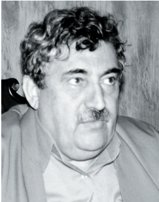
مه مه دی حاجی مه حمود

۶- به رده وام داتا و زانیاری له سه ر کاری ناوخی دامه زروه کی په یوه ندیه دهره کیه کانی کوکاته وه، لیکو لینه وهی زانستی نه نجام بدری بۆ ئه وه ی لیوه له سه ر ئاستی سیاسی و ئابوری و کومه لایه تی به ده ست به یینی ت.