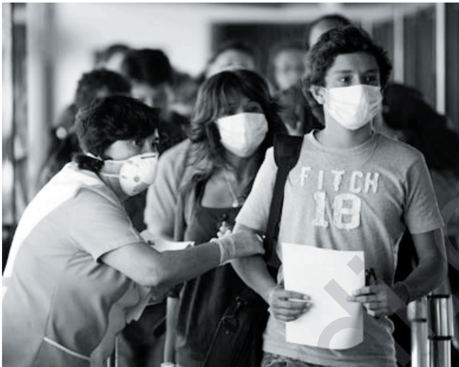
شاخه وان مه محمود له سلیمانی

له گه ل سارد بوونی كهش و ههوا مه ترسیه كانی نه نفلونزای بهراز له عتراقدا روو له زیاد بوونه له هه ریمی كوردستانیش له بازگه كانی نیوان هه ریمو باشورو ناوه راستی عتراقدا ههچ جوره پشكنینك نه نجام نادریت. ته نهاله فرۆكه خانه و خاله سنوریه كانی هه ریمی كوردستاندا پشكنین بو به تایی نه نفلونزای بهراز هه ریمو باشورو ناوه راستی عتراق پشكنینی تیدا نه نجام نادریت، له كاتیكا رۆژانه چه ندین كهس له ناوچانه وه سهردانی هه ریم دهكهن. پسپوړانی سواری ته ندروستی جه ختله وه دهكه نه وه له گه ل سارد بوونی كهش و ههوا ریژه توش بوون به په تایی نه نفلونزای بهراز زیاد دهكات، هه چهنده تا ئیستا له كوردستاندا ۱۱ خاله تی توشبوو بو نه خو شیبیه تومار كراوه.