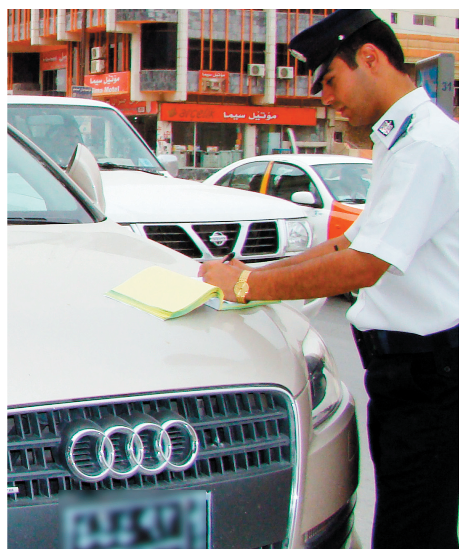
با شه قامه کاشان بێ چاکبکه ن ئینجا داوای مۆله تی شوڤیری مان لیکه ن " قوتق: شاخه وان مه محمود

له شوڤیره که کوربین، که چی میلی ده مانچه ی لێرکیشابوو، پۆلیسه کانی ئیمه ش نازا و لیهاتوو بوون، توانیان بیهینن بۆ بنکه و دواتر که له کیشه که تیکه یشتین شوڤیره که و پۆلیسه که ی خۆمانمان ئاشته کردوه و سولحمان کردو شوڤیره که شمان نازاد کرد".