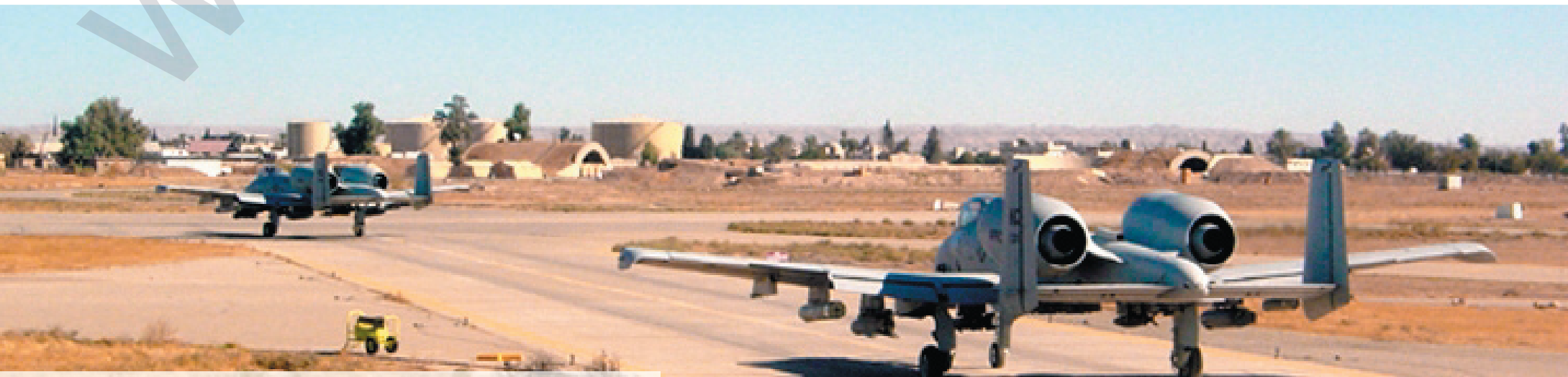
به هزی شاری عیراقه وه کۆمپانیا نه مریکاییه کان داوی به رکه وتنی پشکی شیری نه وتی عیراق ده که ن

ماجید نه مین له دوی نه و قه برانه نابورییه که جیهان و سه رجه م نابوریناسانی به خویوه سه رقا لکر دووه، ولاتانی تازه پیگه یشتوو بوژانه وه یه کی زیاتریان به خوو بینوه، نه گه چپی هیزی کار له هه ندیک له و ولاتانه که متر بوته وه نه وه ش کاریگه ری بو سه ر نزمیوونه وه ی سه رمایه و ناریکی له به ره مه یان هه یه، عیراقیش یه کی که له و ولاتانه ی که سه ره تایه کی تازه ی هه یه له بوژانه وه ی نابوری به تاییه تی له م