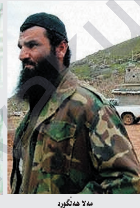
«مەلا هەلگورد» «ئەبو تەیب» «ئەبو فەلاح» «ئەبو زیاد» «ئەبو وهلید» «مەلا نزار»