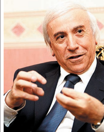
«ناشتی هه ورامی»

پیش تەواووونی وادهی سزاکە ی کۆمپانای DNO نەرێجی، ناشتی هه ورامی له نامه یه کدا به راگه یاندوو که سزاکه ی که مکروه توه بۆ دوو ههفته و ده توان ده سته که نه وه به کارکردن، سه روکی دیوانی ئەجموئە و هزیرانیشت دەلیت ناگاداری ئەو مەسە له یه ن.ین. بەپاسای له که دارکردنی ناویانگی، حکومتی هەرێم سزای کۆمپانای DNO نەرێجی دا به شه شه ههفته راگرتنی کاره کانی، بەلام دوینی کۆمپانای DNO نەرێجی له به یاننامه یه که دا رایگه یاند که حکومتی هەرێم دووباره ریگه ی پیدوان دەست به کاربینه وه، له راگه یاندوو که هاتوو «له ئیستادا سەرجه م کێشه کانیان له گه له حکومتی هەرێمدا چاره سه ر کردوو». بەپێی راگه یاندوو که ی هی ئۆکتۆبەر، ناشتی هه ورامی نامه یه کی ئاراسته ی کۆمپانایه کیان کردوو وه تیددا هاتوو که «کۆمپانای DNO سەرجه م مافه کانی پێشووی بۆ ده گه ریندێته وه ده توانیت دووباره ده سته به کاربینه وه به بێ بونی هیچ جۆره به ندو بارێک». ئەم به یاننامه یه ی DNO له کاتیکدا به که هەندیک له په رله منتاران ی ئەجموئە نوێەکانی عێراق دای روونکردنه وه ی زیاتریان کردبوو له به ر ی ئەو پرسه وه.