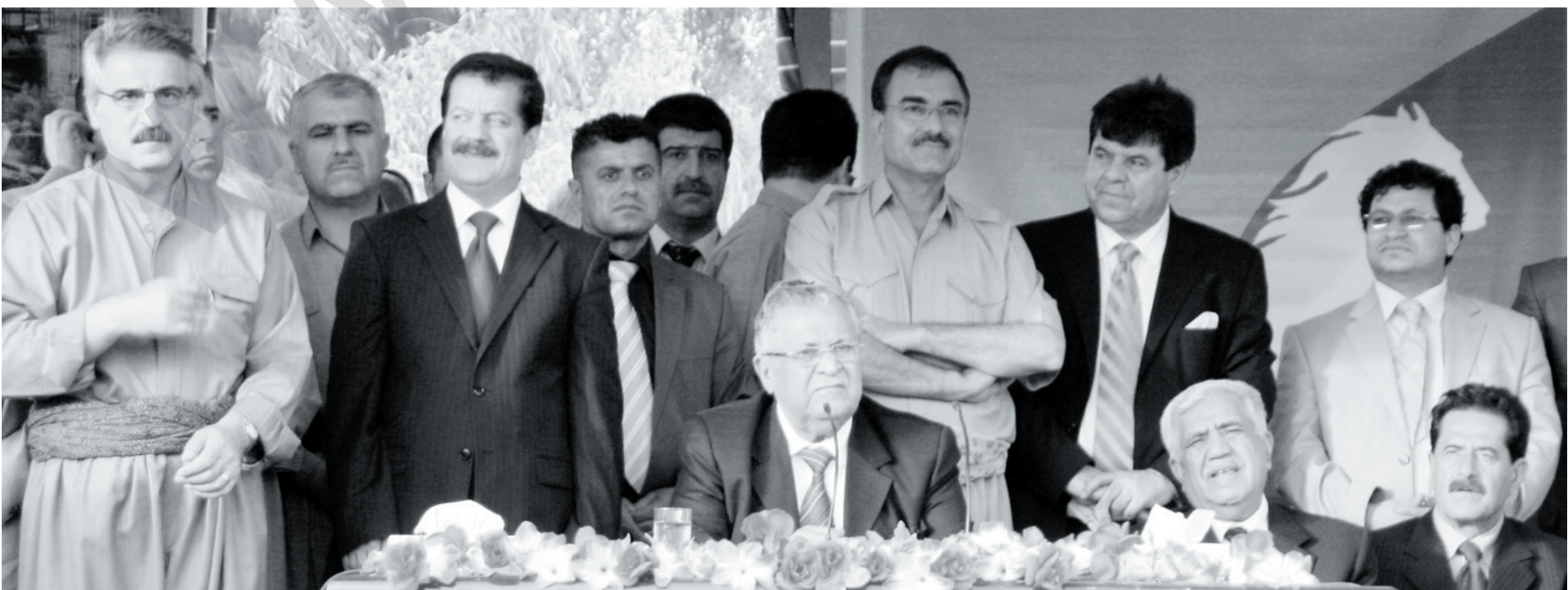
خه لکی گهر میان چاوه روانی نه نفالکراوه کان بکه ن یان وه لامه که ی تاله بانی