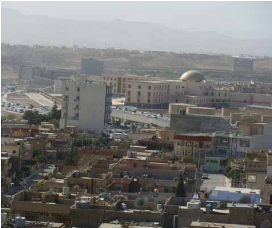
شارتا دیتفرانترده بیته، به لامجیکه ی گه شتیارانیتیدانایته وه

سهر به ستسالله سلیمانی له که می خزمه تگوزاریه پیو بیسته کانده ربوری، به تاییه ت له نه بوونی ئوتیلز قورنیگه ران بوو، وگه شتیاره ئامازه ی به وه کرد "پاشگه رانمانبو زیا تر له ۱۰ میوانخانه له شاری سلیمانی له به رنه بوونی شوینی به تال ناچار بوومیه نامیوق د سستیکی به غدادی خو مبردکه ئیستا له سلیمانی نیشته جیبه." محمه دئامازه ی به وه دا به هوی بیشوینی وه ناچار بووه بؤماوه ی؛ زۆرله مالی هاویری به غدادیه که ی بیئیتیه وه. رائیدسه رداروه حمود لیپر سراوی به شی بازگه کان له به ریوه به رایه تی ئاسایشی سلیمان پیپر اگه یاندینوه ک با زگه کانی سنوری سلیمان ئاسانکاری زۆرمانله زۆرانی جه ژندابق گه شتیارانکر دووه، ۲۴ هزارا رتی گه شتیاریمانبو سه رۆکی ئه وخیزانانه کردوه که به مه به سستی گه شتیاریری روویان له پاریزگای سلیمان کردوه و نزیکه ۸ هزار کردی فه یلی به مه به سستی گه شتیاریری روویان له سلیمان کردوه. رائیدسه رداروتی "زیاتر له ۴۰ هزارگه شتیار روویان له هاوینه هه واره کانیشاری سلیمان کردوه، نزیکه ۱۰۰ هزارگه شتیار روویانله پاریزگای هه ولیر کردوه." سه چاوه یه کله هۆبه ی کاروباری ئوتیله کان