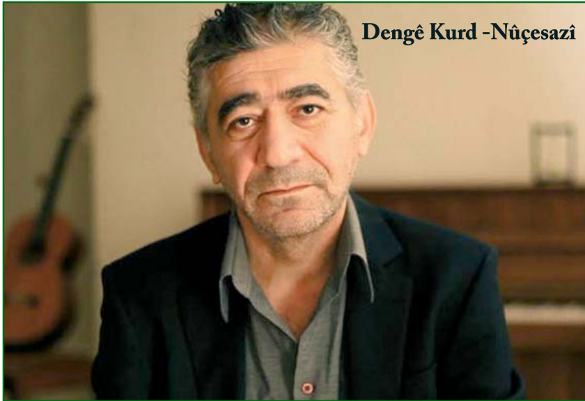
Dengê Kurd -Nûçesazî