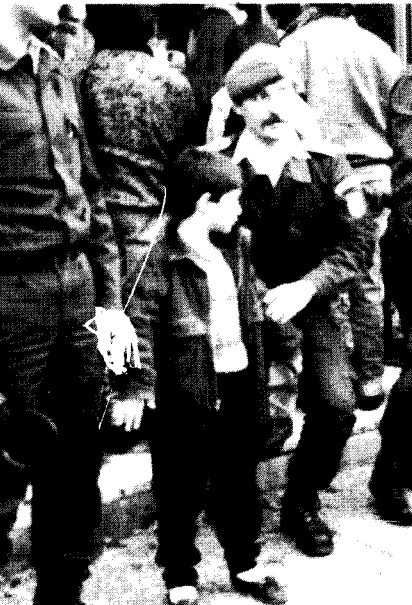
Nürnberg'de polis "terörist"lerden birini ararken...

Newroz, düşmana inat kitlesel, disiplinli ve coşkulu bir şekilde kutlandı. Salonlar Kürdistan Marşı'yla, halaya duran binlerce insanımızın topuk sesleriyle inledi. 2600 yıllık gelenek, şanına yakışır bir şekilde kutlandı.