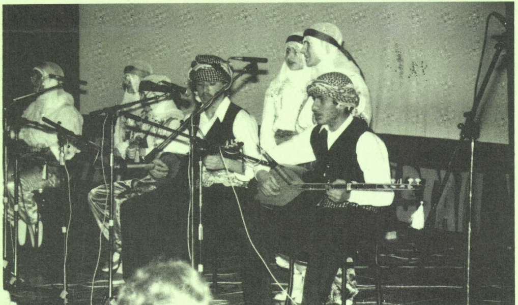
"Koma Kulilkên Kurdistan"

Burkay, Ahmed Arif pêkani bû, ji mêvanan ra xwend. Çawa tê zanin Rahmî Saltuk şopajoyek sînetkarê mezîna Ruhi Su ye. Ew hîm di serê sala 1970 an da dest bi vi kari kiriyê û heta nuha domandiye. Piştî 12 îlonê hukma faşî zînan nedidane wi ku ew konseran bide, her usa pasaport ji nedidan ku derkeve der welat. Vê axiriyê ji çend konserên amadekirî ra hukma Ozal û Ewren zînan nedan û iptal kirin.