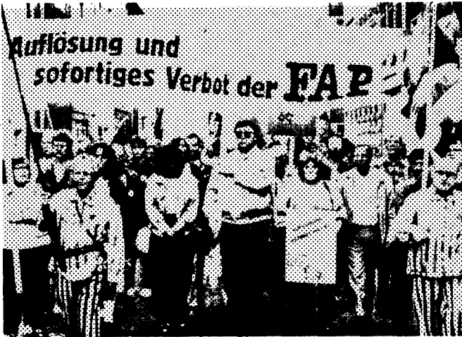
Binlerce kişi FAP'ın kapatılması için yürüdü

Peter Gingold'un dediği gibi: "Faşizmin gelişmesini engellemek, iktidara gelmiş faşizmi alaşağı etmekten daha kolaydır." Bu da ancak tüm anti faşistlerin ve yabancı düşmanlığına karşı olanların birliği ile başarılabilir.