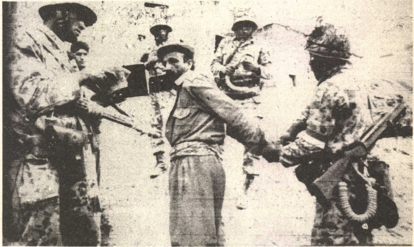
"Vurulmuşum hiç sorgusuz, sualsiz"

Arama yapılan bölgelerde gözaltına alınan herhangi bir ölçütü de yok. Polis ve askeri birlikler, canları kimi istiyorsa onu alıp götürüyorlar. Örneğin: Geçtiğimiz Ekim ayında Lice'nin Şakalat köyünde bir çoban durup du-