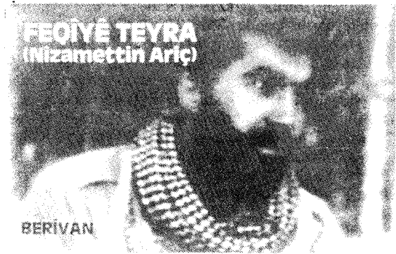
Kaset nu derket !