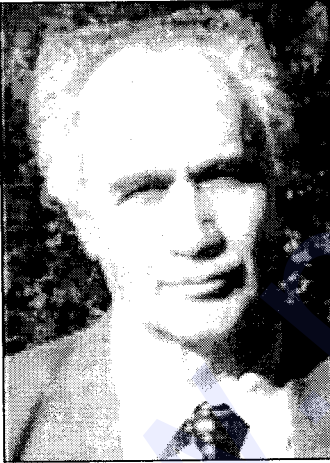
● Kemal Burkay