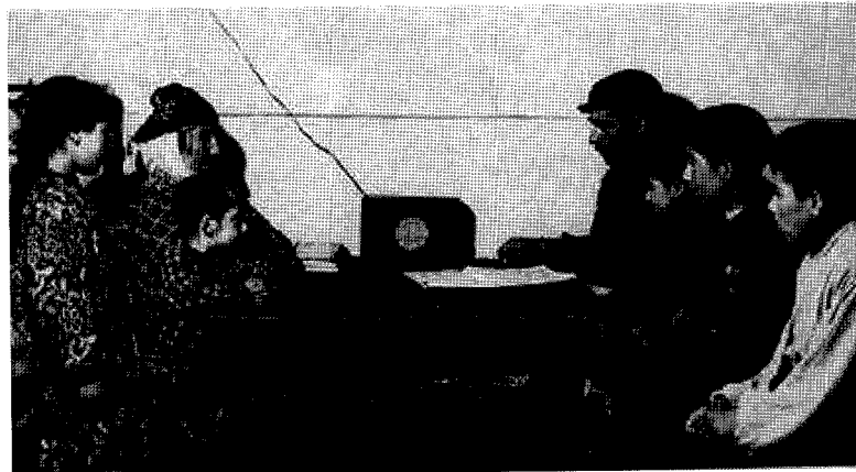
Koerden luisteren naar de eerste uitzendingen in het Koerdisch van Radio Yerevan

Er waren en zijn dus nog altijd vele hindernissen voor de oprichting van een Koerdisch archief en bibliotheek, nationaal of niet. Nochtans werden al vele pogingen ondernomen. Misschien zal het onderzoeksproject van het ADVN, Nationale Bewegingen en Intermediaire Structuren in Europa (NISE) kunnen bijdragen tot het verbeteren van deze situatie. Laat het ons hopen!