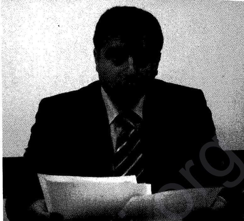
Selahattin Demirtas, BDP-voorzitter

De groep toonde een spandoek waarop geschreven stond “De aanslag op Ahmet Türk was een aanslag op ons volk en onze strijd voor vrede” en riep de slogan