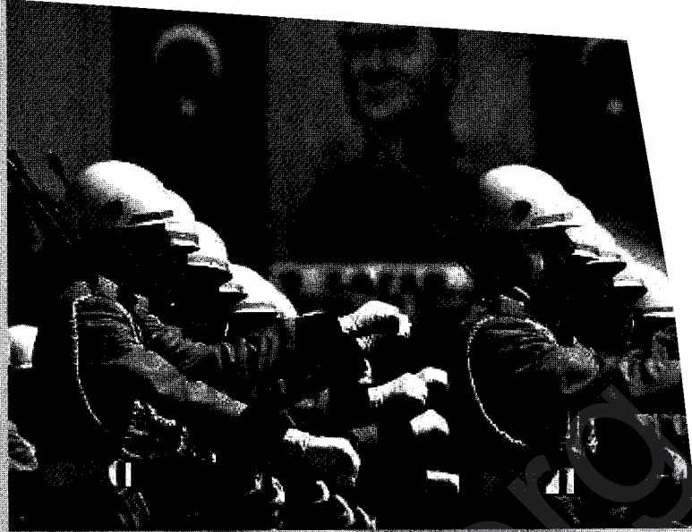
'Turkse leger marcheert voor de Turkse vlag en het beeld van Atatürk.'

Het laatste land om de relaties mee te verbeteren is de ervijand Griekenland. Premier Erdogan bracht er een bezoek aan op 14 en 15 mei, vergezeld van zes ministers en een resem zakenlieden. Het komt het bankroete Griekenland goed uit, want in het kader van de onmin met Turkije gaf het handenvol geld uit aan defensie: het hoogste percentage, nl. 2,8% van zijn