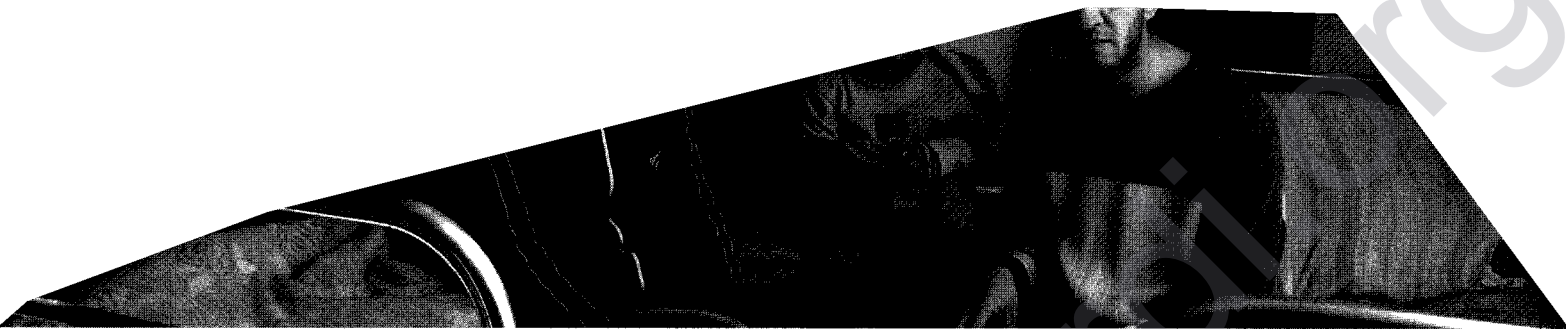
Een Georgisch vluchtelingengezin uit Zuid-Ossetië leeft sinds 1991 in een voormalig hotel in Tbilisi. De vader stierf in het conflict.

“De wortels van de huidige toestand in het zuiden liggen net als voor het noorden in de Sovjet-tijd, waar men de etnische spanningen heel wat erger heeft gemaakt. Maar in tegenstelling tot de noordelijke Kaukasus waar volkeren zich sterk afzetten tegen de Russische overheersing en het verzet dus anti-Russisch is, zien we in de zuidelijke Kaukasus het omgekeerde. Bevolkingsgroepen zoals de Abchazen en de Osseten willen zich aansluiten bij de Russische Federatie en strijden tegen de overheersing van de Georgiërs.”