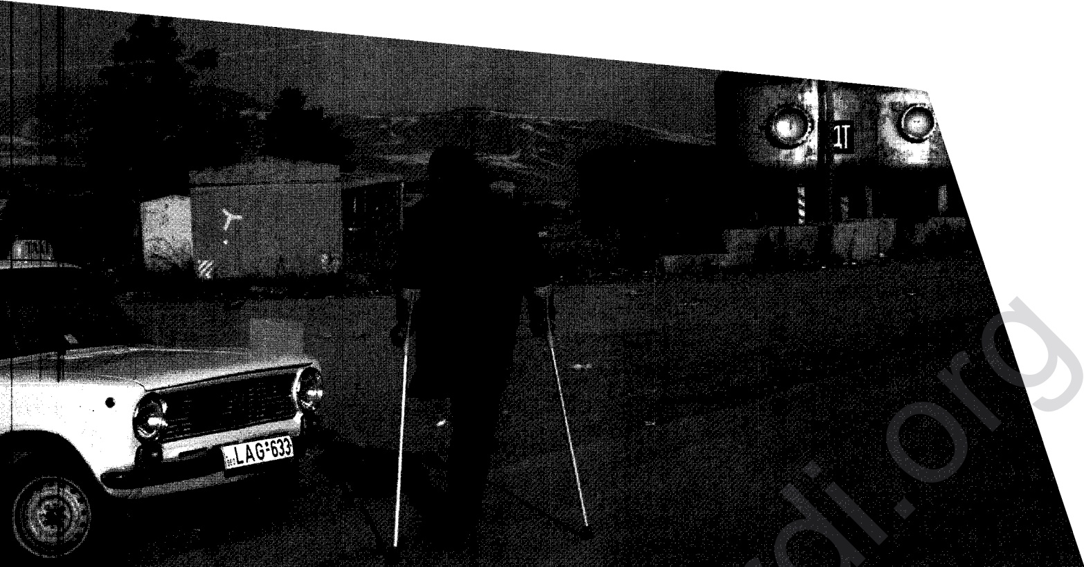
Grensovergang van Georgië naar Zuid-Ossetië in Tskhinvali.

nomische activiteiten uit de regio geworden. Je moet daarbij rekening houden met het feit dat er niet al te veel economische activiteit is in het gebied."