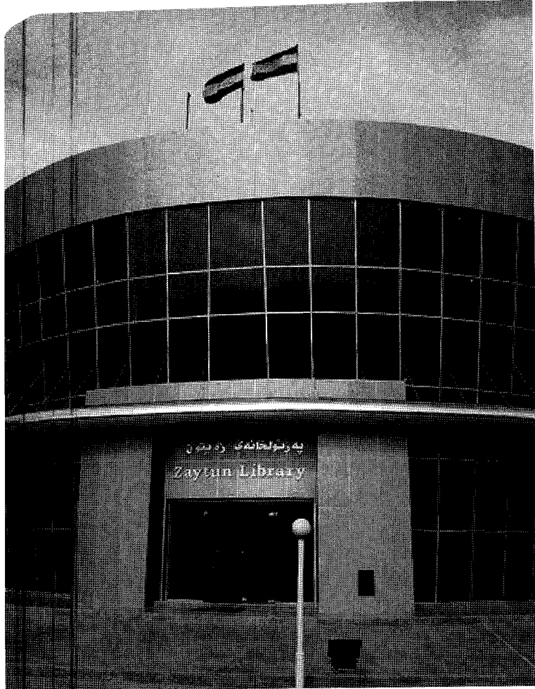
Zaytun Bibliotheek in Erbil, Zuid-Koerdistan.

de as gelegd, en daarmee twintig jaar werk.