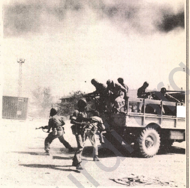
Bu saldırı kime karşıdır?

Eğer olayları bilerek dışarıya satılmışsanız, içinde hiç namuslu insan yokmu? Evet devlet mi kontro-gerilamı?