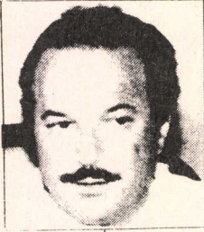
Olağanüstü Hal Bölge Valisi Necati Çetinkaya

Kürdistan'da olayların ilerlemesiyle TC de iki büyük şey değişti. İşlenen cürümlerden hükümetin direkt olarak sorumlu tutulmaması için ilk etapta, kürdistan illerine Sinek vali tayin edildi. Ardından olayları işlemek için TİM, ardından Kontr- gerilla vahşet ve çirkef kuruluşları kuruldu. Sinek valinin atanmasıyla işlenen suçlar, hükümetten alınarak valiye yüklendi ve böylece devlet temize çıkarıldı. Yani bir ülkede çifte rejim ve politika izlendi. Kürdistan'a yönelik politika ile TC de fiili bir değişiklik gelişti. Tüm illerde sıkıyönetim kalkmasına rağmen Kürdistan'da daha da şiddetlendi. Sıkıyönetim fayda etmeyince çekirdek bir değişikliğe gidildi. Özalin ifadesiyle "Doğudaki olaylardan dolayı, ordaki insan haklarını askıya alıyoruz". Gerçekten tüm insan hakları askıya alındı.