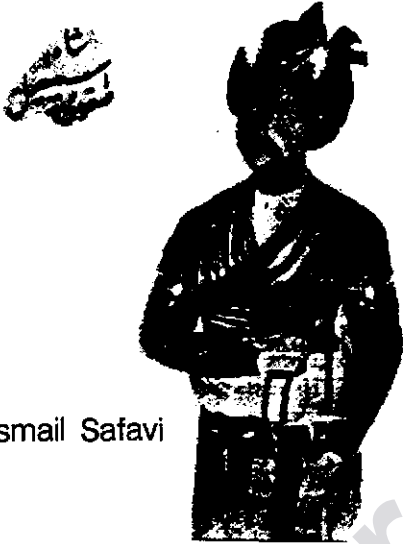
Şah İsmail Safavi

İran'ın durumu da bundan ibarettir. Kendi kolonisi altındaki Kürdleri insan yerine koyup, haklarını vermezken, Türkiye Kürdistan'ına elatarak, kendi kontrolü altında bir hareket oluşturmak istiyor.