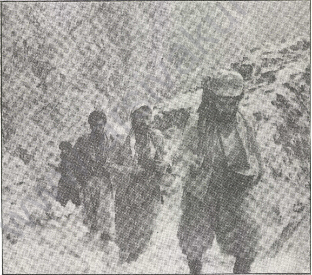
Kürdistan'daki İslami Hareketin Peşmerge'leri