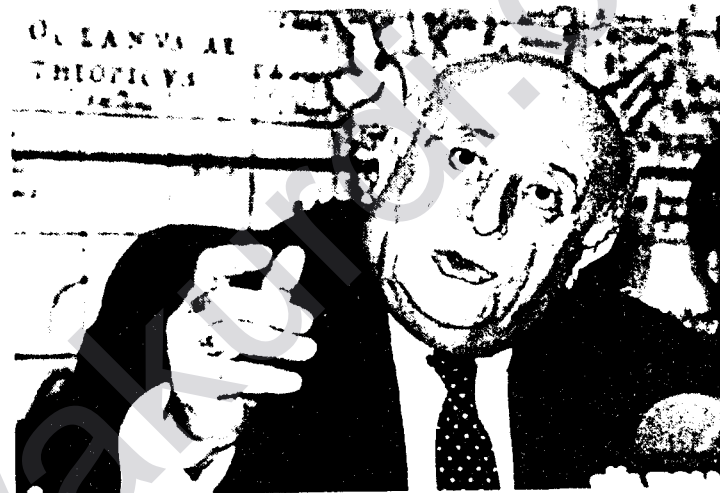
Suleyman Demirel: Turkije wil bij Europa.

In het Westen heeft men altijd een dubbelzinnige houding aan-