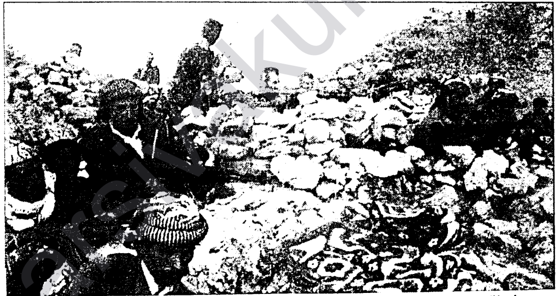
Peshmergas et soldats réguliers de l'armée turque côte à côte, le 23 octobre dernier, dans la vallée de Harkouk, au Kurdistan irakien.