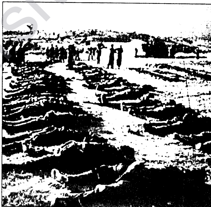
Les accrochages entre armée turque et PKK sont sanglants, comme le montrent ces cadavres de rebelles, le 1 er octobre, à Semdinli.