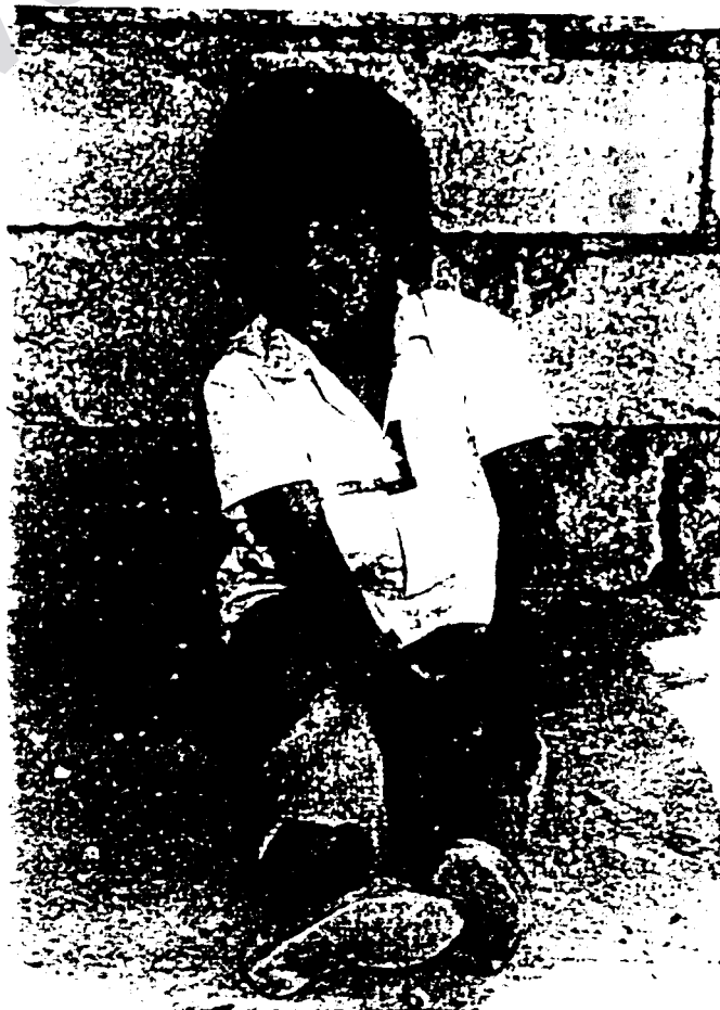
Pour la troisième fois consécutive, beaucoup d'enfants Kurdes irakiens passeront l'hiver sous la tente.

Texte : Sophie GRANDPREZ.