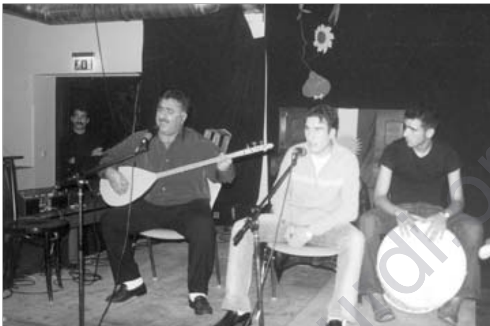
Şahiya li Wuppertalê 2003, Pico û gruba muzikê

dan kurdan. Bi Taybeti Medya û Roj TV em di bernameyen xwe da dan nasin.