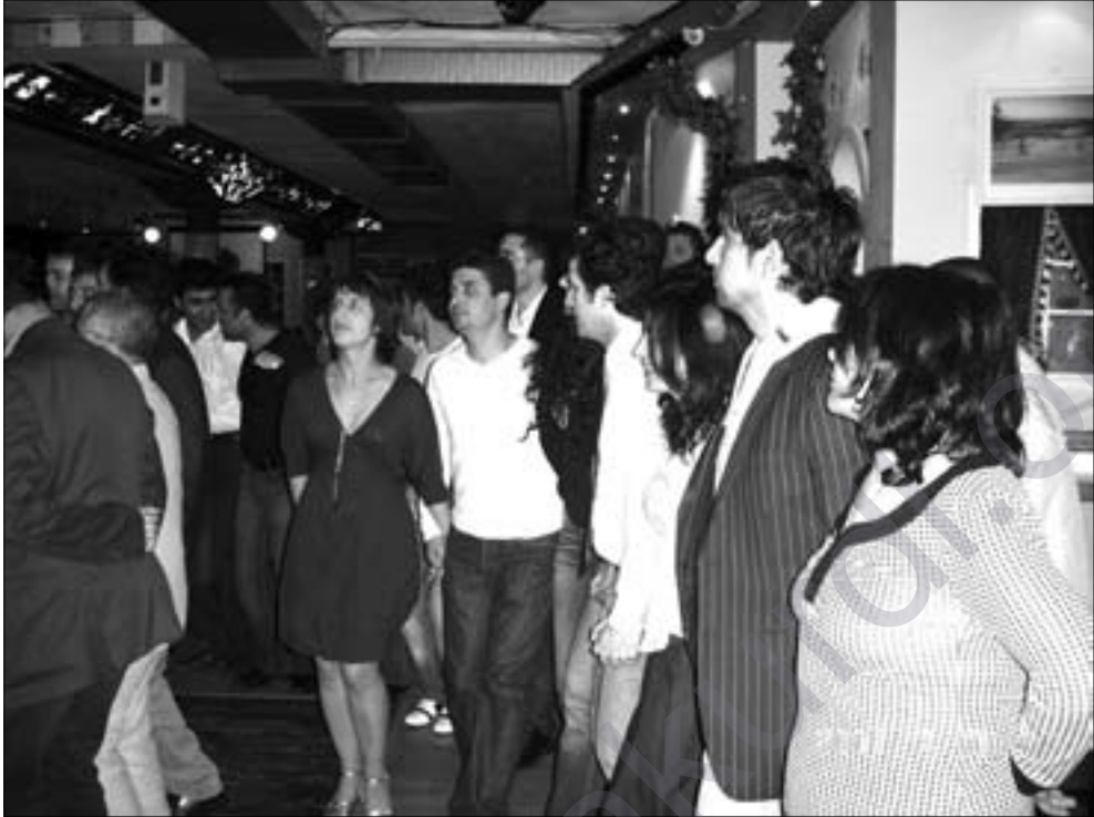
Dimenek ji şahiyê