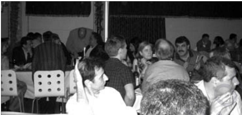
Dîmenek ji şahîya 10-salîya Bîrnebûbê