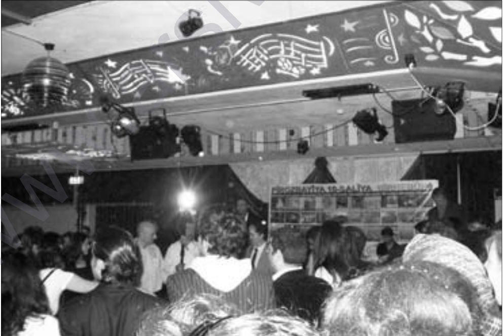
Dîmenek ji şahiya 10-saliya Bîrnebûnê.