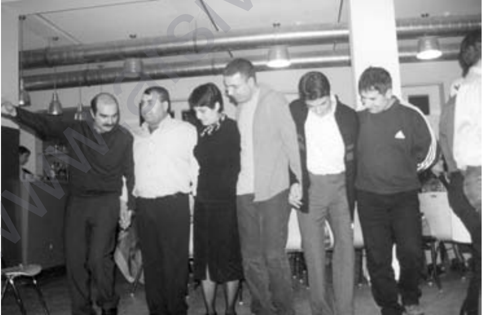
Şahiya li Wuppertalê 2003