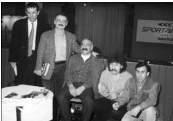
Newroza 1997an li Wupertalê.