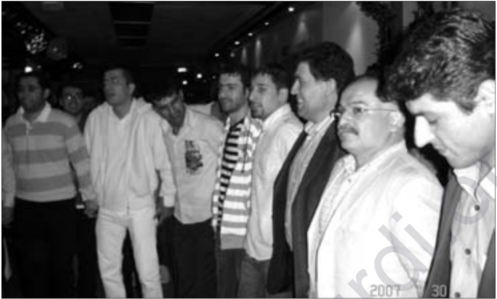
Dîmenek ji şahîya 10-saliya Bîrnebûbê