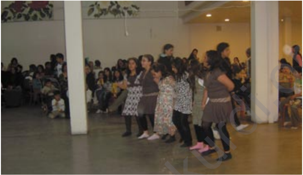
Dîmenek ji şênawiya newroza belediya Botkyrkayê

Li bajarê Stockholmê li belediyeya Botkyrkayê newroza 2007an bi çoşeke mezin hat pîrozkirin.