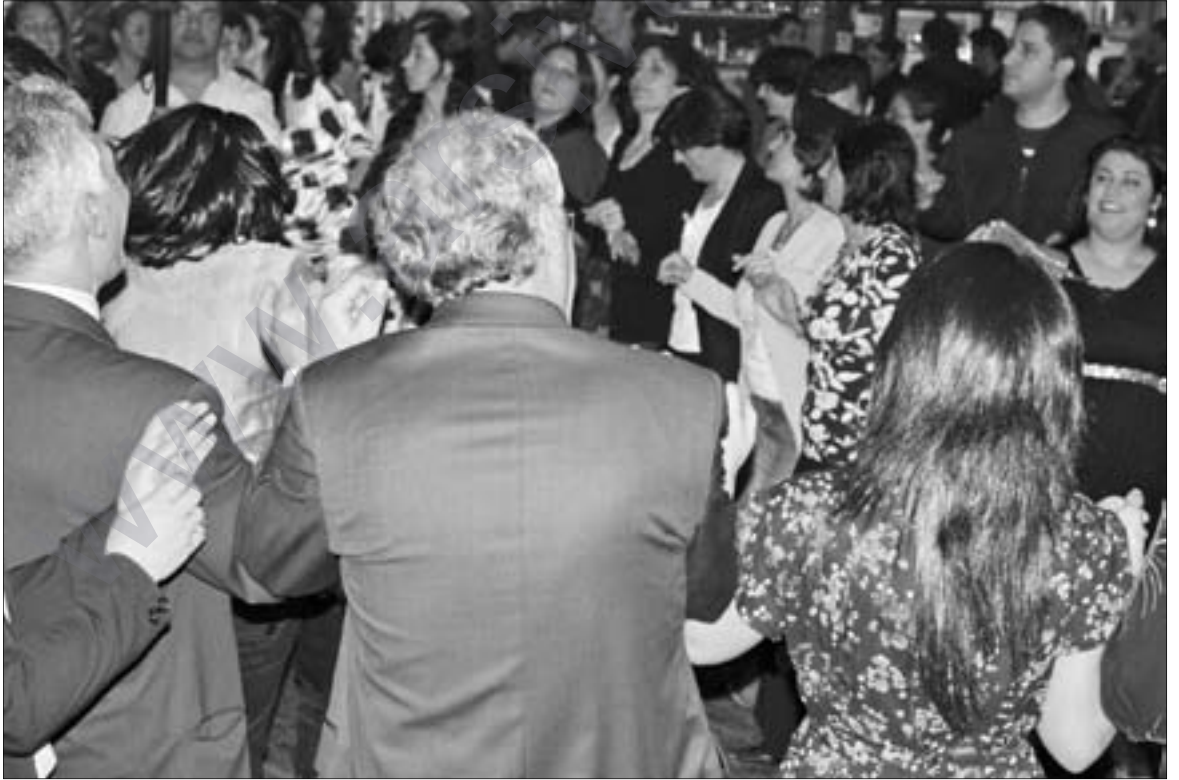
Ji şayiya 10-saliya Birnebûnê, 29 nisan 2007