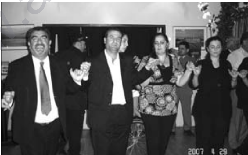
Dîmenek govendê ji şahîya 10-salîya Bîrnebûbê

Bîrnebûn rastiya gelî me ye. Neynêka gelî me ye. Bîrnebûn dîroka „Kurdên Anatoliya Navîn e“. Bîrnebûn di hemêza „Kurdên Anatoliya Navîn“ da ye.