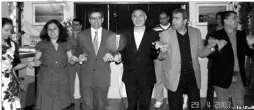
Dîmenek ji şahiya 10-saliya Bîrnebûnê.