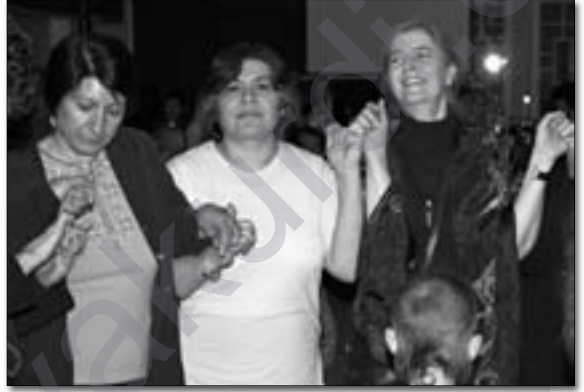
Dîmenek ji şayîya 10-saliya Birnebûnê