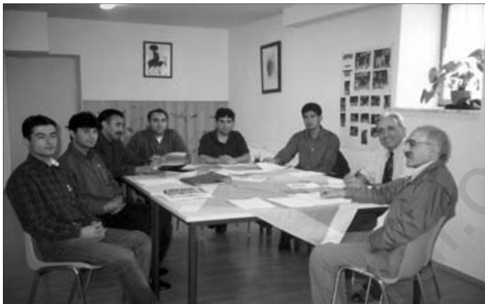
Ji civîna redaksiyon û Komela Ziman, Wetzler 2003