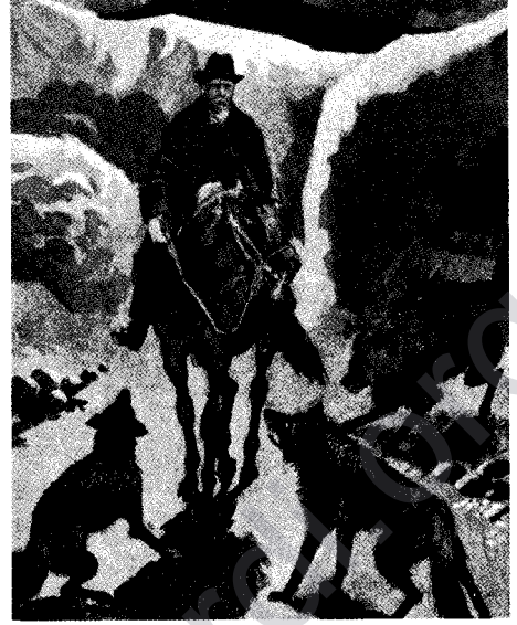
Kürt köpekleri Höijer'e saldırırken

Höijer başka bir yazısında, Ağrı yöresindeki bir Kürt köyünü ziyaret edişini anlatır. İran da olduğu gibi, burada da Höijer Kürt köpeklerinin saldırısına uğrar. Etrafında toplanan halkın " Bunun atı Kürt ,eyerı Kürt, fakat kendisi nedir? " diye kendi kendine konuştuklarını, " Ben İsveçliyim " (Jag är Svensk) dediğimde, onların " Svek, svesk, svmsk " şeklinde bu sözü taklit ettiklerini anlatmaktadır. Höijer bu köyde bulunduğu bir sırada kendi adresini verdiği bir Kürdün, birkaç ay sonra gelip Tiflis'de kendisini ziyaret ettiğini söyler 8 .