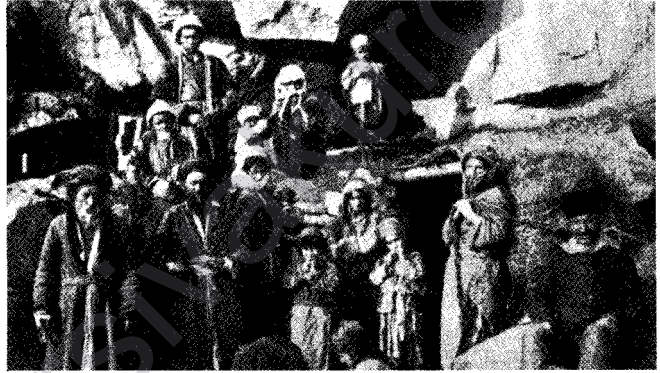
O yıllarda Ağrı yöresindeki Yezidi Kürtler

İsveç Misyon Birliği'nin Kafkasya ve İran 'daki etkinlikleri 1.Dünya Savaşı