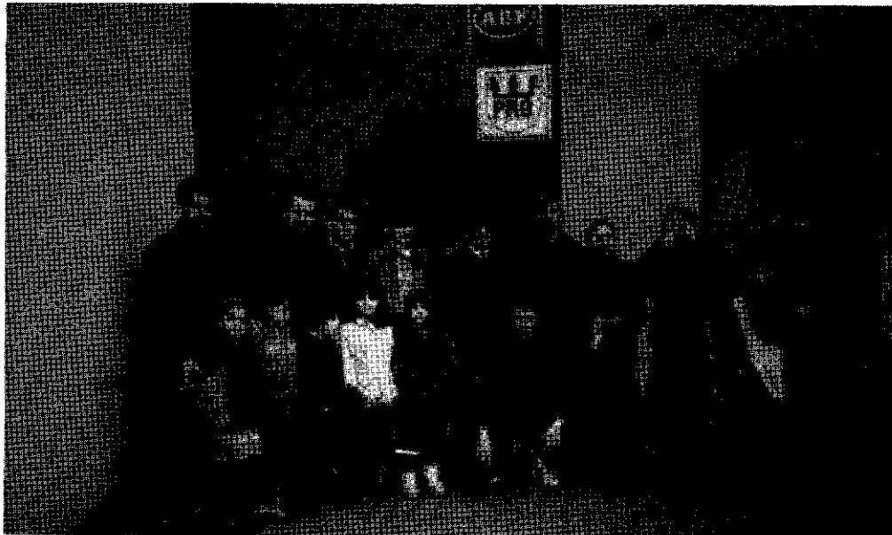
Komela Norrköpingê ji 20 xwendevanên kurd re, bi alîkariya ABF-ê dibistaneke Kurdî vekiriyê

Komeleya Norrköpingê demeke berê bi kurdên rûniştvanên li bajêr re civînek li ser "Problemên zarokên kurd li Başûrê Kurdistanê" pêk anîn û di wî warî de filîmek nişan dan.