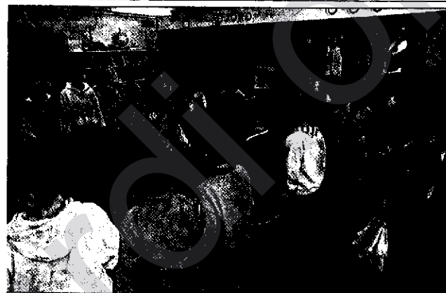
Di vî warî de bi om ett alverson i klass 6 A och 6 B på Kastalidolen i Brumfö hade roligt när dansgruppen "Hälsöbarns Folk" dansade ut kurdisk dans. Att dansa tillsammans är ett av de mer handfasta knopen att lära sig mer om andra kulturer.