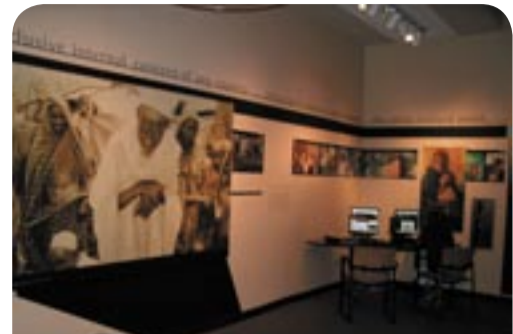
وێنەی دارفۆرریهکان له مۆزه خانەی مۆلۆکۆست