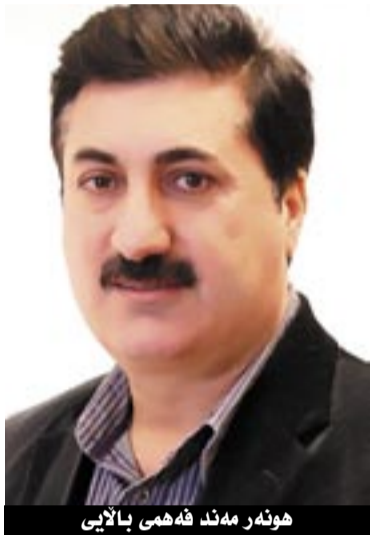
هونەر مەند فەهمی بالایی

ئیتەر بەھیوام هەموو کەناڵە کوردییەکان بگەنە ئەو ئاستە لەخەمی هونەری کوردی و بەرەو پێشبردنی درامای کوردیان.