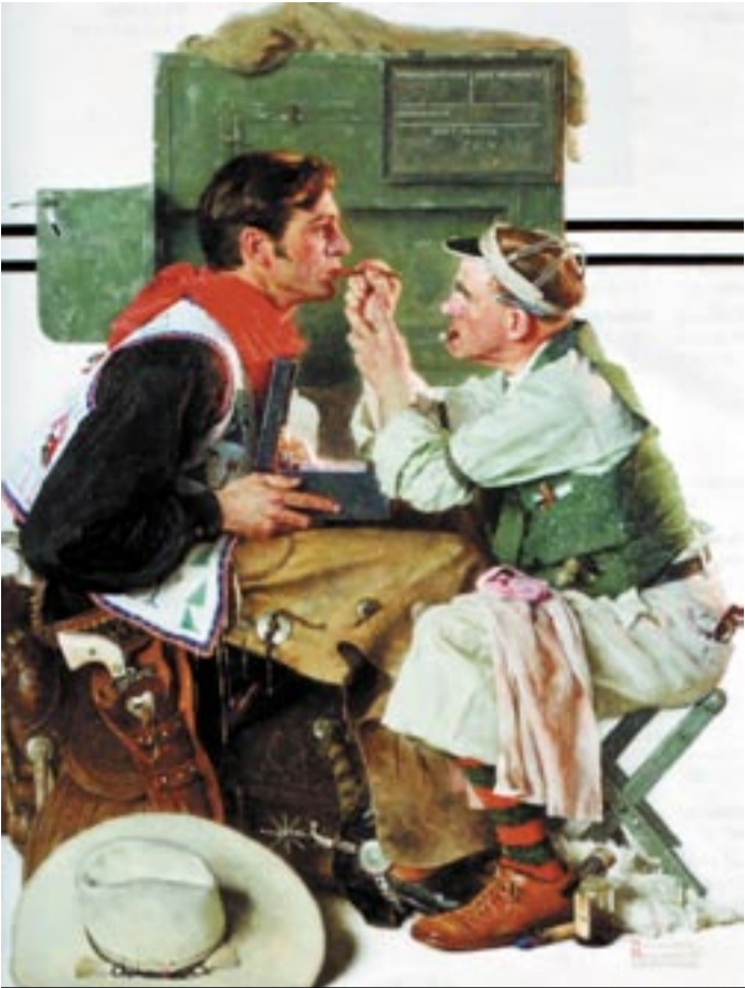
یەكێك له تابلۆ دانسهكانی مۆزهخانهی هونەری نوێی ئەمريکا

بیت، لەویدا بە فیلم و بە تابلۆ و بە ویتە مێژووی عێراق و کوردستانیش هەیە. ئەشکەوتی شانەدەر و گوندی ئالقووش جیگای تایبەتییان لەناو ئەم مۆزهخانهیەدا هەیە و رۆژانە سەدان سەردانیکەران دێنە ناو ئەم مۆزهخانهیە و لەویدا زانیاری سوودبەخش بەخۆرای وەردهگرن.