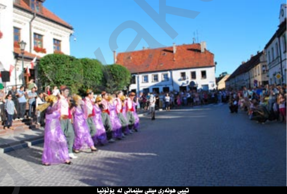
تىپى ھونەرى مىللى سلېمانى لە پۆلۇنيا