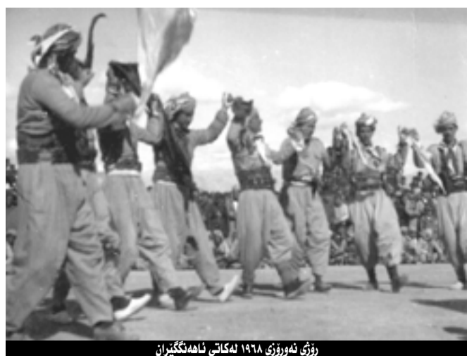
روژی نه‌ورۆزی ۱۹۶۸ له‌کاتی نه‌هه‌نگه‌ران