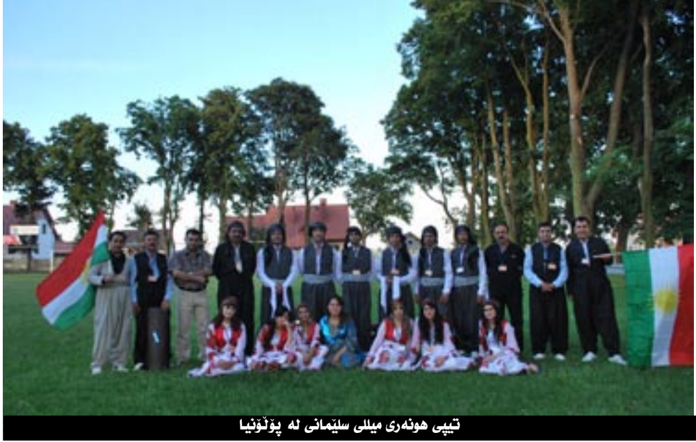
تىپى ھونەرى مىللى سلېمانى لە پۆلۇنيا