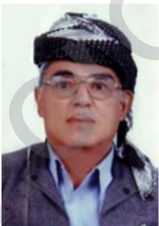
که ریم عوسمان زیندین دیبه گه کی

باسه شه م ده قه ری مه خمور زورکاره ساتی کاولکاری به خوه دیوه به هزی رله شورش گیره کانی، که به شداریان له شورش ئیلوولی مه زن کردوه له چپای قه ره چو به چه ند پیشمه رگه یه که به ژماره ی په نه کان خه و خوراکیان له دوژمن سه رام کردبوو وه که شه هیدان (سایبر سه لته و مه مه د سه لته و هه قانان علی شه ریف لاوه ری و حوسین کادر شامامه ری و شه حمه د مه خمور و مه حمود سه لمان و یاره کانی) هه زاران سلاو له گوزره کانیان. شه م ده قه ره له بهر شه وی کاری پیشمه رگه ی شورشگری تیا کراوه توشی چه ندین په لاماری هیزی دوژمن بوونه له کوده تی ره شی (۸) شویاتی هه رس قهومی (۱۹۶۳) که رژیمی عه بدولکه ریم قاسم روخاو هه رس قهومی ده سالاتی گرته ده ست شاروچکه ی مه خمور که وه بهر شالاری کرتن و تالانکردن و ده ربه ده ری و مال ویرانی و یه که م شالای که دهستی پیکره له ده قه ری مه خمور بوو بویه له سنوری ناوچه که عه ره ب هه لیان کوتایه سه رده قه ره که وه کو درنده به قه رمانی هه رس قهومی شوقینی خویتریژ. که به ده م تالان کرده وه ده هیان گووت (نحن) عرب صاحب غیره نمجی اکراد من الدیره او ده یان گووت (احنا بدو وین عدو....) عربی ناوچه که هه مووی بوونه جاش به ناوی (فرسان الولید) سه روکی گه وره یان له ناوچه که (شیخ حه نیشی تالی) ابو که له گوندی هه ویره داده نیشت هه موو ناوچه که یان تالان کرد به دیبه که شه وه به مه ش نه وه ستان