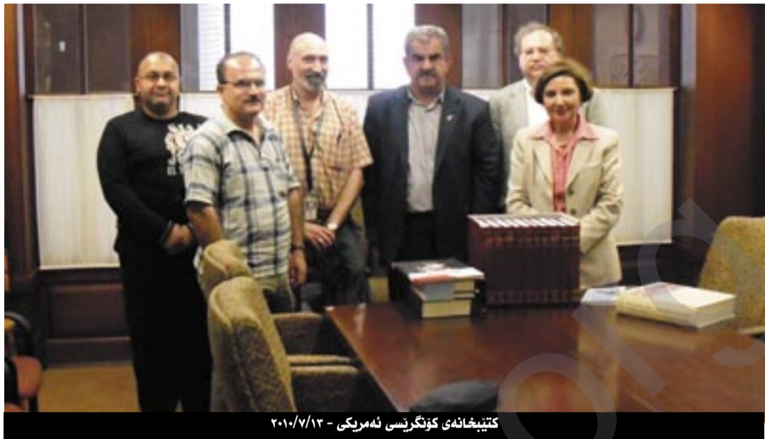
کتیبخانە کۆنگرەسی ئەمريکا - ٢٠١٠/٧/١٣

١,٦ مۆزهخانهی (یادگارەکانی ھۆلۆکۆست) نەتەوێ زولمیکراوەکانی دنیا کە زۆر سەتمەکارانە لەناوبراون بۆ خۆیان لە ئەمريکا مۆزهخانهی بەسەرھاتە جەرگەرەکانی خۆیان بەخۆرای پێشانی گەلانی دنیا دەدەن. لەھەموو میلیلەتانی دنیا چالاکتر بۆ پاراستنی یادووەری و مێژووی پرکارەساتی خۆیان نەتەوێ جوولەکەن. لەم مۆزهخانهیەدا سەدان بەلگەنامە و ویتەبە چۆنیەتی لەناوبردنی جوولەکانی ئەوروپا پارێزراون. ھەر لەویدا چۆنیەتی لەناوبردنی کەمبەکانی یوگوسلاڤیا و رەشپێستەکانی (دارفۆر) بەفیلم و ویتە بە دۆکیومێنت کراون. بەلام ئەوێ لەویدا نەبەینی نەبوونی هیچ شتێک، بەلگەنامە، دۆکیومێنتیک بوو لەبارە (جینۆسایدکردنی) کورد. کاتێک چوو لە لای بەرێوەبەری بەشی میلیلەتانی قەرکراو و لایم پرسی بۆچی هیچ شتێکمان لێرە لەبارە ئەنقالی کوردان نییە، وەلامەکە ئێوەبوو کورد بۆ خۆیان کەمتەرخەمن و هیچیان لەسەر خۆیان لەبارە یەو ئەمادە نەکردووە ئەگینا ئێمە هیچ