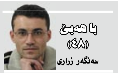
پاشا سەرۆهری (٤٨) سەنگەر زاری