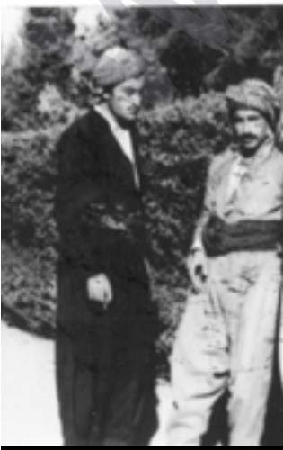
مه حمه د سه لمان و شاه و نه کانی - شورش نه لیلول ۱۹۶۱

به رپر سیه تی نه ته وایه تی وه جو شی کوردا یه تی و دور ته مه شاکردنی جموچولی نه یارانی کورد له ناوچه که که هه رچواره دوری داوه. له بهر شه وی ده قه ری مه خمور ژماره به کی زور بی ری نه وتی هه تی هه یه زهوی که ش به پیت و به ره که وه و ناهه زانمان چواریان لینیه تی بویه نابی به هه نده رنه گه ری و به چولی و به م شیوه به رچاوه بگوزانه وه هه ولیر. هه رکه سه بو بانعی خوی خه لکی ده قه ری مخمور شایسته تی شه ون کارناسانیان بو بکری نه ک شه هات وچونه ی ده قه ری (مه خمور) پاش شاهدان کردنه وهی گونده کان و دابین کردنی پنویسته کانی خزمه ت گوزاری بو ناوچه که، شه کاته حکومتی هه ریمی کوردستان مافی خویه تی له رینگای پاراستنی ناوچه که و نه ته وایه تی وه به زور خه لکی ده قه ره که بگه ریتیه وه گونده کانیان له ژیر رینماییه کانی ماف په روه ری و ریک و دوست چونکه ناوچه که سنوره له گه ل حکومتی شاهدان فیدرال. به پیچه وانسه شه وی نه گه ریتیه وه شوینی باب و باپیری شه و گونده کی لئی له دایک بووه مافی و هه رگرتنی زهوی کشتوکالی