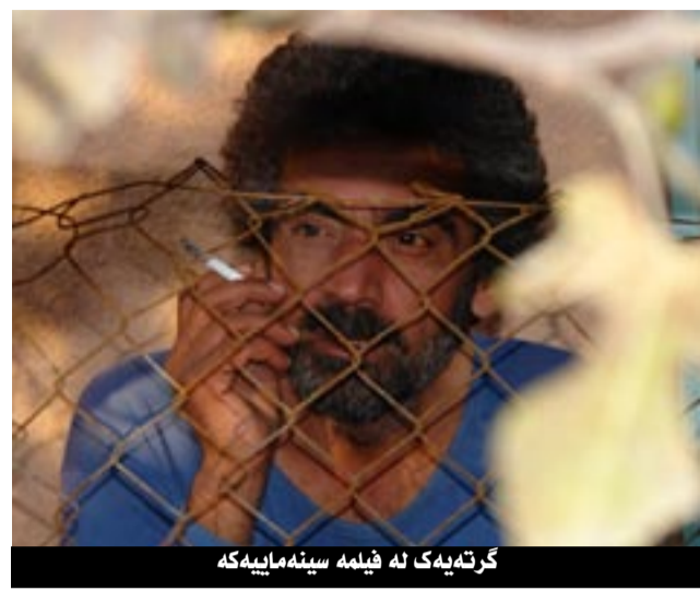
گرتهبەك لە فېلمە سېنەمايەكە

كارەسات لە كرەدەيەكى داھىنە رانەى وەك سېنەما دا تەوزىف بىكات. ئايا رووداوى كېمىابارانى ھەلەبجە چۆن دەكرىتە ماترىيالېكى سەرگەوتوو بۆ سېنەما؟