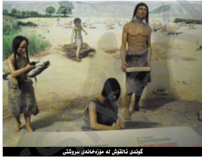
گوندی ئالقووش لە مۆزهخانهی سروشتی

ژن و ھونەری ژن مایەیی باوەخ پێدانی گەلی ئەمريکا، ھەربۆش دەستکەوت و داھێنانەکانی ژان بەدریژی مێژوو و ھەموو نەتەوکان لە مۆزهخانهی کەدەبەخۆرای پێشانی ھونەر دۆستانی دنیا دەدریت. لەویدا سەدان بەرھەمی جۆراو جۆری شیوھەکاری، سیرامیکی، پیکەرسازی