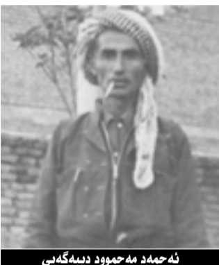
مه حمه د مه خمور دینه گه کی

نه بن، زهوی بدری به جو ویتاریه ده چیتوه گونده کی، سه ت حه یف ومخابن دلم نایه شه بلیم نه گه ده قه ری مه خمور هه روا به م شیوه به به چولی بمینتیه وه و خزمه ت گوزاری بو نه چی و گونده کان شاهدان نه بنه وه خه لکه که ش هه رله هاتوچوی رینگای مه خمور بی بزه نانی به شه خوراکي بائیی پاش دوو سالی دیکه ده قه ره که که سی تیا نامیتنی و به ره و شاره کان هه لده کشین (من خه لکی ناوچه که م هه ست و هه لویست و ناره زوی خه لکه که واده گه ینی. بویه له رینگای