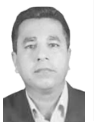
شاخه وان عه لی حه ده د

نه و رۆژه ی ته له فۆنیان بۆ کردم، ده ستم گه رابوو، له سه ر ئیش بووم خه ریکی به سه ر خستن و کیشانه وه ی بلۆک بووم بۆ سه ربانی مالیکی ده وله مه ند. ته له فۆنه که له لایه ن که سه یکی نامۆوه کرا، یه که م جارم بوو گویم له ده نگیکی و ابیت، سه ره تا قسه کانی