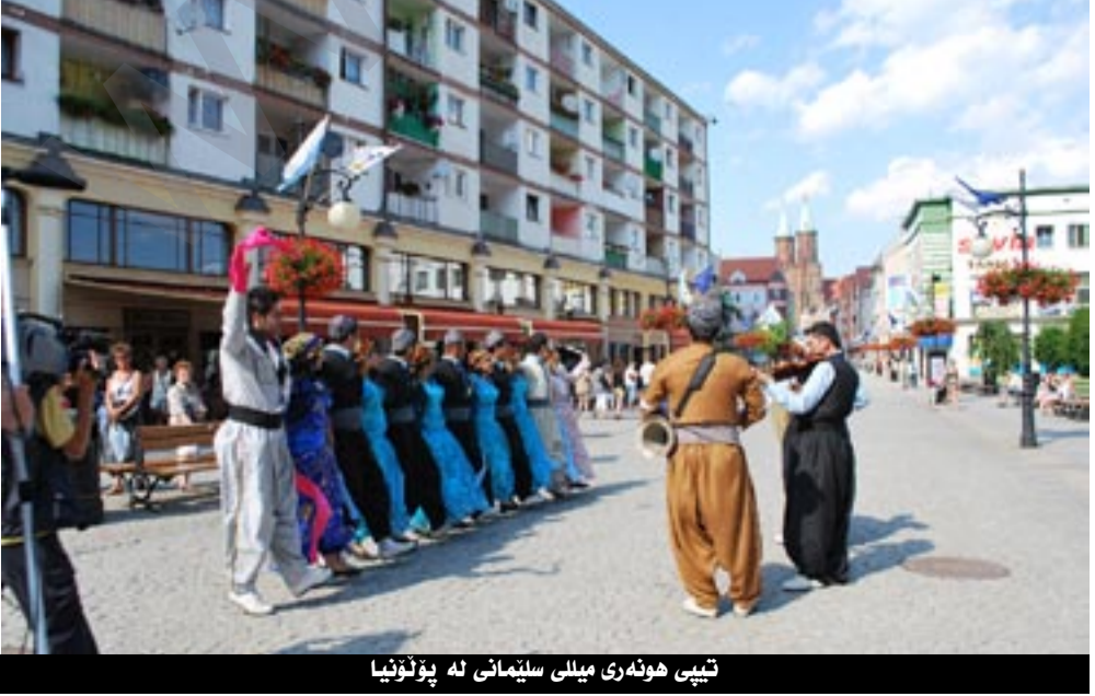
تىپى ھونەرى مىللى سلېمانى لە پۆلۇنيا

نمايشى سەرشەقامەكان لەكاتى رېپىوانەكاندا لە ئامادەكردىن و راھىنانى (عەبدولعەزىز مەجىد) و ئامادەكردىنى موزىكى (سەلاخ ھەمەعەزىز) شىوازى پرۆگرامەكە بە سى جۆر بوو: ۱/ رېپىوان و نمايش كردن لەناو شەقام و بەناو خەلكىدا ۲/ لەسەر شانۆ لە شارە گەورەكان ۳/ لەگۆرەپان و گوندو فەرمانگەى وەك خەلوھەتگەى