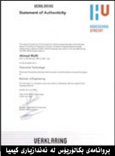
بروانامه ی بکالۆریۆس له ئه ندازیاری کیمیا

سه ته لایته و ئۆتۆمبیل په یدا بووه ئاوا وه ستای وزه ی خۆر په یدا بی، چونکه هه ره ئه وه نده بازاره که ی گه رم و بی و بلا و ده بیته وه، ئه و کاته خه لک هه موویان چاوی لیده کن.