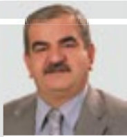
حه مید به درخان

* ده رچوو ی به شی را گه یاندنی په یما تگای ته کنیکی هه ولیز ۲۰۰۹-۲۰۱۰* دیاره قه ده ری ئەم دوو عاشقه به یه که یه شتو وه نا خوشی بووه، ئه گه رچی خوشی گه وره ی ئه وان به یه که یه شتو وه نا خوشی بووه، وه لی نا خوشی و چه ره سه ری به کانی ژیا ن نه یه یشتو وه ئه وان به سه رفرازی بۆ ین: کاتیک له نیا ته مهنی بووه ه سا ل سا را مندا لکی دیکه ی بوو، وه ک ئه وه ی خوا قه ت خوشی به نسیمی سو زان و سا را نه کردین پاش ئه یه ی مندا له که ی بوو دکتور پنی گو تین ده توان مندا له که بی نه وه، به لام سا را ده بی به یینته وه حا لی زور خراپ بوو، دکتور پنی گو تین نه ده بوو مندا لی بو وایه چونکه