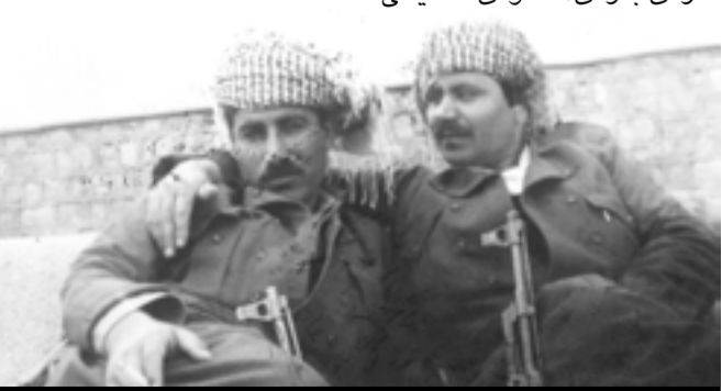
له چه یوه مه حمود سه لمان و سایبر کادیر

شه وی شایانی باسه که هیزی پیشمه رگه ی کوردستان په لاماری عه ره بی (شیخ عواس) شه دا حکومه تی عه بدولسه لام عارف