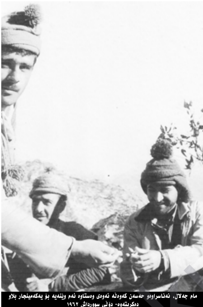
مام جه‌لال، نه‌ناسراوه‌و حه‌سه‌ن که‌وه‌ته نه‌وی وه‌ستاره‌و نه‌م وینه‌یه بو یه‌که‌مینه‌چار بلاو ددگریته‌وه- دۆنی سوورداش ۱۹۶۲