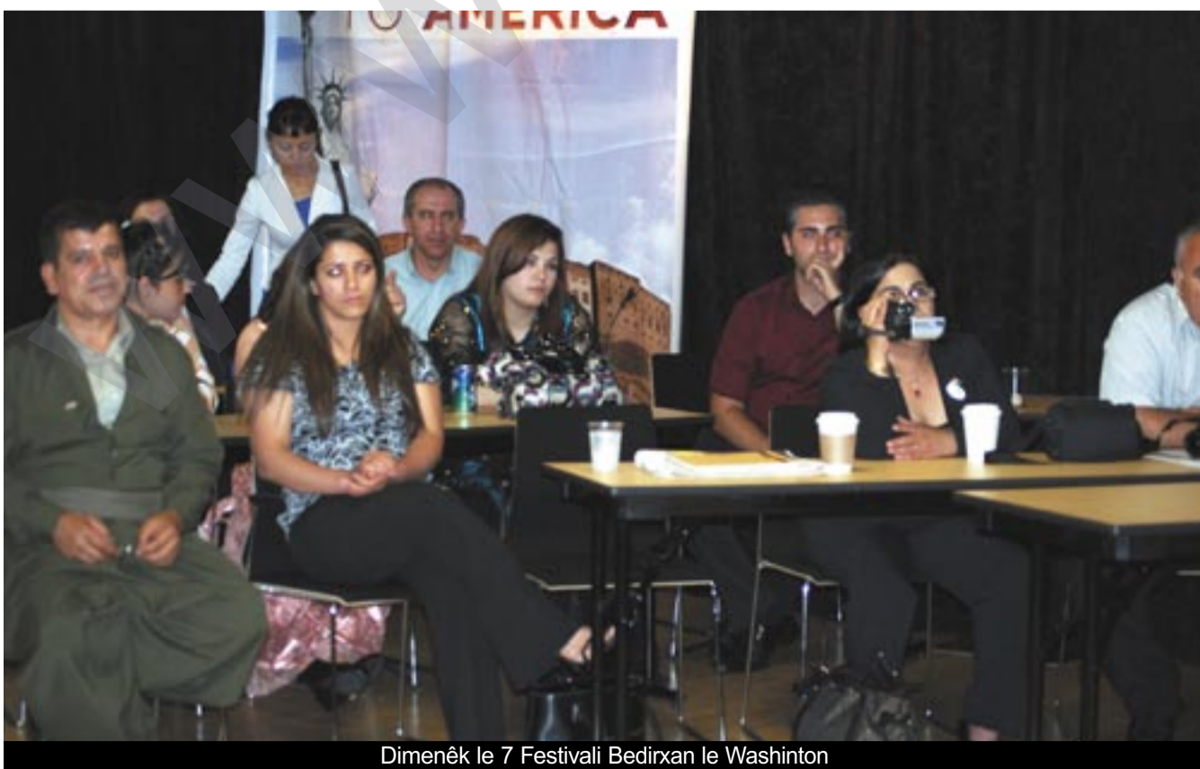
Dimenêk le 7 Festivali Bedirxan le Washinton

Di dema amadekirina ve nûçeyê de festîwal berdeyam dikir û ji bo vê yekê jî emê nûçeya berdeyamîya festîwalê di demeke pêşde dîsa belav bikin.