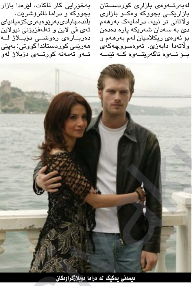
دەينى يەكێك لە دراما دۆبلاژكراوكان

گەليك زۆرە، بەلام لەھەمانكاتيشدا دۆبلاژيشى ھەيە، ئەمە ئاسايە لەپيتاؤ گۆرپنەوى فرھەنگ و دروستکردنى پەيوەندى ھونەرى لەنيوان ولاتان. دەربارەى ئەو بەرھەمانەى كەلەكاتى دۆبلاژ كردندا تىكستەكەيان دەگۆردى و مانا ئەسليەكەى خۆيان لەدەست دەدەن، ھېرش گوتى: ئەمانە جۆريكن لە بى ئىنساڤى شىواندى ھونەرى راگەياندى، بەلام دەربارەى كەنالهكەى ئيمە ھىچ جۆرە كارىكى لەم شىوھە نىيە، چونكە ئەو ئىشى ئيمە نىيە وەكو دەنگايەكى رۆشنىرى جىباي دەكەينەوھ لەو ستۆديۆيانەى كە لەمالان و بازاردا ھەيە، ئيمە وەكو كەناليك رەنگە لەكاتى پەخشكردنى فيلمىك يان بەرھەمىك بەسەدان خەلك و خىزان بەديارىيەوھ دانىشى، ئيمە دەبى رەچاوى جەماوهر بکەين ناكرىت شتەكان بەشارەزووى خۆمان دەستكارى بکەين. بەو جۆرەى وەرى دەگرين بەم جۆرە بلاوى دەكەينەوھ .