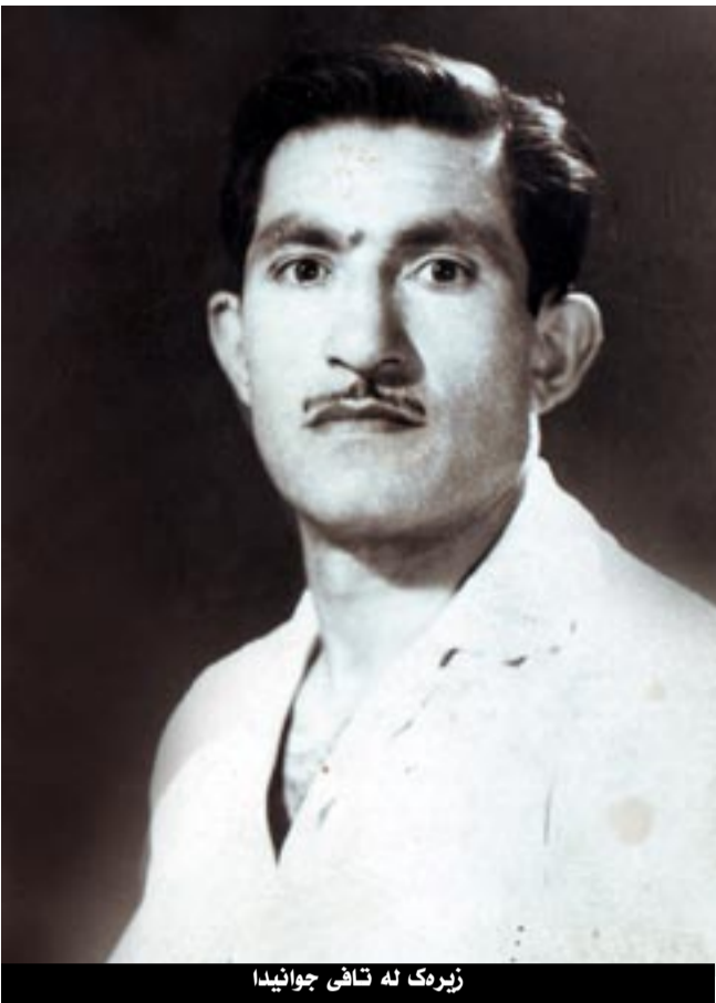
زيرك له قاضي جوانيدا

“هونەر” هکله خوی نانسین، تا ټو روژدهی بهلیکولینهوهی زانستی تال بیه کانی ژبانی زيرک نه چیر تال بیه کانی ژبانی زيرک نه چیر یمن و ههست پین نه کین، تا ټو روژدهی بهلیکولینهوهی زانستی جوانیبه کانی هونری زيرک، وک هونره که خوی ههست پین نه کین و نه ناسین. بهلی: ټو روژه تیده کین، زيرک چ هونرمه ندیک بهلی: جیهانی. هونری زيرک له کاتسی خویدا بیگات، “سال” و “سهده” به سهردا دهچی، ټو هوش هممو پیاوه دلسوزو لپهاتووه کانی کورد ههستیان پیکردوه و له وهختی خویدا ده ریانبریوه، ههرا له “ههده” خانی ټهوه، تا دهگاتر “ههسن زيرک” ټهگه خانی زیاتر له چوارسهده سال پیش ټهمرؤ دهفرمووی: