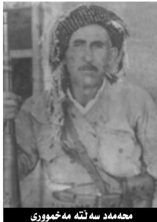
مه حمه د سه نته مه خموری

رژمی ره شی ده سالاتی هه رس قهومی یه که م هه نگاری به عس شه بووه که وه ته په لاماری ناوچه که و به عس کردنیان و گرتنیان و ده ره به رکرده تیان له ناوچه که . که شه ری ئیزان - عیراق کوتای هات له ۱۹۸۸/۸ حزبی به عسی فاشست دهستی کرد به تیکدانی گونده کانی ده قه ری قه زای مه خمور و دیبه که ش گوزاریه وه ناحیه ی خه بات (که له ک) تاکو روخانی رژیمی سه دام له ۲۰۰۳/۴/۹ خه لکی دیبه که شه وی خانوی نه رووخابو که رایه وه دیبه که شه شه وی خانوی روخابو چاوه روانی قه ره بو و ده کات و ماده ی "۱۴۰" جی به جی ده کری و ناوچه دابراوه کانی کوردستان بگه ریتیه وه سه ر کوردستان سنوری کوردستان دیار بکری شه ناهنده پره له بی ری نه وت، شه وی جیگای داخه خه لکی ده قه ری مه خمور په سوله ی خوراکیان