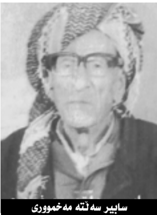
سایبر سه نته مه خموری

نه بن، زهوی بدری به جو ویتاریه ده چیتوه گونده کی، سه ت حه یف ومخابن دلم نایه شه بلیم نه گه ده قه ری مه خمور هه روا به م شیوه به به چولی بمینتیه وه و خزمه ت گوزاری بو نه چی و گونده کان شاهدان نه بنه وه خه لکه که ش هه رله هاتوچوی رینگای مه خمور بی بزه نانی به شه خوراکي بائیی پاش دوو سالی دیکه ده قه ره که که سی تیا نامیتنی و به ره و شاره کان هه لده کشین (من خه لکی ناوچه که م هه ست و هه لویست و ناره زوی خه لکه که واده گه ینی. بویه له رینگای