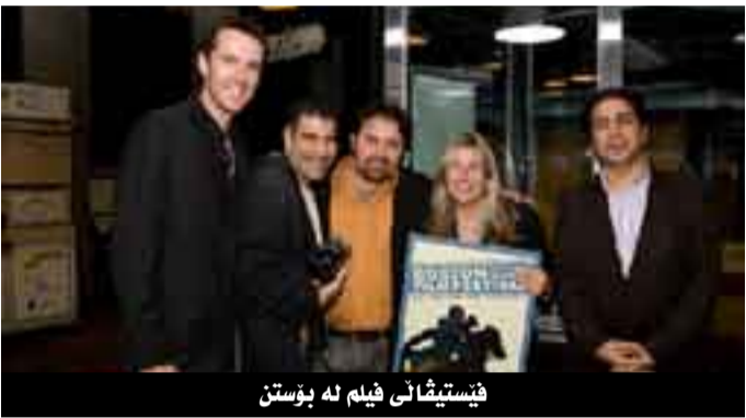
فیستیڤالی فیلم لە بوستن