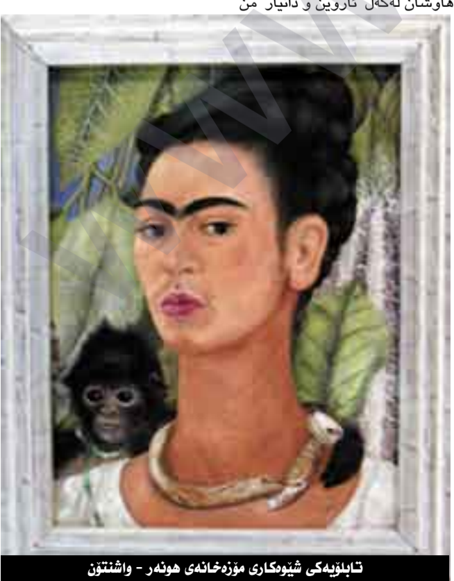
تابلویه کی شیهوکاری موزه خانه ی هونهر - واشنتون