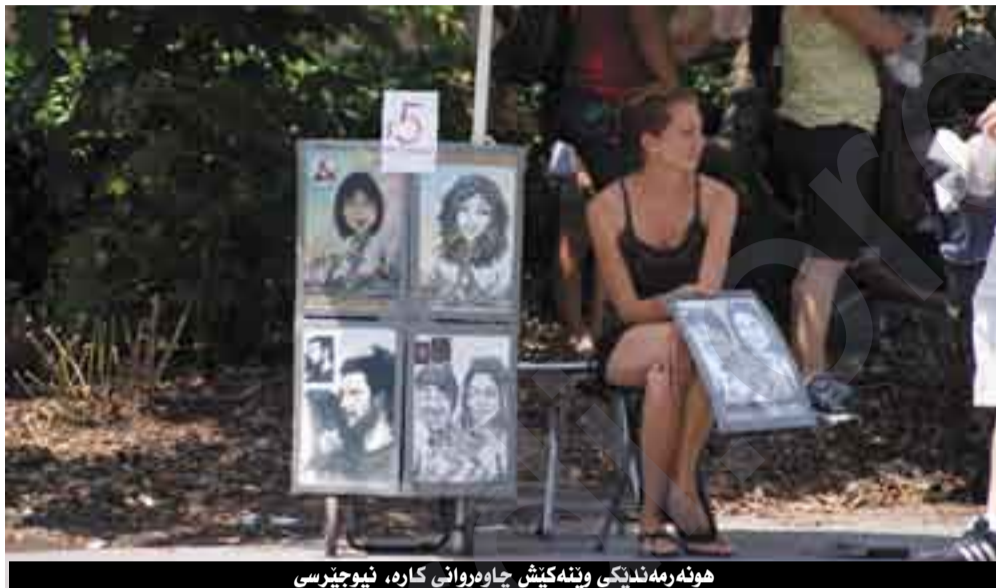
هونهرمه ندیک وینه کیش چاوه روانی کاره، نیوجیرسی