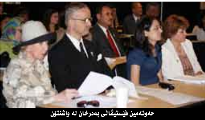
هەوتەمین فیستیڤالی بەدرخان لە واشنتون