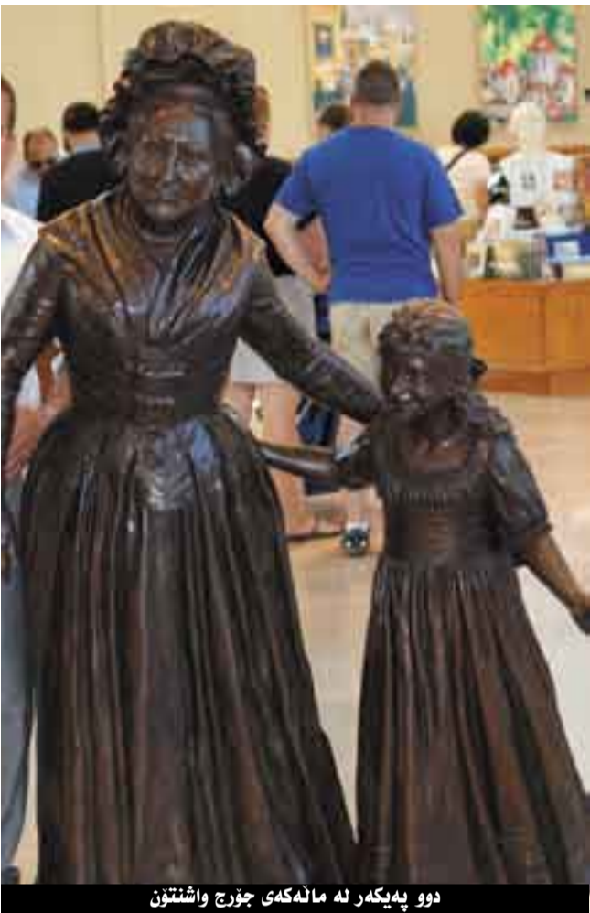
دوو په یکه ر له ماله که ی جورج واشنتون