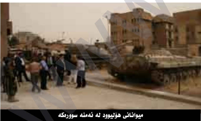
میوانانی هۆلیوود لە ئەمنە سوورەکە