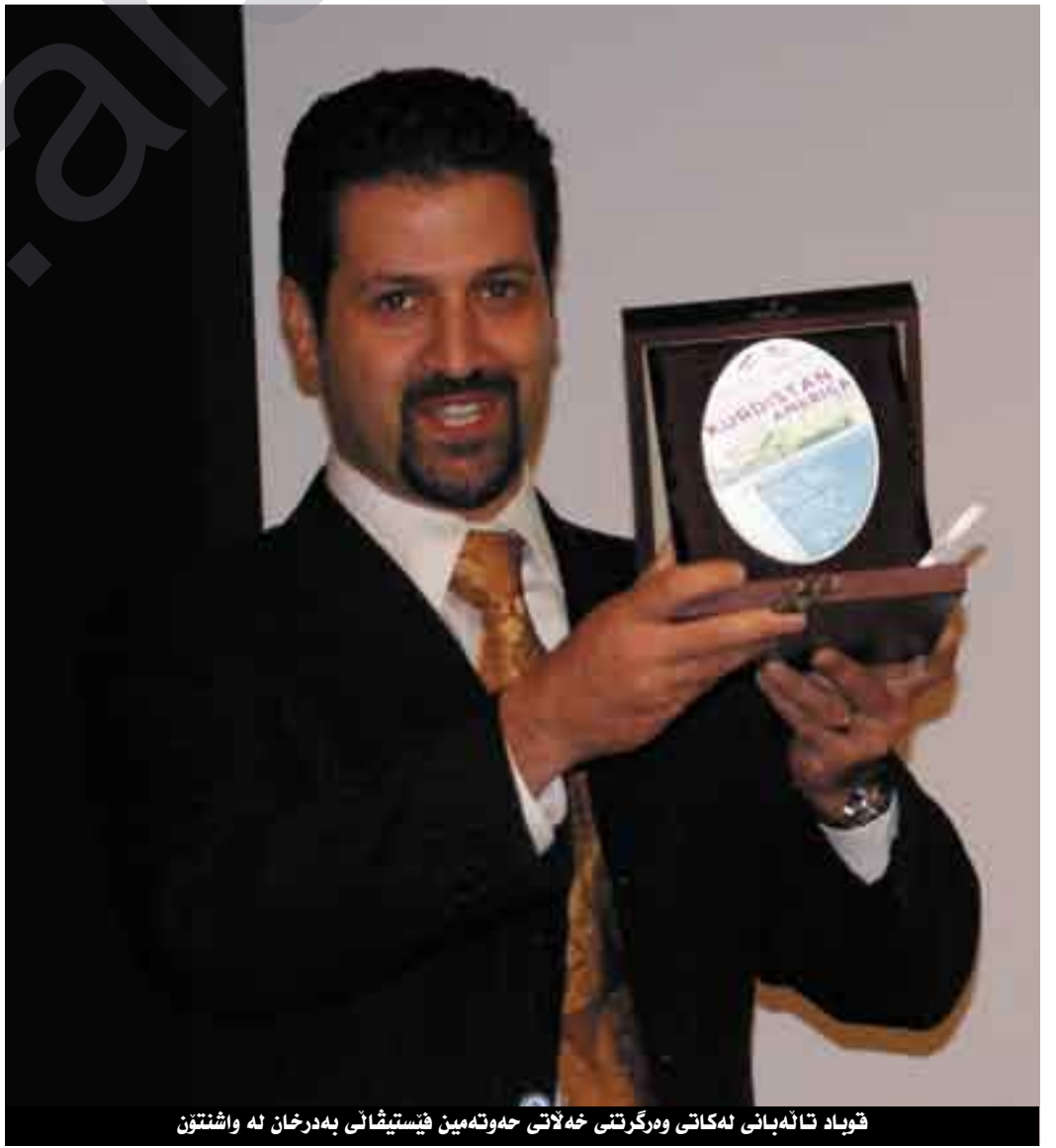
قوباد تاله بانی له کاتی وه رگرتنی خه لاتی حه وته مین فینستیقالی به درخان له واشنتۆن

به تابه ت له بواری سیاسیه وه له گه ل کۆمه لگای سیاسی هه مریکا تاراده یه ک تیگه بپشتوون به حوکمی جهنگی رزگارکردنی عیراق و بوونی چه ندین سه له ی نوینه رایه تی حکومتی هه ریم، یانی ده توانم بلیم تیگه بپشتنیک ی زۆر باشتر هه یه له سه ر باروؤخی کورده ستان. به لام ئایا تیگه بپشتن هه یه له سه ر ریکای چاره سه رکردنی کیشه کانی عیراق یان کورده ستان، رهنگه له ریکایه وه ده رفه تیگ هه بی بۆ ئه و جۆزه ناساندن و کۆکردنه وه ی بیه ر بۆ جۆنه کان.