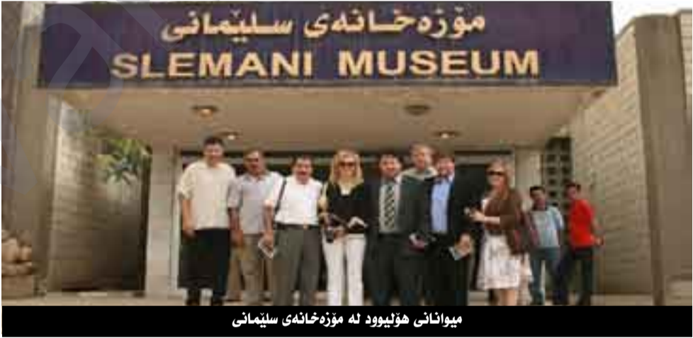
میوانانی هۆلیوود لە مۆزەخانەئێ سلیمانی

لەوهەتی ئەم بەشەمان کردۆتەوه ئێمە چەندین چالاکیمان هەبوو کە