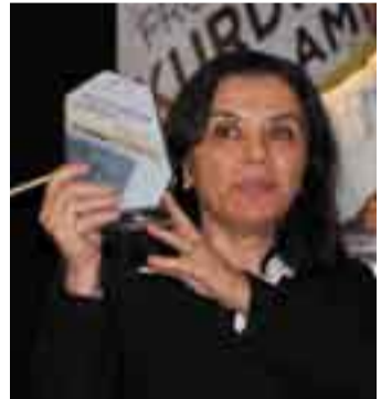
تايه‌به‌ت به‌ بەدرخان

ده‌زگای چاپ و بلاوكرده‌وه‌ی بەدرخان به‌هاو‌كاري به‌شي هونەر و كه‌لتوو‌ری نوينه‌رايه‌تي حكومه‌تي هه‌ريمي كوردستان له‌ واشنتۆن سازكرا، ده‌نگی كوردی رادیوی ئەمریکا وه‌كو به‌شيکی گرنگ له‌ ده‌زگایه‌کی گه‌وره‌ی راگه‌ياندن رۆلێکی په‌كجار گرنگ و به‌رچاويان هه‌بوو له‌ گواسته‌وه‌ی هه‌وال و چالاکیه‌كاني رووداوه‌كاني فيستيفاله‌كه‌.