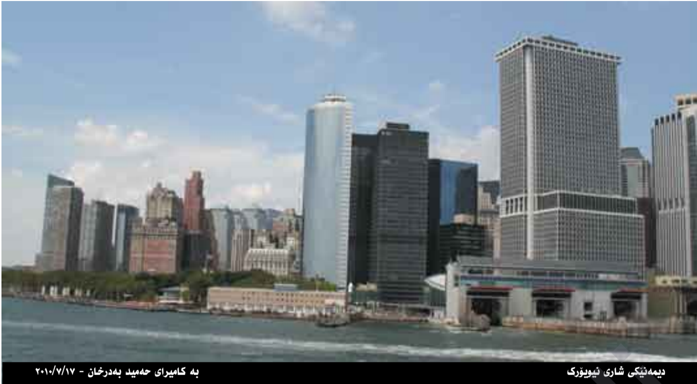
دېمەتېكى شارى ئىيوېرك

ھەر لە يەكەم ھەنگاوهه كه مرؤف پى دەنپتە ناو خاكى ئەمريکا ھەست بەوه دەكات كه لە ولاتيكە لە ھەموو ولاتەكانى دنيا جياوازتەرە. ولاتيكە پرە لە مرؤفى شيۆه جيا: مرؤفى ئەفريقي، چينى، يابانى، كۆرى، فليپپىنى، تايلەندى، ھىندى، ئيسپانى، پرتوگالى، ئەلمانى، ئىزلەندى، سویدی، بەلجىكى، نەروىجى، فئەلەندى، مەكسىكى، بەرازىلى، ئەرجەنتىنى، پىرۇۋى، پۆلىقى، نيكاراگوایى، پاراگوایى، ئۇرۇگوایى، ھندۇراسى، فەنزۆۋىلى، كۆلۇمبى، سەلفادۇرى، گواتىمالا، تشىلى، كەنەدى، ئالاسكايى، گرېنلەندى، فەرەنسى، ئىتالى، ئوسترالى، يۇنانى، ئەلبانى، كۆبى، روسى، جامايكى، ئىتنامى، پۇرتىرىكوۋى، ئەرمەنى، تورك، عەرەب، پاكىستانى، ئەفغانى، فارس، كورد و سەدان جۆرە رەگەزى تىرى لەخۆگر تووه. بەلام ھەرھەموويان لەيەك تاڤە شتدا وەكو يەكن ئەويش ئەويە ھەرھەموويان خۇيان بە ئەمريكى دەزانن و گوپراپەلى ياسا و نەريەكانى ئەمريکا دەكەن و خزمەت بەو ولاتە دەكەن و نامادەش پارىزگارى لى بەكن.