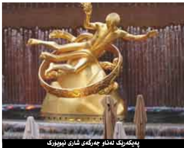
په یکه ریک له ناو جه رگه ی شار ی نیویورک

هونهر وه که به شیکیی گرنگی ژانی له وه ئه مریکایه به هه ر شوینی کتا دهرۆی هه ست ده که ی هونهر به شیکیی به کجار گرنگه له ژانی هه ر هاوولاتییه ک، به وه ی له نمایشه کانی سه ر شه قام ده بیینی خه لکیکی زۆر و بی شو مار به دیار نمایشه هونهری به کانه وه وه ستاون و به هه ماسه وه گوئی لی ده گرن و داوی ته واپوونی نمایشه کان وه کو که لتووریک پاره ده خه نه ناو سنده قه کان. نمایشی جه سته و کۆر دنه وه ی پاره له کاتی سه ردا نی کوردنی بۆ شار ی نیوجیرسی له ویلایه تی نیویورک بیینیان چه ند که سه یکی ره ش پیست خه ریکی نمایشی جووله و جه سته ن، که نمایشه کانیان به کجار سه رنجر اکیش بوو، داوی ته واکردنی نمایشه که ش به شیوه یه کی ئه و نه ده دلخۆشانه خه ریکی کۆر دنه وه ی پاره بوو، که مرۆف هه سته کا ئه وه وه کو بازرگانی له هونهره که ی خۆی ده روانی. سینه مای 3D هه ر له گه گل گه یشتمان بۆ نه مریکا هه وراز محمه دی هاوری و هاوگه شت زۆر جه ختی له وه ده کرده وه، که پیوسته سه ردا نی سینه ما بکه ی و شیوازی هۆله کان بیینی، زۆر هه ولیشمان بۆ ئه وه ده دا، تا کو رۆژیک هه ریه که له براده رانی گروپه که "حه سن یاسین، فه یسه ل عه لی، عه تا قهره داغی، هه وراز محمه د" چوو نه سینه ماو سه یری