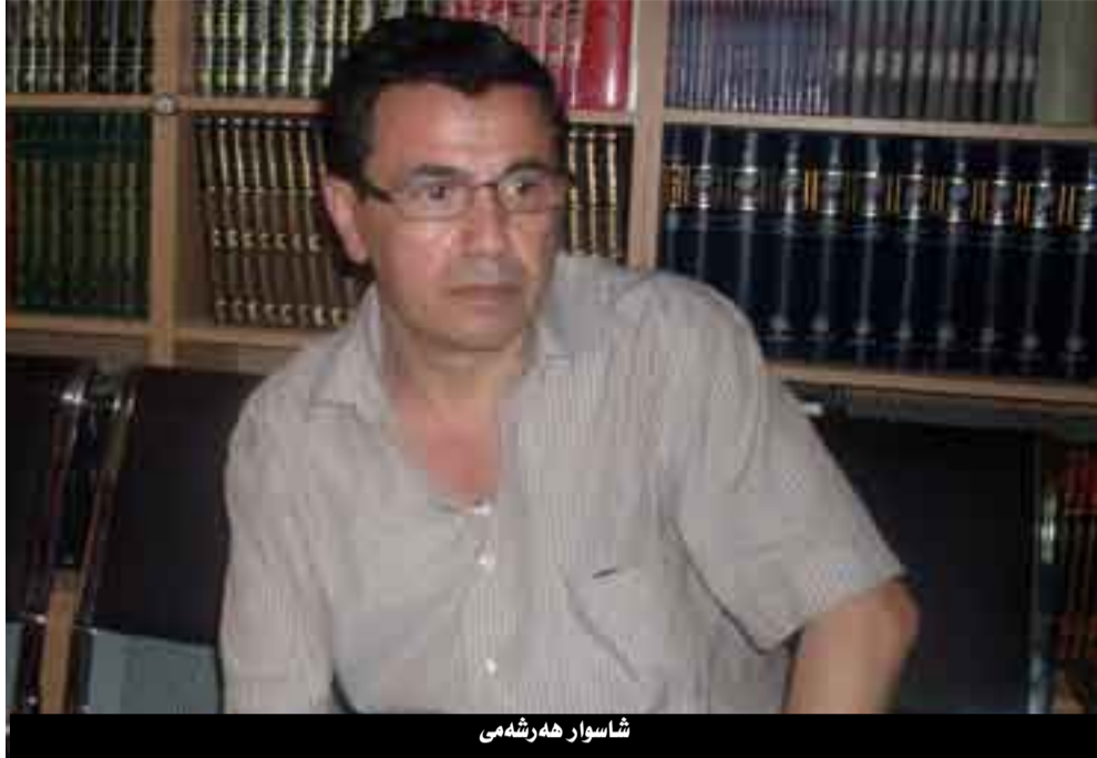
شاسوار هه رشه می