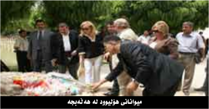
میوانانی هۆلیوود لە هە ئەبجە