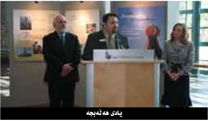
یادی هە ئەبجە