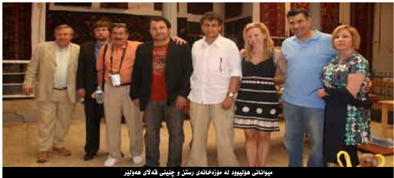
میوانانی هۆلیوود لە مۆزەخانەئێ رستن و چینی قەلای هەولێر

* دەکرێ خۆینەران و هونەرماندانێ کورد بەوه ناشنا بکەئێ لەرۆوی چۆنایەتیئێهوه چالاکییەکانی ئێوه چی لەخۆ دەگرێ؟