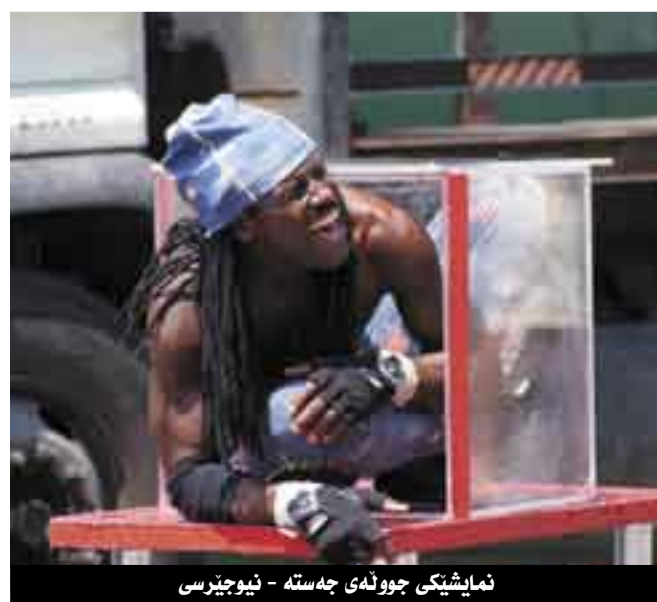
نمایشیکی جووله ی جه سته - نیوجیرسی

ولاتیکی پر بایه له هونهر هه ر له سه ره تای گه یشتمان به نیویورک و دواتر چوو نمان بۆ واشنتون دی سی بوونی ئه وه هه مو په یکه ر و تابلو ناسک و جوان و قه شه نگانه بووه جیی سه رنجی ئیمه، به شیوه یه کی باله خانه به رزه کانی به شیوه یه کی هونهری مامه له یان له ته ک کراوه و به رزی باله خانه که وه کو تابلویه کی قه شه نگ موزه خانه که ت پیده دراو له سه ره تای چوو نه زور ره و ته که سه یک وه ک رینیشاند هه باسی به شه کانی بۆ ده کردی، ئه و جا ئه وه هونهرمه ندانه ی تنه نا له راگه یاندنه کان گویمان له ناویان ببوو له وئ به تابلو قه شه نگه کان و په یکه ره ناسکه کانیان شادده بووین، ئه وه جگه له وه ی به شی زۆری ئه وه تابلو و په یکه رانی که له موزه خانه یه دا بوونیان هه بوو هی سه ده ی هه ژده و نۆزه دو