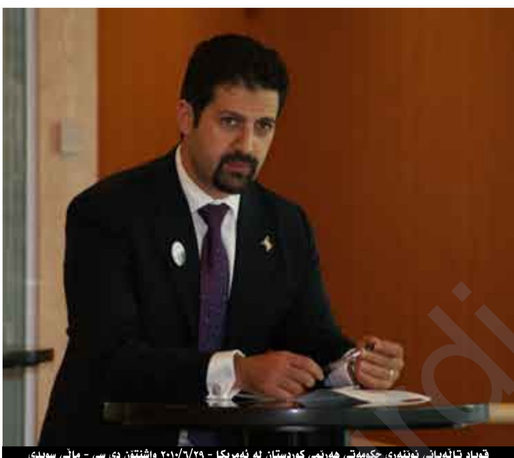
قوباد تالەبانى نوڭنەرى ھۆكۈمەتى ھەرىمى كوردستان لە ئەمىرىكا - ۲۹/۶/۲۰۱۰ واشنتۆن دى سى - مائى سوڤى

دوای سازکردنى ھەوتەمىن ڤىستىڤالى بەدرخان لە ۲۹ و ۳۰ ھوزەيرانى ۲۰۱۰ لە واشنتۆن، بەھەبەستى زياتر تيشك خستنه سەر پەيوەندى كەلتوورى ئىوان كوردستان و ئەمىرىكا وەكو پرديكى رووناكپىرى و رۇچىتر نىو كايە رووناكپىرىيەكان، ھەفتەنامەى بەدرخان لە واشنتۆنى پايتەختى ئەمىرىكا لە بارىگاي نوڭنەرايەتى ھۆكۈمەتى ھەرىمى كوردستان چاوى بە ھەرىمى نوڭنەرى ھۆكۈمەتى ھەرىمى كوردستان قوباد تالەبانى كەوت و كە لەو دىداردا كۆمە ئىك پرسىيارى سەبارەت بە پرسى كورد، ئەمىرىكا، كەلتور، لۆي خستە بەردەم بەرپىزان، شاھەنى باسە لەم دىداردا ھەردوو بەرپىزان: د. نازاد ھەمەشەرىڤ و د. ئىسماعىل مەھمەد ھەمى ھەرداغى نامادى بوون، ئەم دىدارش لەلايەن ھەمىد بەدرخان، بەرپرسى دەرگاي چاپ و بلاوكردەنەوى بەدرخان لەگەل بەرپىزان سازدراو.