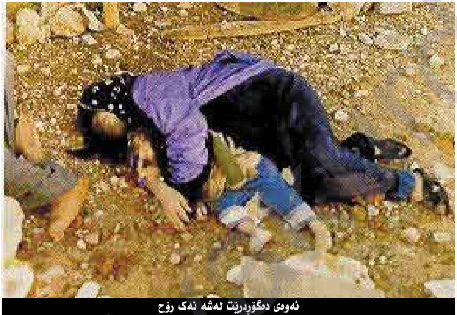
نه وهی ده گوردریت له شه نهک رؤح

نه م نه وه ناگه یه نیت من که سیکي داهینر بم ، زورجار شته کان نه گه ر ساده ش بن ده گنه دلان ، بؤیه له جه نجالی ژیاندا خوم ساده ده که موه وهک ژیانسی مه ولا و یارانی ، دمه ویت ره وان بم وهک کانیه که ی ته شار ، نووسینم جیکه ی نیاز بیت وهک کانیه که ی دامینی بابا یادکاری پیری مه وله وی و کانی ناهايتا ، ئیمه هه موومان پیش خومان هه بووین و دواي خوشمان ده یین ، نه وهی ده گوردریت له شه نهک رؤح .