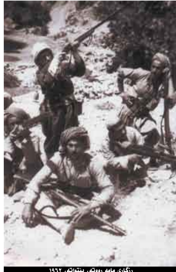
رزگاری مامه رووته، بێتاوته، 1962

جهلال وتی: با لهسهر ئهو گرده نهختی لادهین، لاماندوا مام له ولاغهكه هاتهخوار و لهناو ئهو ههگبهی پی بوو، رادیویهکی ناوهند، "سگ" له ناو کارتۆن هیتا دهروهو دیاربوو له عهلی ئیستگهیهك دهگهرا، میلهکهی لهوسه دهرده ئهوسه و ههر خشی دههات، توپهبوو،