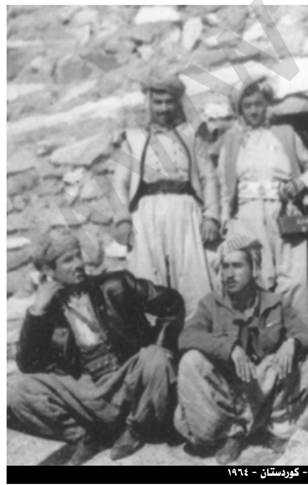
سورکیو - سنووری ئیران - کوردستان - 1964

مامهرووته دهکن دهلین بهلکو بچیت بۆ لای بارزانی، بۆ ئهوهی ئیجازه مان بدات مال و مندالمان ببینین، رووتشه یهكسهر دهراو دهچیته خزمهت بارزانی و پیتی دهلی و شهکویان بۆ دهکات، بهلام بارزانی نهر دهلی: رووته ئییان گهری شهکویان بۆ مهکهو داوای ئیجازه یان بۆ مهکه، رووته دهگه رپتهوه لایان و پینان دهلی جارێ تهحهمول بکن، جهنابی بارزانی لیتان تووردهی. جارێ واله 66 شهویک ئهوانهی دۆلهرهقه هموو دهرۆن و دهچنه بهغداو دیسان ماوهیهک شهری براکوژی دهست پیدهکاتهوه و تا سالی 1970 بهیانی 11 ئازار مفاوهزات لهگهڵ شهۆرش به سهرکردایهتی بارزانی نهر و حکومهت دهستی پیکرد، لهوکاته حکومت نیازی باش نهبوو، ویستی شههناوخویهکه توندتر بکات، بۆیه ئهحمده حسه ن بهکر وتی: ئهو جهماعهته غیر نیزامین جا لیره حکمهت و دلسۆزی و شههامةتی بارزانی نهر یهكسهر ئهوانهی هموو عهفوکردو تیکه لاوی ناو شهۆرش و پارتی کردنهوه بی