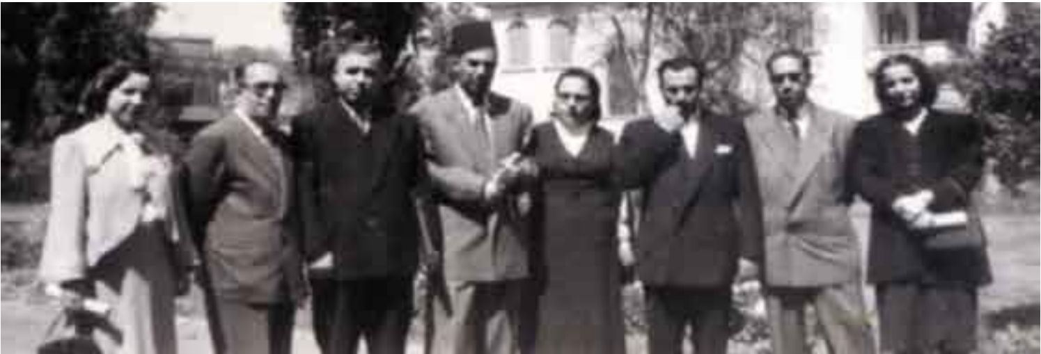
رەوشەن خان، شام ۱۹۴۵

پیش ۴، رۆژ ئەو ئازیزی کە لە یادەکان و رۆژانی وەکو ئەمەق کە پێسی دەگوتریت چلە مامەن لە پیش هەموواندا ئامادە دەبوویت، مخابن ئەمەق ئیمه لێرین و تۆش لە دوری دوروو تەمانشای ئیمه دکەیت و لەپاشان هەرچی کەم و کوریەک هەیه وەکو چاران بۆ ئۆستە ئازیزیگەن و ئەو کەسانە کە هاواریت بوون لە زیندان و زانکۆی بەغداو هاواریانی ریکخستنی نهنیت و لەپاشان پێشمەرگەکانی شاخ... بەرپرسی حاکم قاسم: پیش ۴، رۆژ لە راگەیاندنەکاندا زۆر نووسرا، زۆر گوترا، بەتایبەتی هەفتەنامەیی بەدرخان کە چەند وتاریکی ئامادە کردبوو، لەویدا باسی ژیاقت و ژیاقتی رۆژانەو خەباتی شاخ و شارتمان کردبوو، هەر لەویدا باسی ئەوەمان کردبوو کە تۆ مۆفقی پاک و بێگەرد و حەقیق و پیاویکی لەروو جەسوور بووی، وەلی هەندێ جاریش دەبوو باجی ئەو جەسووربێ بەدی، مخابن هەندێ جار خەمی نان و ژیاقت و مال و منداڵ ئەوەندە هیلاک و پەریشانی کردبوو کە بە بەردەوامی دەتگوت: لەهێچ ناترسم ئەنیا لە مردنیک کتوێر. حاکم گیان ئوغرت خیر: تۆ لەبەر ئامبەر پیاوه بوودەلەکان خەمت نەبوو، خەمی گەورە تۆ خۆیندن و خۆیندەواری و هوشیارکردنەوەی کۆمەلگا بوو، ئەو ئیمه نییه جوان فەرهاد گەلالی لە نامەییەکیدا بۆ تۆ دەلی: ئەو هەولی دەدا بە نووسینەکانی خشتیک بخاتە سەر ئەو هەولە ژۆرانی کە لەو پێناوەدا دراو، مخابن هەمووانی لەگەڵ خۆی راپێچ کرد و بردییه ئێو ئەو دنیا یه تاهەتایه مۆکری نابینیهوه. لە کۆتاییدا بەناوی ئەنجومەنی دەزگای چاپ و بلاوکردنەوەی بەدرخان سەرەخۆشی لە کەس و کار و بنەماله بەرپرسیارێکیان دکەین. * تیپینی: ئەم وتارە دەقی و تهکهی حامید نوبیەکر بەدرخان بەرپرسی دەزگای چاپ و بلاوکردنەوەی بەدرخان، کە لە چلهی حاکم قاسم لە هۆلی شەهیدانی (۱) شوبات خۆیندیهوه.