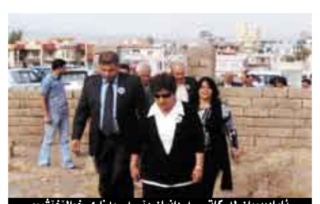
ئامادەبووان لە كاتى سەردانىان بۆ سەر مەزەرى خوالىخوشبوو

باقى سىمىنارەكەى بەرپوچەبەرد، دواتر عەبدوللە تىف گلى لەماوەى ۲۰خولەكدا و لەژىر ناوى "رۆلى مامۇستا صلاح سەعدوللا بەرپوچوو" پىشكەش كرد و رەمەزان قاسر ئەو سىمىنارەى بەرپوچەبەرد، كۆنايى سىمىنارەكانىش محەمەدسەلىم سوارى بوو، كە لەژىر ناوى "يادگار و ميناك" سىمىنارىكى پىشكەش كرد محەمەد حەسەن بىناقى بەرپوچەبەرد. لەكۆتايى يادەكەدا سى كىبىي نووسەر دابەشكرا، كە تايبەت بەو يادە چاپكراوو لەژىر ناوى "گافان و مسيرە السنين"، كىبىەكان سەرى بەرگ بوون و برىتى بوون لە بەرگى يەكەم ئەلبومى وىنەى تايبەت بە نووسەر بوو، بەرگى دوومەيش برىتى بوو لە چەندىن وتارى نووسەر كە كاتى خۆى لە رۆژنامەكانى تەخاى، نىتىجاد، ئەلسەباح، ئەلحەيات، ئەلئەمالى، ئەلسەورە و ئەلعىراق و چەند شوئىنكى دىكە بلاوى كرەبوونەو، لەو كىبىيە دووبارە بلاوكرەوتەو. جىي ئامازەيە سەلەح سەعدوللا لەدايكبووى ۱۹۳۰ى زاخو و تا ئەو كاتەى لە تەمەن بوو، ۲۵ كىبىي بە چەندەها زمان