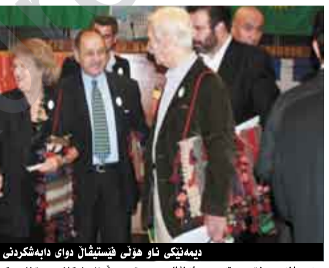
دېمەتتىكى ئاۋ هونى فيستىقال دواى دابەشكردى خەلاتەكان

ئەم دەزگايە سال لە دواى سال زۆر بە رىكويېكى چالاككەكانى لە ولائەتسى نادىدا ئەنجام دەدات، بەردەوامى بە چالاككەكانى خۆى دەدات و بە هيوايە لە سالانى دىكەدا چالاككەكانى چروپرت و بەرفراوتتر بىت.