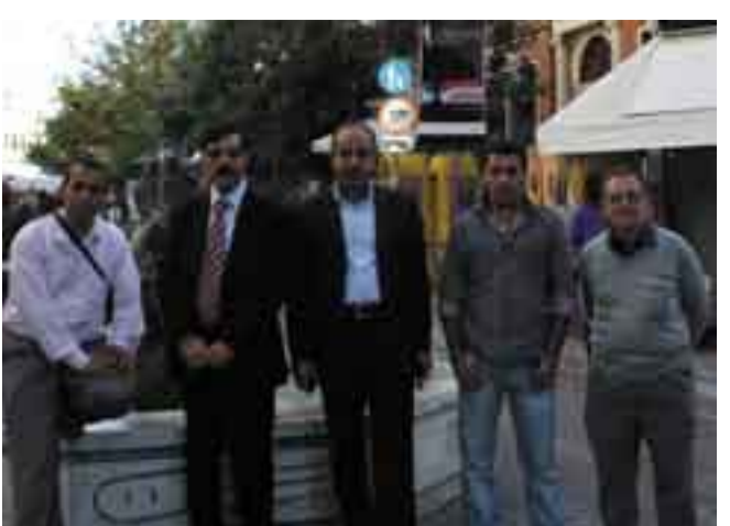
شاندى فيستىقال و كوردىكى دائىشتووى يۇنان

ئەم دەزگايە سال لە دواى سال زۆر بە رىكويېكى چالاككەكانى لە ولائەتسى نادىدا ئەنجام دەدات، بەردەوامى بە چالاككەكانى خۆى دەدات و بە هيوايە لە سالانى دىكەدا چالاككەكانى چروپرت و بەرفراوتتر بىت.