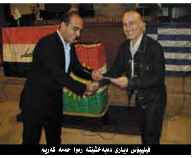
فيليبوس ديارى دېبەخشىتە رەوا حەمە كەرىم

دواى كۆتايى هاتنى فيستىقال بەرەدەپە، ئەم دەزگايە سال لە دواى سال زۆر بە رىكويېكى چالاككەكانى لە ولائەتسى نادىدا ئەنجام دەدات، بەردەوامى بە چالاككەكانى خۆى دەدات و بە هيوايە لە سالانى دىكەدا چالاككەكانى چروپرت و بەرفراوتتر بىت.