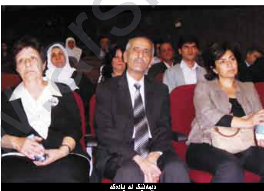
دېمەتېك لە يادەكە