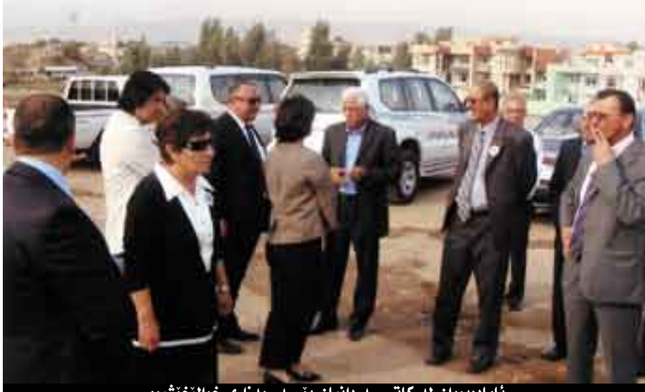
ئامادەبووان لە كاتى سەردانىان بۆ سەر مەزەرى خوالىخوشبوو