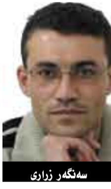
سه لنگه زراری

و دۆژمانی عه راق لیک جیا ده کاته وه ریژانی راسته قینه و زانسته یانه بو دوارۆزی گه شی عه راق و بی که هه ژانی هه مو نه ته وه ده کان به تایبه تی گه لی کورد و عه ره ب و مسو گه رکردنی ژبانیکی ئاسو وده خو شوکو زه ران و سه ره یه خو بو هه مو لایه که و دوور له خویندو ژان و مالمو رانی و سه ره کهدانی و له ده ستدانی سه ره وری عه راق و ده سته و ته دیمو کراسیه کانی، که تائینتا به ده ستمان هینا وه له سا یه کی خه یاتی دژاور و پر له فیداکاری و خویندو ژانی شه هیده نه مه ره کانیان، بو یه ده بی هه لێزاردنی داها تو و به راهستی و نه سو وستی و دوور له ده ست تیه مردانی دۆژمانی ده ره وه نا وه وه ی عه راق ئەنجامدیریت و نابی به هیج پاساو بیانو و ده کو کۆسپ و ته گه ره بخریته پی شه یه وه ده بی هه مو ئاسانکار یه کیش بکری ت بو ئه وه ی زۆر ترین ده نگه ده ران بته وان بکه نه سه ر سنو وقه کانی ده نگدان و تا به وه پری ئازادی و باو هه بخو بوون نوینه ره کانی خو یان هه لێزاردن و دوور له هه مو سو و نوور دانا ن و فرت و فیل و هه ره شه و به کاره ییانی پارو و کورسی و دیاری و ریژلانی کاتی. ماوه ی زیاتر له ٢-٣ مانگه رو ژانه له میدیاکان باس له وه ده کری ت، به پارت و لایه نه سیاسیه کان و ئەنجومه نی نوینه رانی عه راق سه ر قالی چۆنیه تی به ری وه بره دنی هه لێزاردنی داها توون، هه ر یه که له م لایه نانه به ته رازووی