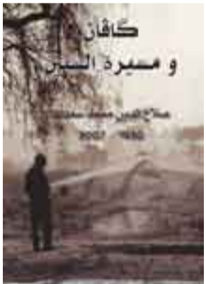
بەرگى كىبىي چاپكراوى خوالىخوشبوو

چاپكردبوو، لە ۲۰۰۷/۱۰/۲۲ لە شارى ھەولير كۆچى دوايى كرد، لەدواى خۆشى شاكارى مەم و زىنى ئەحمەدى خانى بەزمانى ئىنگلىزى چاپكرا، كە لەزمانى كوردىيەو وەريگرايوو سەر زمانى ئىنگلىزى و لە توركيا لە دەنگاى ئاقىستا لە ئەستەنبول لە ۲۰۰۸ بەچاپ گەيەنرا، ھەر لەو كىبىيەدا بەدەست و خامە رەنگىنەكانى ھونەرمەندى كۆچرە دوو د. محەمەد عارف سىكچ و تابلوكانى ناو كىبىيەكەى كىشابوو، بە خەيال گوزارشتى لە رووداوەكانى ناو شاكارەكە كرەبوو.