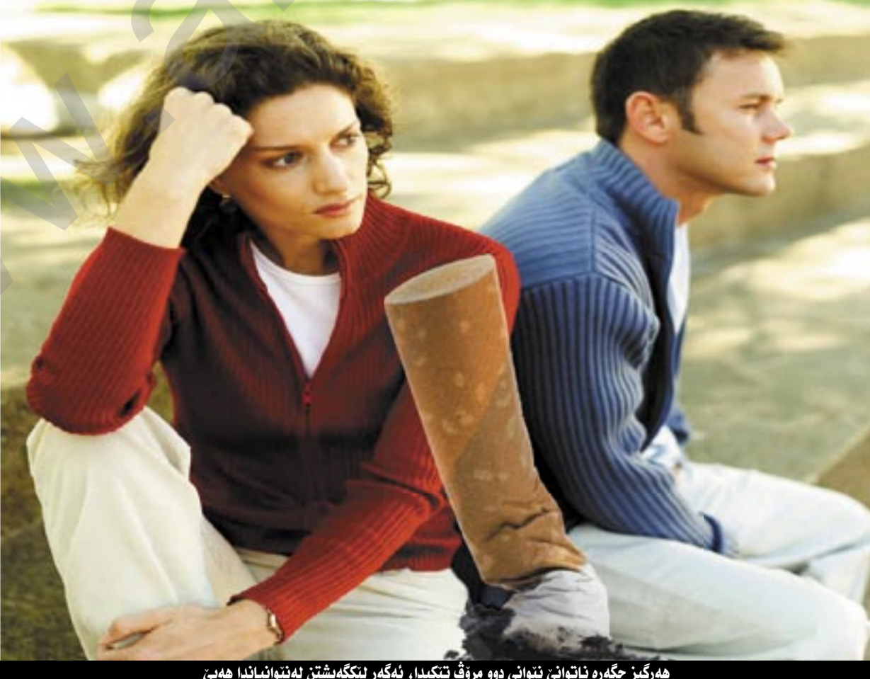
ھەرگىز جگەرە ناتوانى ئىتوانى دوو مروف تىكېدا، ئەگەر ئىكەيشتن لەئىتەنئاندا ھەب

دەپچىتەو و دەچىتەو مالى باوكى. دەست بەسەرداگرتنى كەژال و نەدانەوئى ھەمان رۆژ ئىوارەيەكى رەنگ بە خۇى و مندالەكانىيەو دەچىتە مالى باوكى كەژال، بەلكو ئەو خوايە دلى كەژال نەرمكاو لە گەل خۇيدا بېھىنئەتەو، وەلى باوكى كەژال مندالەكانى لە دەست دەرىنئ و بە توورەيەو پى دەلى: "ئوئ ئەو قەباحەتەى كرىوتە، جارېكى تر لىزەت نەبىنەو".