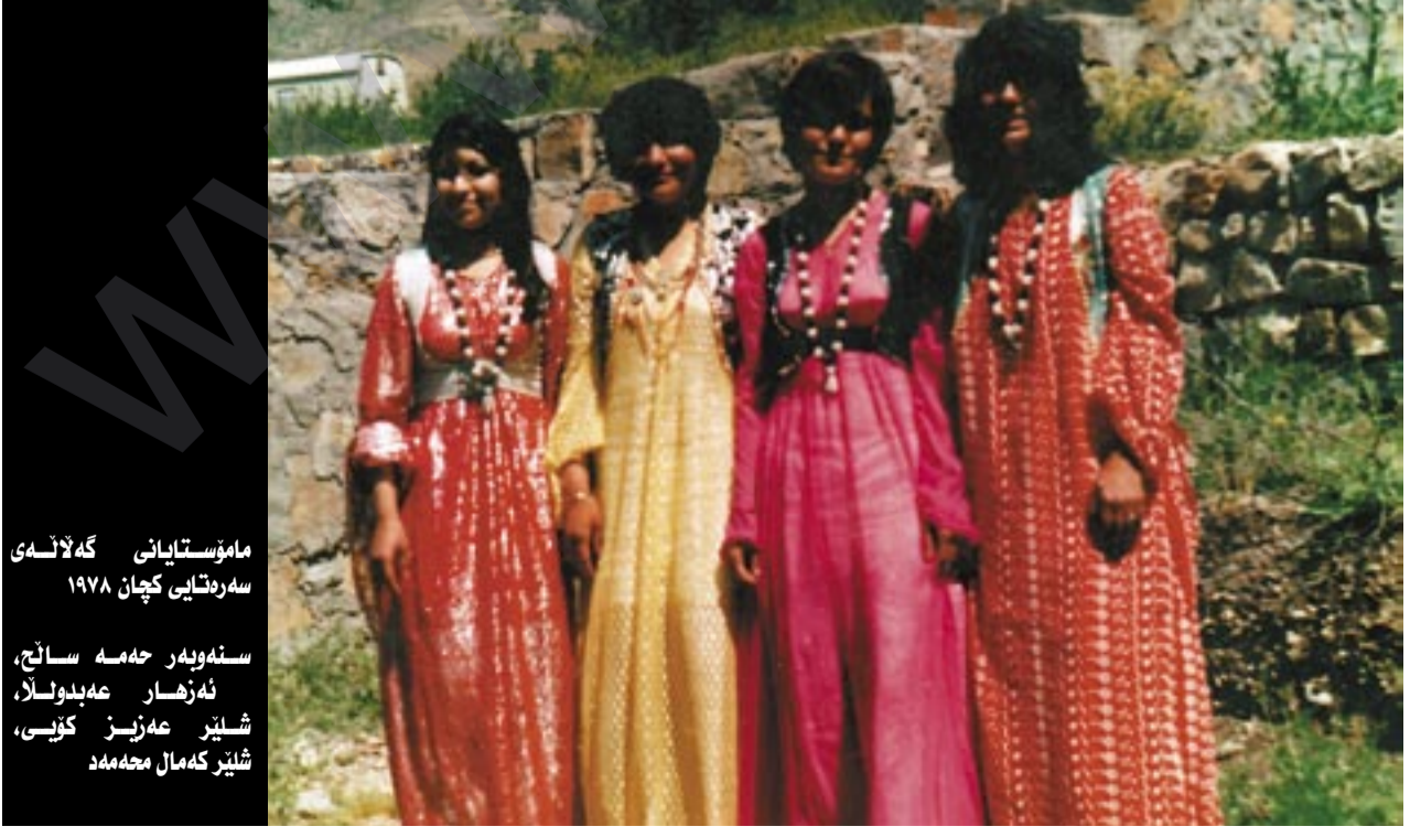
ماموستایانی گه لاله ی سه ره تابی کچان ۱۹۷۸

باله کایه تی دهقه ریکی ستراتژییه و به دریتابی میژوو لانکه ی شورش و کوردایه تی و سه نکه ری به رگری پینشمه رگه کان بووه و زیاتر له "۱۴" سالیش "بازانی نه مر" له و ناوچه یه سه رکراده تی شورش کوردی کردیوه و ته وای خه لکه که ش به دل و به گیان له کاروانی خه بات و به رخدان دانه براون و سه دان شه هیدیان کردۆته قوربانی شورش کوردستان و زمانی پاکي باوان، بویه چه ند جار دووچاری مالمویران و راگوزان هاتوون. خو شبه ختانه خه لکی دهقه ره که دوی راپه ریکه مه زنه که ی به هاری ۱۹۹۱ زۆر به بیان گه رانه وه گونده کانیان و خاک و خولی باله کایه تیان مساج ده کردیوه و سال و رهن و باخه کانیان ریگ ده خسته وه.