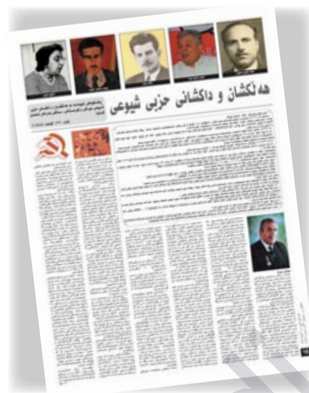
ژمارە ۱۲۳ ھەفتەنامەى بەرخان ۲۰۰۹/۸/۸

تاكو ئىستى لە خۇدى رووسيا حزبى شىوعى دوومىن ھىزى سىياسىيە. لە كوردستانىش سەرەراى دەنگەكانى ھەلئىزاردن تاكو ئىستى شىوعىيەكان لە خەباتى چىنايەتى و نىشتىمانى بەردەوامن دلسۇزى كىشەى رەواى كوردن، نازانم بۆ بەشكىك لە "ھەقلاڭن" ئەوئەندە كەففىان بېت بلئى "دارمانى شىوعىيەت!!" و ئەمان كاتىشدا كۆنە بەعسى لە ئەنقالچى لە ئامىز دەگىرىن!! ۷- لە وەلامىكى كاك كەمال مەدېندا ھاتوۋە "زۆر لە سەركردەكانى حزبى شىوعى جۈولەكە بوون كە بىكون!!" لەگەل دەولەتى ئىسرائىل پەيوەندىيان ھەبوو.