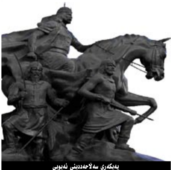
بەلگەرى سەلاھەددینی ئەیوبی

بىخاتە ناو تۆمەتى بەتالەو، كە بەرەو كىشەيەكى درېژ رايدەكەشنى، بەلام باباي نامۆ ميوان لە كوردەكان ھېچ كامى لەو مەبەستانەنى نىيە، جگە لە سەقامگىر كوردنى ئاسايش نەپت. "شادى" پالەوان چالاكى و ھىمەتى بەرزى خۇي نواند بە سەرنجراكىشانى خەلكى بەرەو لاي خۇيداو، "مجاھد الدين بەھرۇز" واي روانى كە كارمەندى ئەو بى لە "تكرىت" و، لەگەل دەستەيەك لە گەلى كوردى خۇيدا بە كارەكەى ھەلسى، كە سروشت و رەوتى ئەوانى دەزانى و، ھۆكارە ئاسايشىيەكان بېاريزن و، كىشەو ناكۆكېيە نژوارەكان لەناو ببات، جگە لەمەش و ھەردو كوردەكانى "ئەيىوب و شېركۆ"، كە ھەردو گەنج بوون بە ئازاد دلېر ناويان دەركەبوو، ھەردووكيان دەين بە قۇل و بازووى ئەو، بەم چەشەنە "تكرىت" بوو بە مەلەندىكى ھىورو ئاسايش بۇ ئەو خېزىنەنى لە "دووين" موە ھاتووە. كىشەو دەبەرىكرا چوون لەم ولتەدا روومو ئەمان نە بو و، "بە غاد" خۇشى سەرگەردان مابووە لەوھى نەباران و كېبەر كىكران دەكەن، كاتى شادى بوو فەرمانزەوا لەگەل جووتە كوردەكانىدا، كورد ھەستى بەوانە كورد، كە ئەوانەنى كاربەدەستەن ھاورەگەزى خۇيانىن، بۇيە چوونە ژىر فەرمانى ئەوانەو لەسەر ئەوانىان دەكردەو لە مەترسى و رقى ئەوانىان دەپاراستن. "شادى" كۆچى دوايى كورد، دو لە رۆلەكانى مانەو، كە سەرۇكايەتى گەلەكەيان بەگەن، بى ئەوھى ھېچ برايەك لەو دوو براينە دەستدريژى بكاتە سەر ئەوھى دىكەيان، "ئەيىوب" كە برا گەرە بسو چاوتېرى مافى براكەى دەكردو چاوتېشى لە ھەلەكانى دەكرد، وەكو ھەلەى بەرۇش نەبوونى بە رازىكردنى "بەغداد" كە شىوئى شەرەقسەيە وەكو ئايىندە دېتە