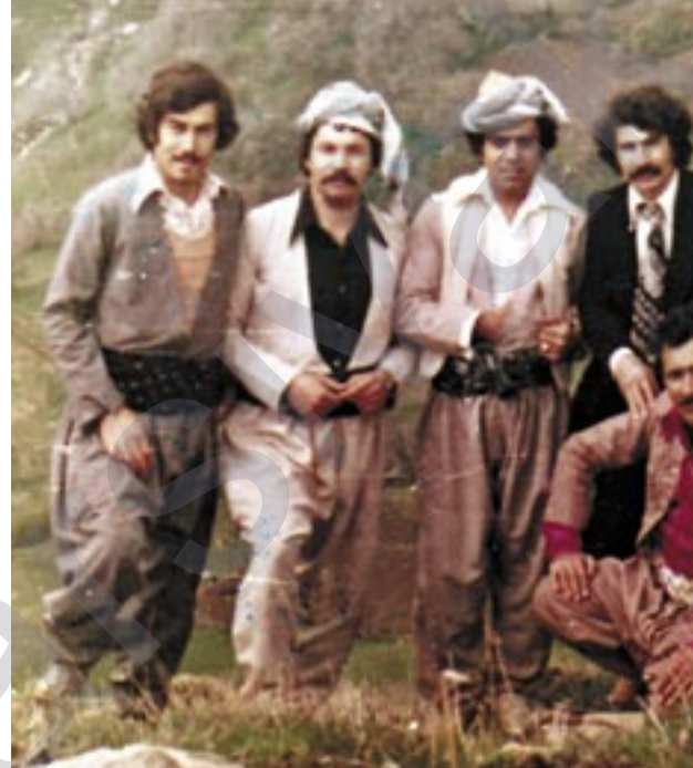
شه هیدی سه رکرده هه سه ن کوردستانی له گه لاله ماموستایانی گه لاله، به هاری ۱۹۷۸

رهنگین ده رازیته وه. ماوه ی "۱۴" سال "بازانی مسته فای نه مر" له و ناوچه یه سه رکراده یه